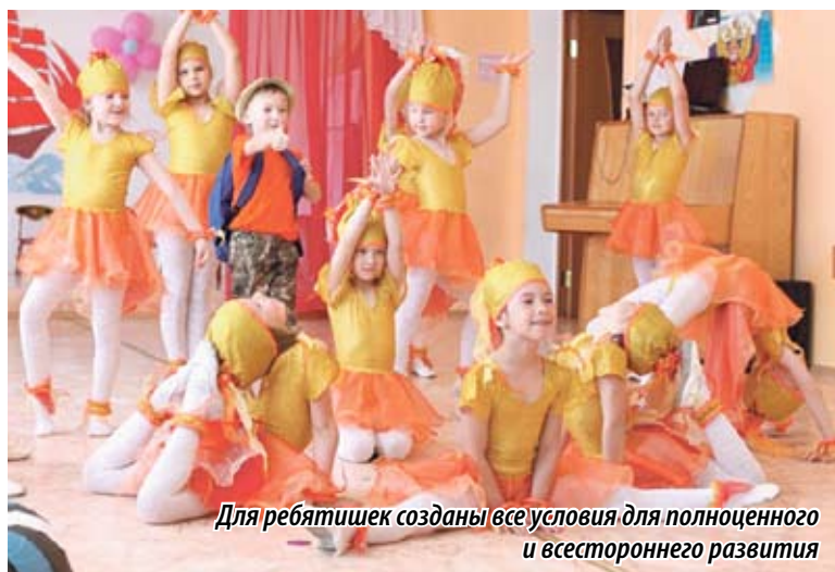
Для ребятишек созданы все условия для полноценного и всестороннего развития