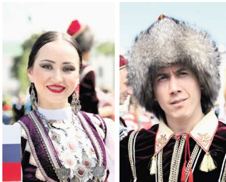
Это праздник каждого гражданина России