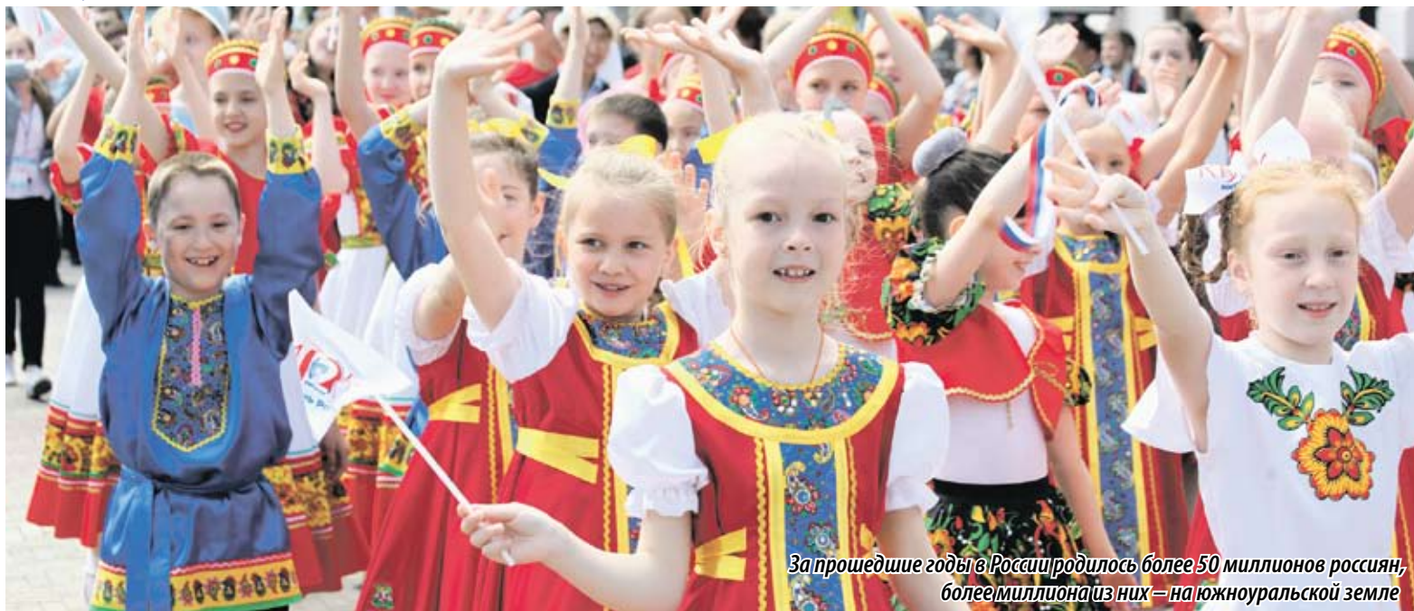
За прошедшие годы в России родилось более 50 миллионов россиян, более миллиона из них — на южноуральской земле

Также праздничные торжества прошли в горсаду имени Пушкина, парке имени Тищенко, Саду Победы и на многих других площадках.