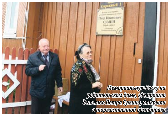
Мемориальную доску на родительском доме, где прошло детство Петра Сумина, открыли в торжественной обстановке

На открытие мемориальной доски вместе с гостями пришли земляки первого губернатора Челябинской области.