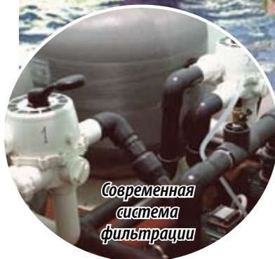
Современная система фильтрации