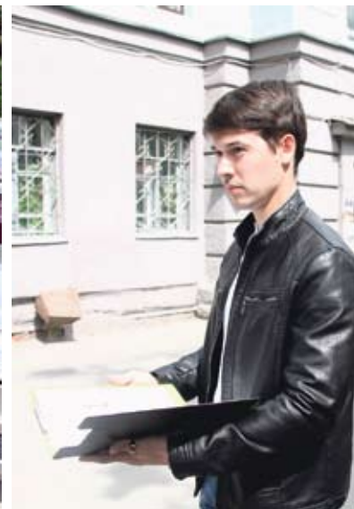
На улице Свободы сотрудники управления благоустройства фиксируют нарушения — машины стоят на газонах и тротуарах

На всех нарушителей был наложен штраф. К слову, на его оплату дается два месяца. Если за это время штраф