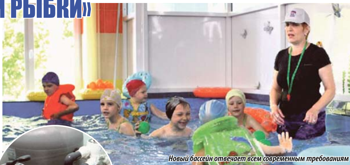
Новый бассейн отвечает всем современным требованиям

ВДОВОЛЬ НАПЛЕСКАТЬСЯ В ВОДЕ, ПОПЛАВАТЬ И ПОНЫРЯТЬ – «ЗОЛОТАЯ РЫБКА» НА ДНЯХ ИСПОЛНИЛА ДАВНЮЮ МЕЧТУ ПЕДАГОГОВ И МАЛЫШЕЙ ДЕТСКОГО САДА № 37 ПОСЕЛКА ГОРНЯК ГОРОДА КОПЕЙСКА. 14 ИЮНЯ СОСТОЯЛОСЬ ТОРЖЕСТВЕННОЕ ОТКРЫТИЕ БАССЕЙНА, О КОТОРОМ ЗДЕСЬ МЕЧТАЛИ НЕ ОДИН ГОД. НА ПРАЗДНИК ПРИЕХАЛ ПРЕДСЕДАТЕЛЬ ЗАКОНОДАТЕЛЬНОГО СОБРАНИЯ ЧЕЛЯБИНСКОЙ ОБЛАСТИ ВЛАДИМИР МЯКУШ (ФРАКЦИЯ «ЕДИНАЯ РОССИЯ») И ДЕПУТАТ ОБЛАСТНОГО ПАРЛАМЕНТА, ПРЕДСЕДАТЕЛЬ КОМИТЕТА ПО ИНФОРМАЦИОННОЙ ПОЛИТИКЕ МАРИНА ПОДДУБНАЯ (ФРАКЦИЯ «ЕДИНАЯ РОССИЯ»).