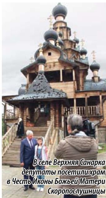
В селе Верхняя Санарка депутаты посетили храм в честь Иконы Божьей Матери Скоропослушницы