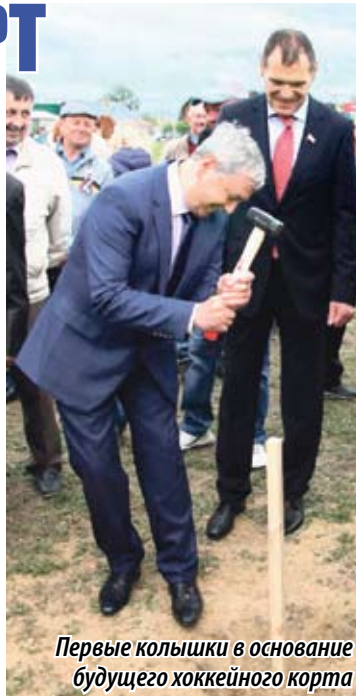
Первые колышки в основание будущего хоккейного корта

Конечно, чемпионами станут не все, но у каждого ребенка будет возможность заниматься спортом.