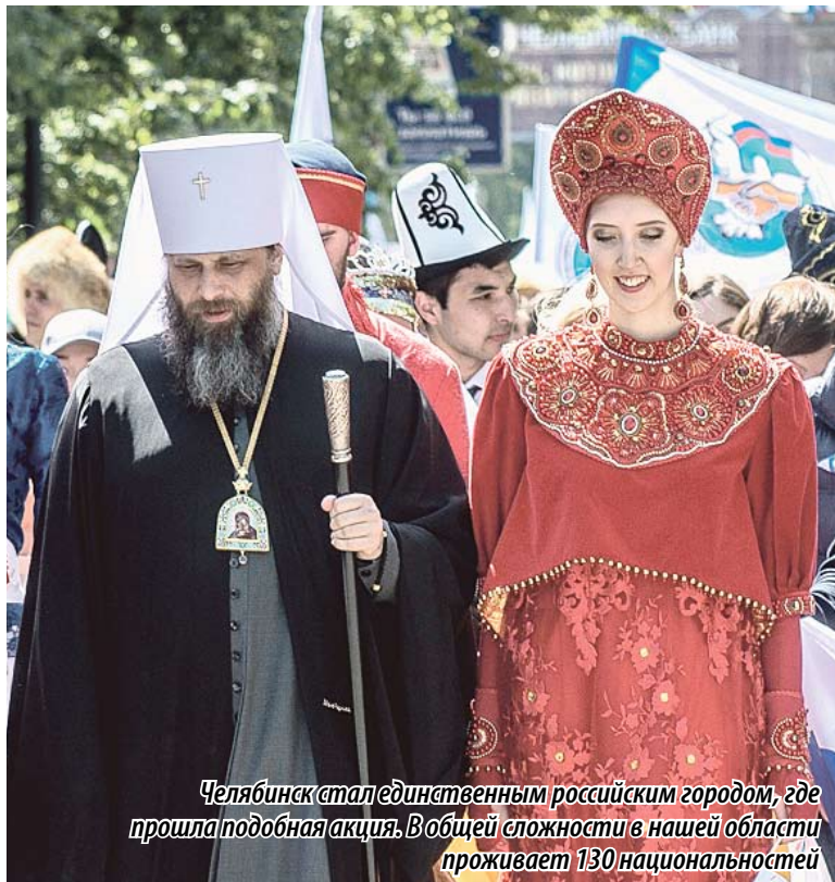
Челябинск стал единственным российским городом, где прошла подобная акция. В общей сложности в нашей области проживает 130 национальностей

« Это праздник каждого гражданина России. Мы по праву гордимся нашей страной, ее выдающимся вкладом в мировую культуру, достижениями в области науки и техники, верим в ее огромные возможности, в ее блестящее будущее. Уверен, что только в условиях мира и стабильности возможно дальнейшее совершенствование экономики, качественное улучшение жизни людей. От созидательного труда каждого из нас, инициативы и гражданской ответственности зависит процветание нашего региона, нашей страны. »