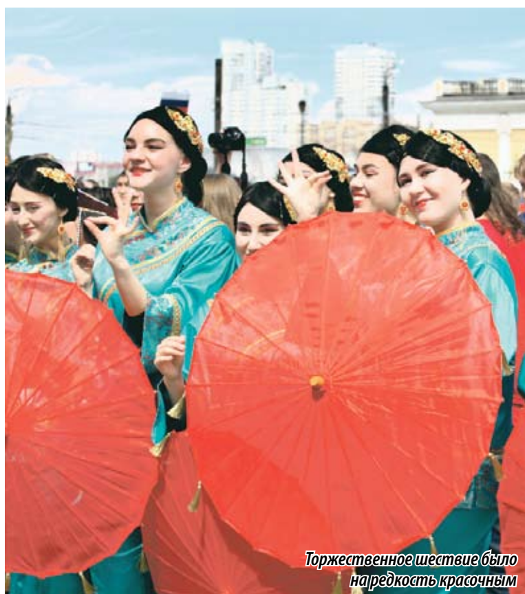
Торжественное шествие было на редкость красочным