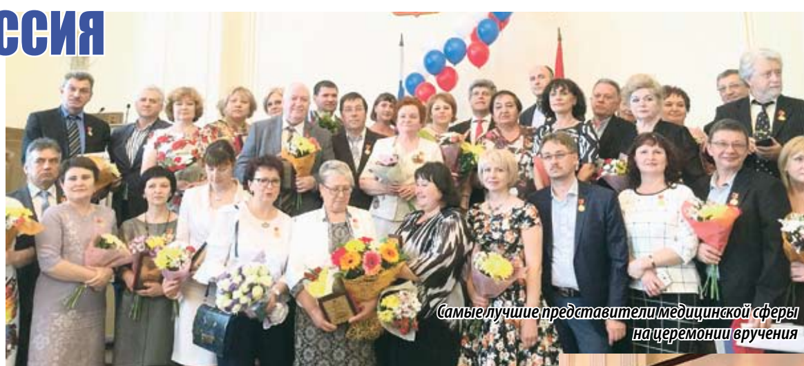
Самые лучшие представители медицинской сферы на церемонии вручения

главе угла у нас стоят вопросы реализации майских указов президента Российской Федерации Владимира Путина. Это, прежде всего, выполнение индикативных показателей по заработной плате медиков. Я надеюсь, что мы справимся с этой задачей, и медики будут благодарны областным властям за то, что делается для создания комфортных условий для их работы. Также огромное внимание уделяется созданию материальной базы – у нас идет строительство новых суперсовременных объектов. Совсем недавно мы сдавали перинатальный центр, который уже работает в полном объеме. Сегодня строится ряд новых объектов, приобретается необходи-