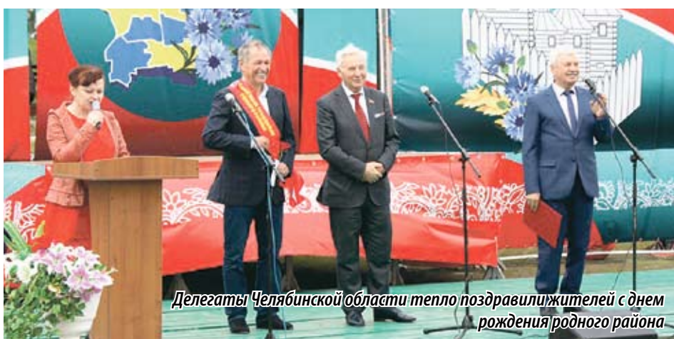
Делегаты Челябинской области тепло поздравили жителей с днем рождения родного района