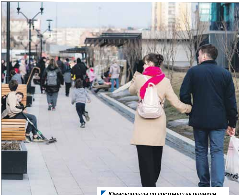
Южноуральцы по достоинству оценили благоустройство набережной в Челябинске.