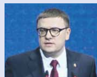
Алексей ТЕКСЛЕР, губернатор Челябинской области (из обращения к Законодательному Собранию):

Таким образом, параметры бюджета Челябинской области на этот год составляют по доходам — 220 млрд 753,4 млн рублей, по расходам — 266 млрд 853,1 млн рублей. Дефицит — 46 млрд 99,7 млн рублей, который в полном объеме покрыт остатками собственных средств областного бюджета и льготными федеральными бюджетными кредитами, без привлечения коммерческих займов.