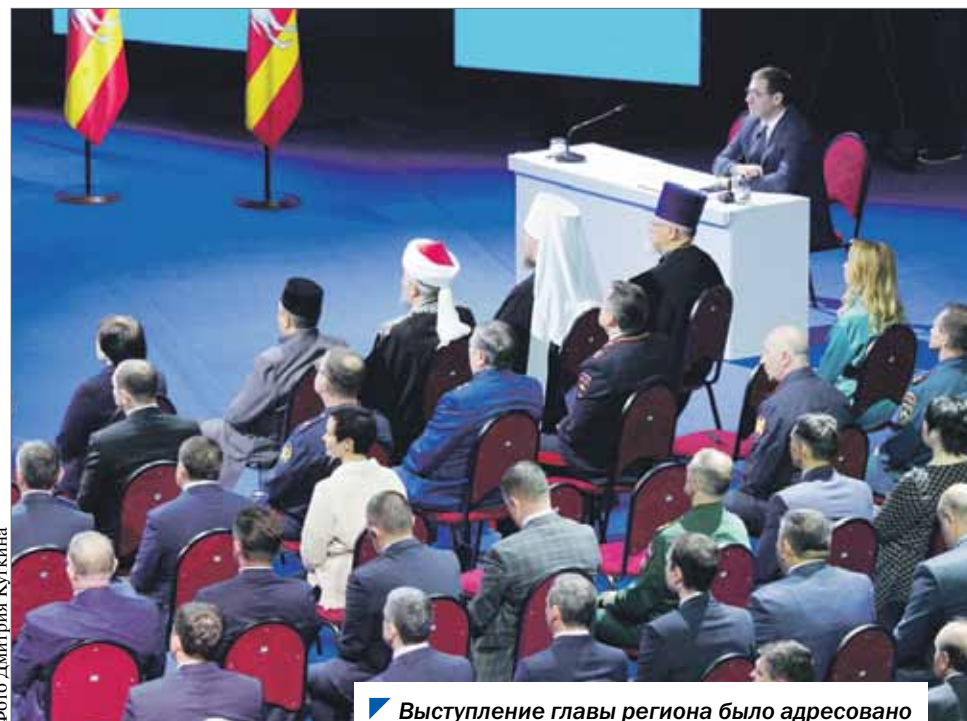
Выступление главы региона было адресовано представителям разных слоев общества.

направит только региональный бюджет для ежемесячных выплат на детей от 8 до 17 лет.