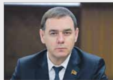
Александр ЛАЗАРЕВ , председатель Законодательного Собрания Челябинской области:

— В сегодняшней ситуации важна открытость власти перед жителями, люди должны четко понимать, какие предпринимаются меры поддержки, какие средства выделяются на ключевые сферы жизни. Поэтому такие обращения обязательно должны быть, не только от губернатора, но главы муниципалитетов в территориях должны как можно чаще встречаться со своими жителями.