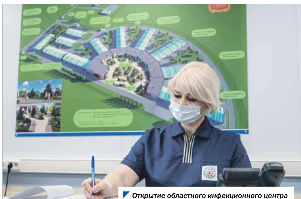
Открытие областного инфекционного центра стало знаковым событием последних трех лет.