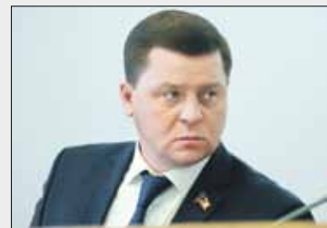
Вадим РОМАСЕНКО , заместитель председателя Законодательного Собрания:

У нас нет времени на раскачку, законы, которые принимаются сегодня, должны начать работать на благо населения. Челябинская область — это одна большая команда. Вместе мы преодолеем любые трудности.