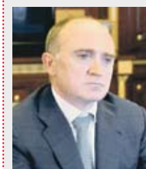
Борис Дубровский, губернатор Челябинской области:

– Откликаясь на предложения и вопросы избирателей, которые поступили к нам во время предварительного голосования, мы выступили с инициативой обратиться к собственникам крупных предприятий с просьбой о повышении зарплат