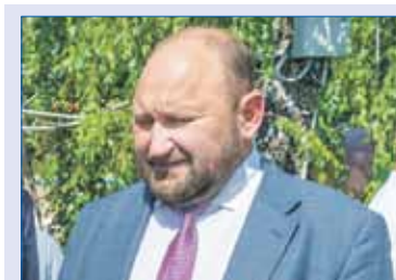
Евгений ВАГАНОВ, глава Сосновского района:

— Проблемой при подключении новых абонентов к газораспределительным сетям и увеличении количества подаваемого объема газа в некоторых населенных пунктах является отсутствие свободных лимитов газа, — пояснил Евгений Ваганов.