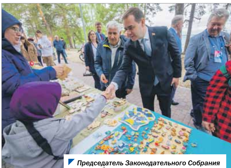
Председатель Законодательного Собрания тепло пообщался с юными снежинцами.

входе в парк любители литературы могли поучаствовать в акции «Литературное ГТО», ответив на вопросы об авторах и их произведениях, а также проверить свою эрудицию в чемпионате кроссвордистов «50 вопросов о Снежинске».