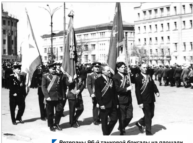
Ветераны 96-й танковой бригады на площади Революции в Челябинске 9 мая 1975 года.

уроженцев Челябинской области, только начала боевой путь. Сначала действовала в составе войск Воронежского фронта, позднее приняла участие в тяжелейшем сражении на Курской дуге. Бойцы бригады освобождали от немецких оккупантов Советскую Украину, королевство Румынию и Болгарское царство. В награду за взятие болгарского города Шумла в сентябре 1944 года Ставка Верховного главнокомандования присвоила бригаде наименование Шуменская. Вскоре после войны бригада была расформирована, а бойцы вернулись домой.