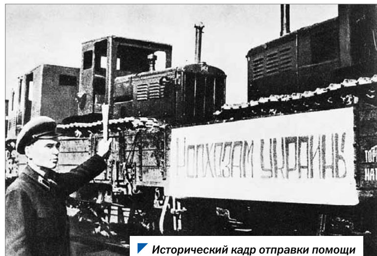
Исторический кадр отправки помощи в Донбасс из Челябинской области.

Полную версию статьи, в которой несложно провести параллели с днями сегодняшними, читайте в следующем номере.