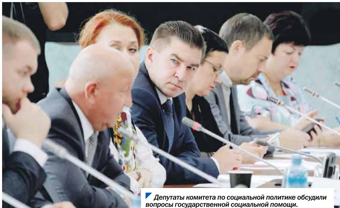
Депутаты комитета по социальной политике обсудили вопросы государственной социальной помощи.

На очередном заседании комитета Законодательного Собрания по социальной политике депутаты рассмотрели вопрос об оказании государственной социальной помощи в Челябинской области.