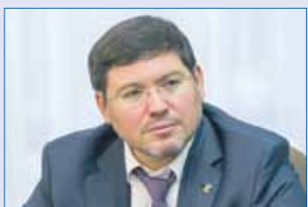
Алексей ДЕНИСЕНКО, председатель комитета Законодательного Собрания по строительной политике и ЖКХ:

На сегодняшний день приняты решения относительно 24 проектов КРТ. Речь идет о незастроенной территории площадью 4,4 гектара, расположенной в Калининском районе Челябинска в границах улиц Российской, Лобкова, бе-