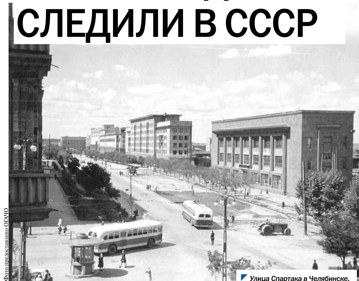
Улица Спартака в Челябинске.

Сто лет назад, 23 октября 1923 года, начат отсчет истории контрольно-ревизионных органов, когда в составе Наркомата финансов СССР выделили финансово-контрольное управление. Его местные отделения образовали региональную систему государственного финансового контроля. Она обеспечивала социалистическую законность в сферах расходования бюджетных средств, налогообложения, правильной выплаты трудящимся зарплат и пенсий, финансовую дисциплину государственных и кооперативных предприятий, а также учреждений социальной сферы.