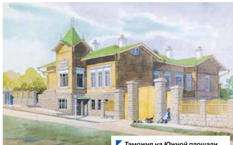
Таможня на Южной площади. Начало XX века.