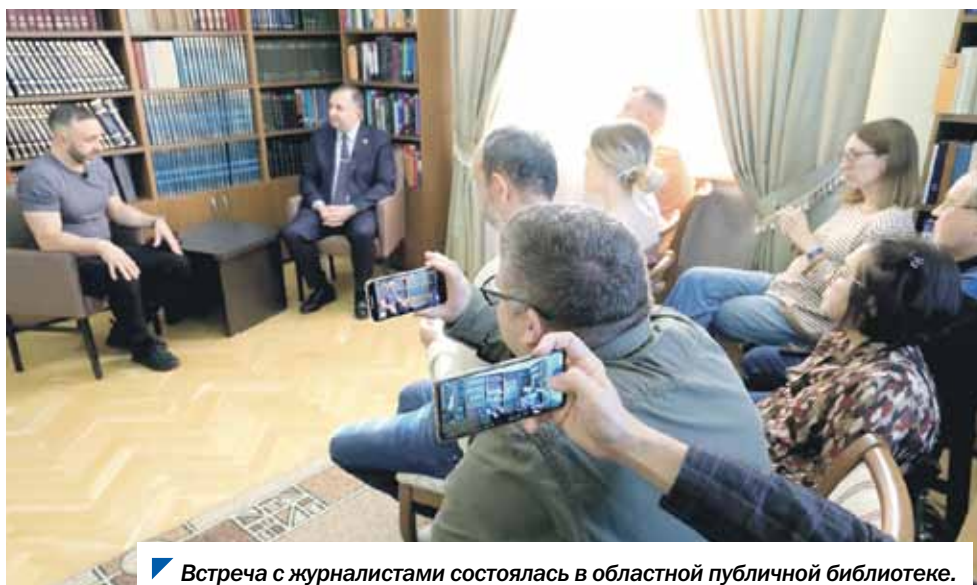
Встреча с журналистами состоялась в областной публичной библиотеке.

— Необходимо, чтобы каждый депутат выступал в роли эксперта в своей сфере. Не секрет, что юридический язык специфичен и простым жителям достаточно тяжело понять, что собственно в том или ином законе прописано. Функция депутата как раз в том, чтобы объяснить понятно для каждой категории населения, кого и каким об-