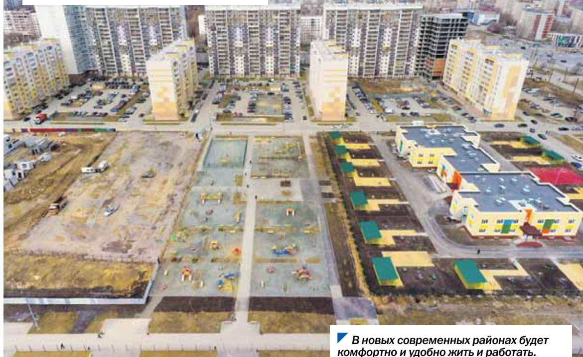
В новых современных районах будет комфортно и удобно жить и работать.

Сегодня в областном центре и в ряде других муниципалитетов региона активно идет процесс реорганизации бывших промышленных и иных неэффективно используемых территорий. Это стало возможно благодаря проекту комплексного развития территорий. О том, как реализуется проект в 2023 году, — подробно в нашем материале.