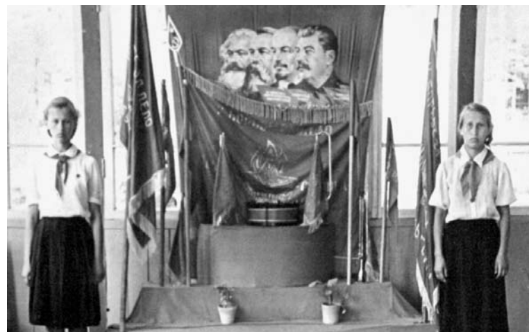
▲ Дежурство у знамени.

К сожалению, в фондах ОГАЧО не осталось никаких документов, которые бы рассказывали о детских лагерях дореволюционного времени на территории нынешней Челябинской области.