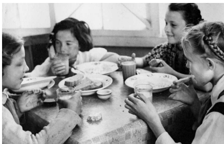
▲ В столовой. Такого изобилия дома дети никогда не видели...