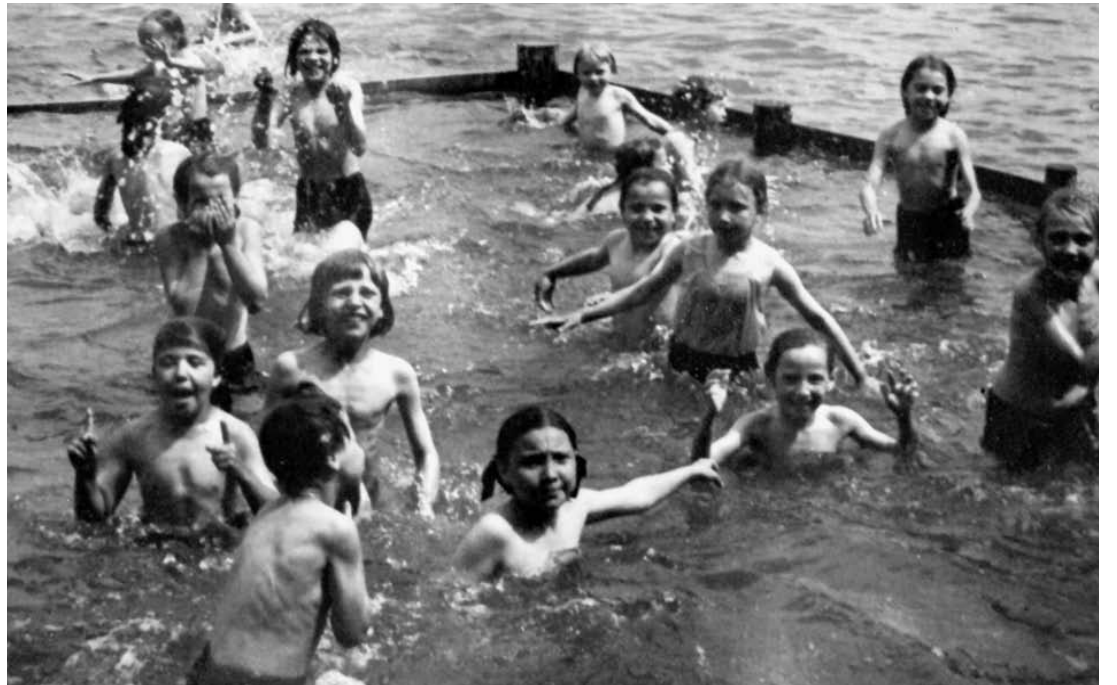
▲ На озере Еловом. Пионерлагерь им. Володи Дубинина

ние: «Среди неорганизованных детей создать в виде опыта две группы по системе «юных пионеров», приступить к работе крайне осторожно и осмотрительно». В феврале в столице Южного Урала появилась первая пионерская ячейка, а летом 1923-го уже и первый лагерь. Воспитанники новой системы помогали советскому строительству, вели борьбу с неграмотностью, а в теплый сезон, как и положено, отдыхали. Традиция детского отдыха на свежем воздухе была продолжена: городские пионеры выезжали в лагерь, организованный на лето, уже сложившимся