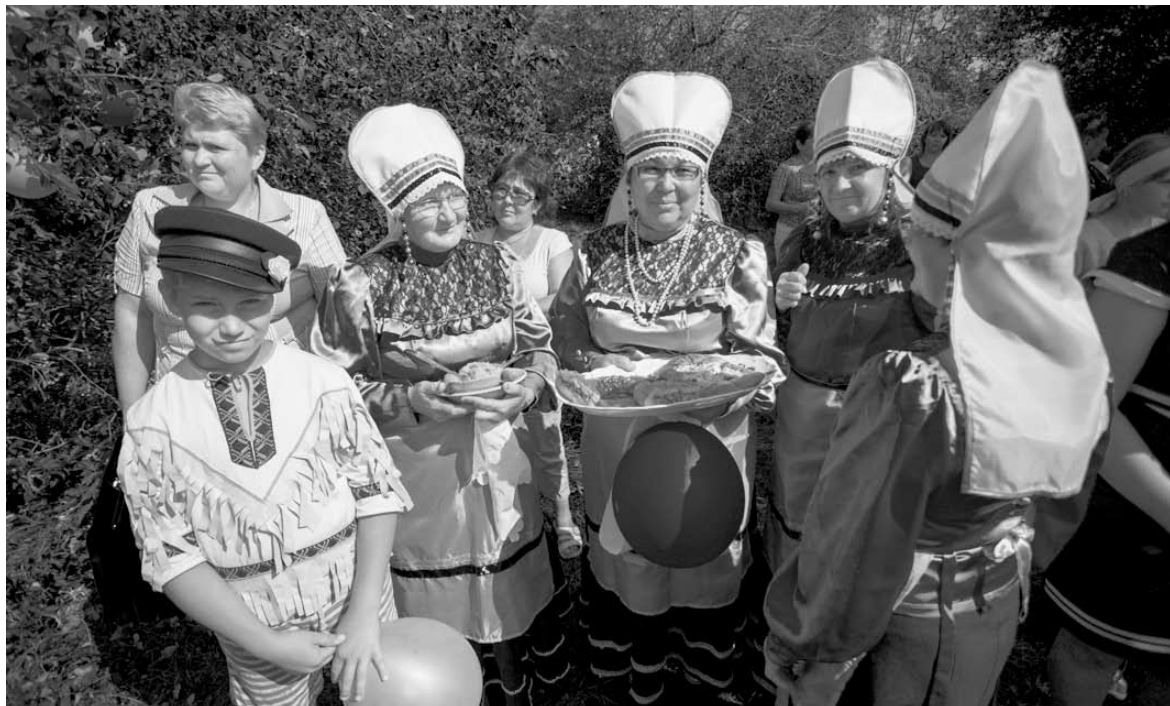
На земле Спасского сельского поселения дружно живут 35 национальностей. Мордовский фольклорный ансамбль

– На таких сельских праздниках царит особая, почти домашняя атмосфера, – заметил председатель областного парламента Владимир Мякуш, по-