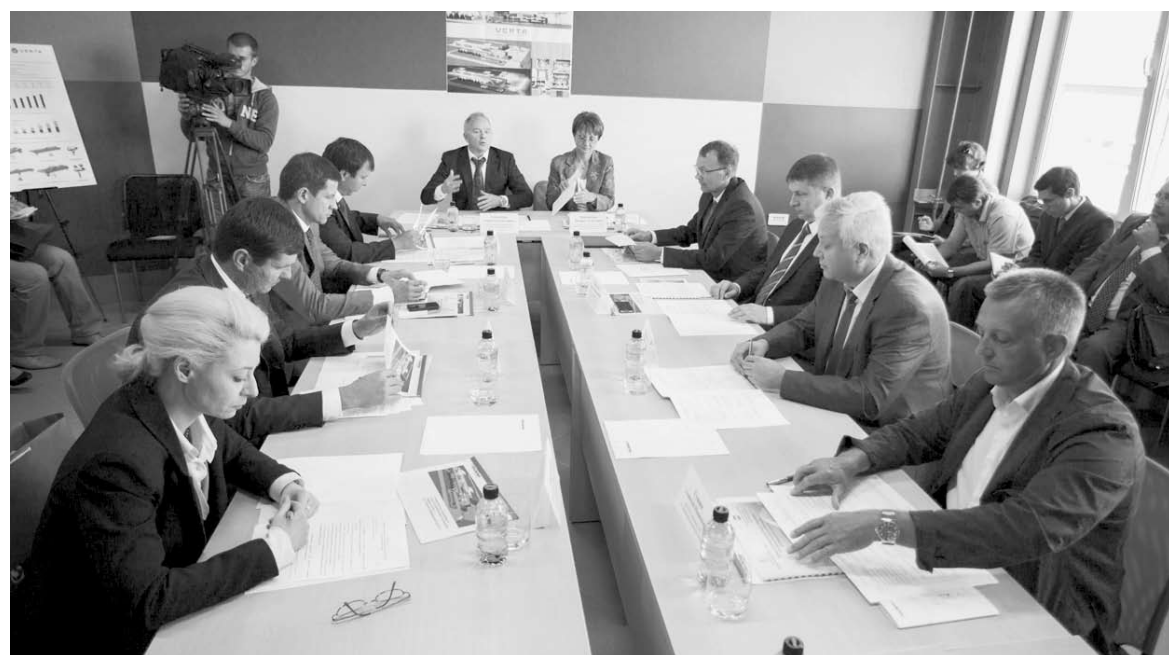
Познакомившись с производством, депутаты провели заседание комитета, на котором рассмотрели вопросы развития машиностроительной отрасли региона