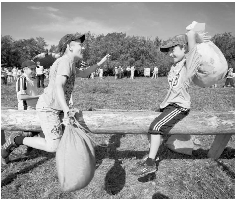
В этот день на берегу реки Урал звучали песни и музыка, а самые азартные могли посоревноваться в ловкости