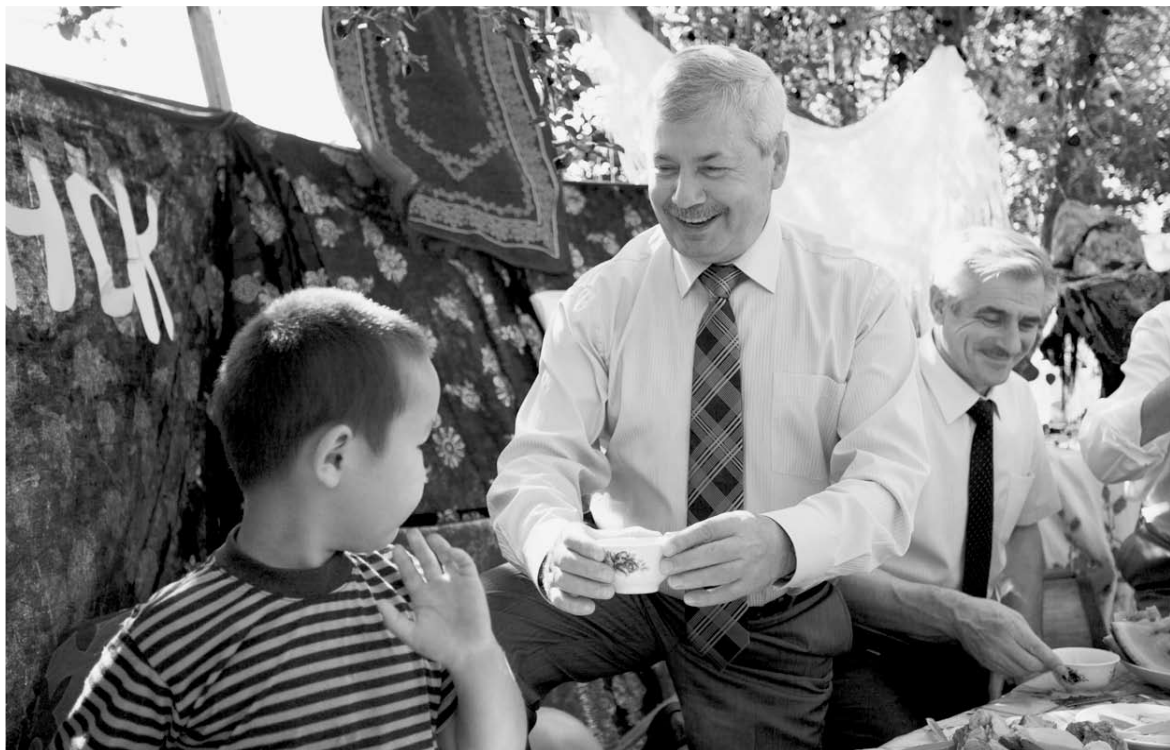
В казахском шатре спикера областного парламента угощали чаем из настоящего самовара

рые здесь живут и трудятся. Эти люди настоящие труженики, они ценят не слова, а дела и поступки. Именно на таких держится спасская земля.