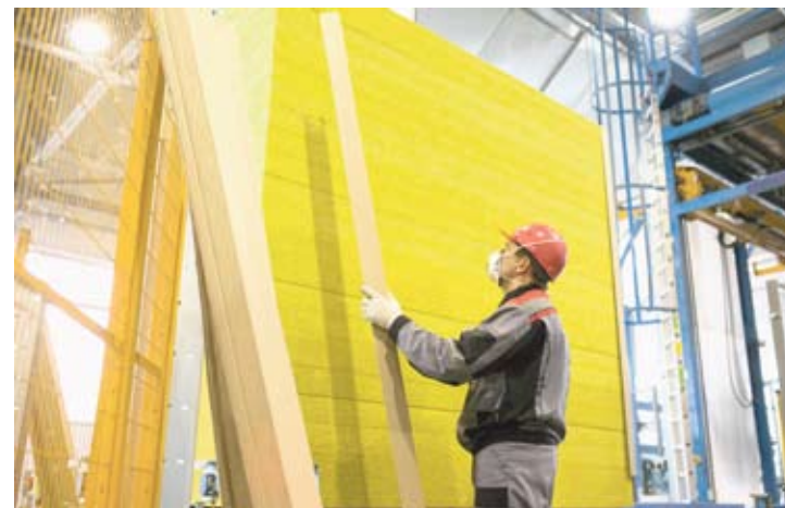
За два года работы «Техно» объем инвестиций составил 1,7 миллиарда рублей. Дополнительно было создано 92 рабочих места.

переоснащение одной из выпускаемых линий. Общий объем инвестиций предполагается на уровне 200 миллионов рублей.