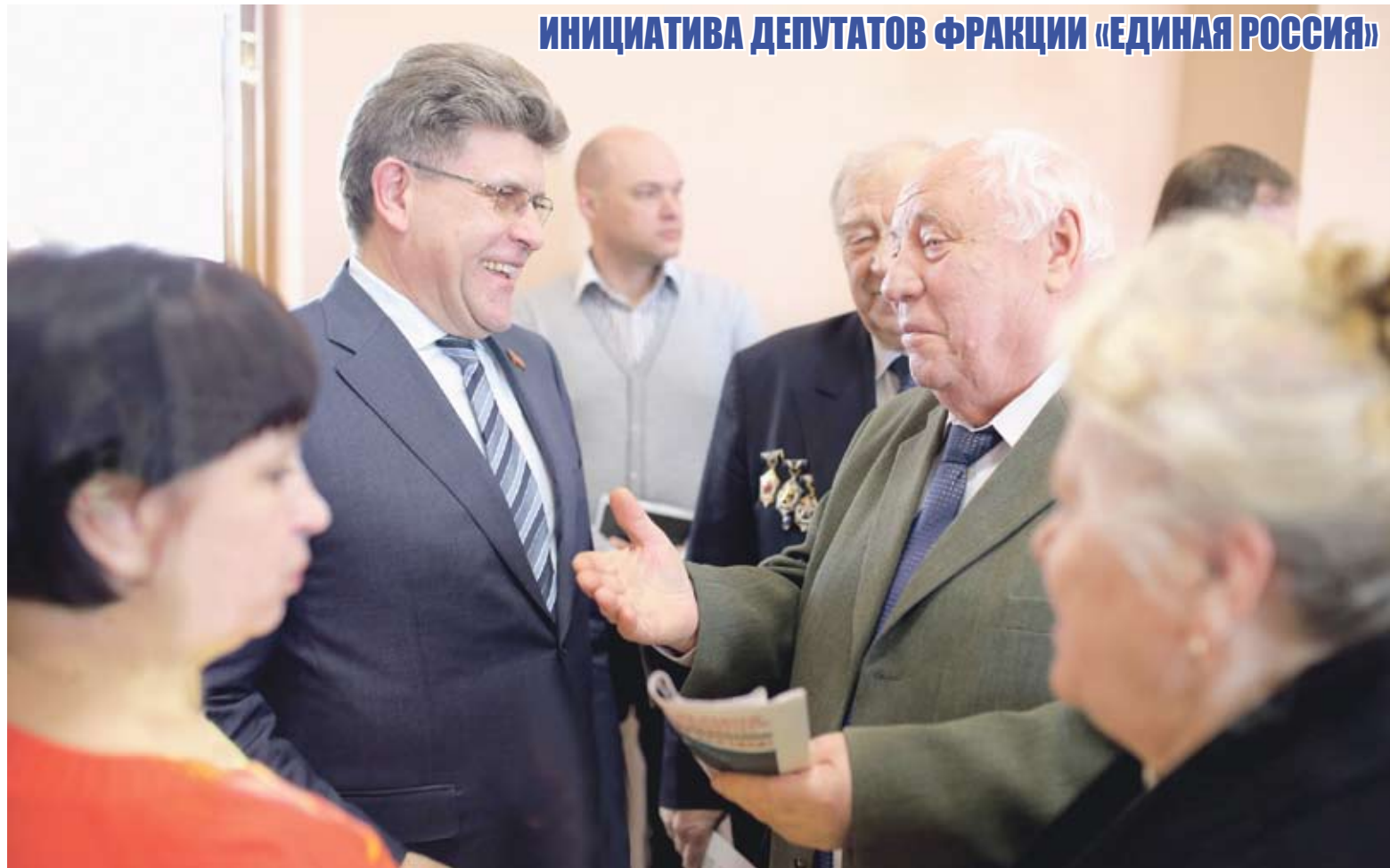
ИНИЦИАТИВА ДЕПУТАТОВ ФРАКЦИИ «ЕДИНАЯ РОССИЯ»

ДЕПУТАТЫ ФРАКЦИИ «ЕДИНАЯ РОССИЯ» В ЗАКОНОДАТЕЛЬНОМ СОБРАНИИ ЧЕЛЯБИНСКОЙ ОБЛАСТИ ДАВНО И ПЛОДОТВОРНО СОТРУДНИЧАЮТ С ВЕТЕРАНСКИМИ ОРГАНИЗАЦИЯМИ, ПОМОГАЮТ ИМ. ДВИЖЕНИЕ «ПАМЯТЬ СЕРДЦА», КОТОРОЕ ОБЪЕДИНИЛО В СВОИХ РЯДАХ ЮЖНОУРАЛЬЦЕВ, ЧЬЕ ДЕТСТВО И ЮНОСТЬ ПРИШЛИСЬ НА ГОДЫ ВЕЛИКОЙ ОТЕЧЕСТВЕННОЙ ВОЙНЫ, — ОДНО ИЗ НИХ. В КАНУН ОДНОЙ ИЗ САМЫХ ТРАГИЧЕСКИХ ДАТ В ИСТОРИИ НАШЕЙ СТРАНЫ — ДНЯ ПАМЯТИ И СКОРБИ В ЧЕЛЯБИНСКОМ ДВОРЦЕ КУЛЬТУРЫ ЖЕЛЕЗНОДОРОЖНИКОВ СОСТОЯЛОСЬ ПАМЯТНОЕ МЕРОПРИЯТИЕ.