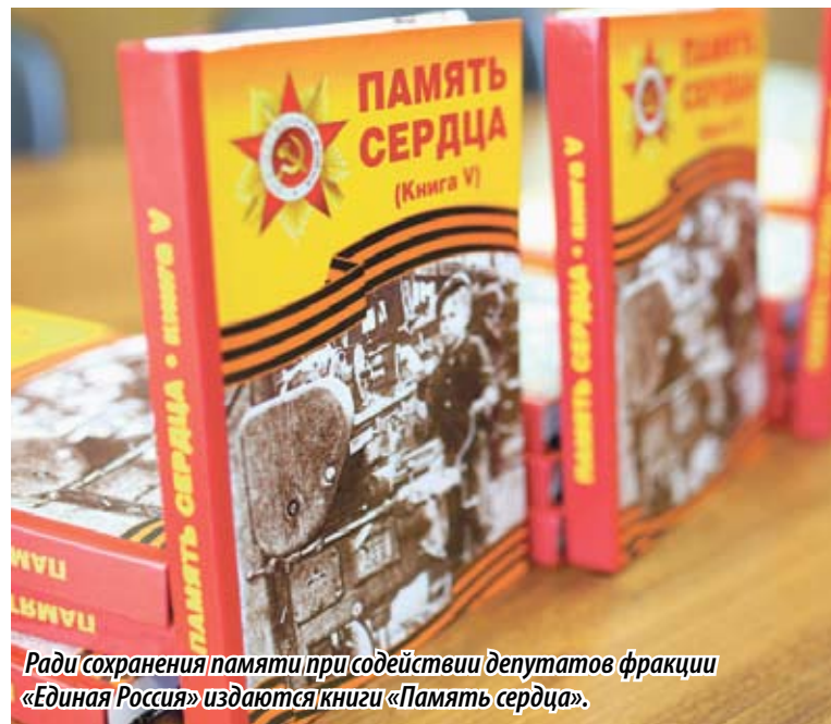
Ради сохранения памяти при содействии депутатов фракции «Единая Россия» издаются книги «Память сердца».