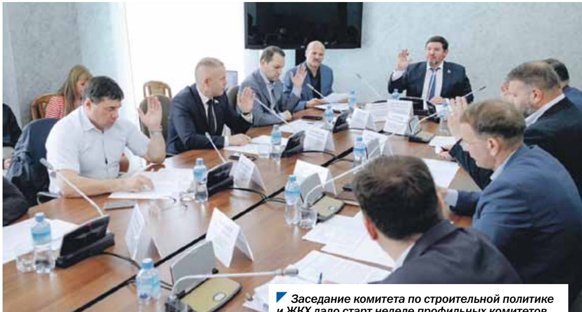
Заседание комитета по строительной политике и ЖКХ дало старт неделе профильных комитетов.

В 2022 году на Южном Урале в рамках программы «Благоустройство населенных пунктов Челябинской области» работы проводились на 125 общественных пространствах и 140 дворовых территориях. Подробные итоги выполнения программы в прошлом году и ход ее реализации в году текущем обсудили депутаты комитета Законодательного Собрания по строительной политике и ЖКХ.