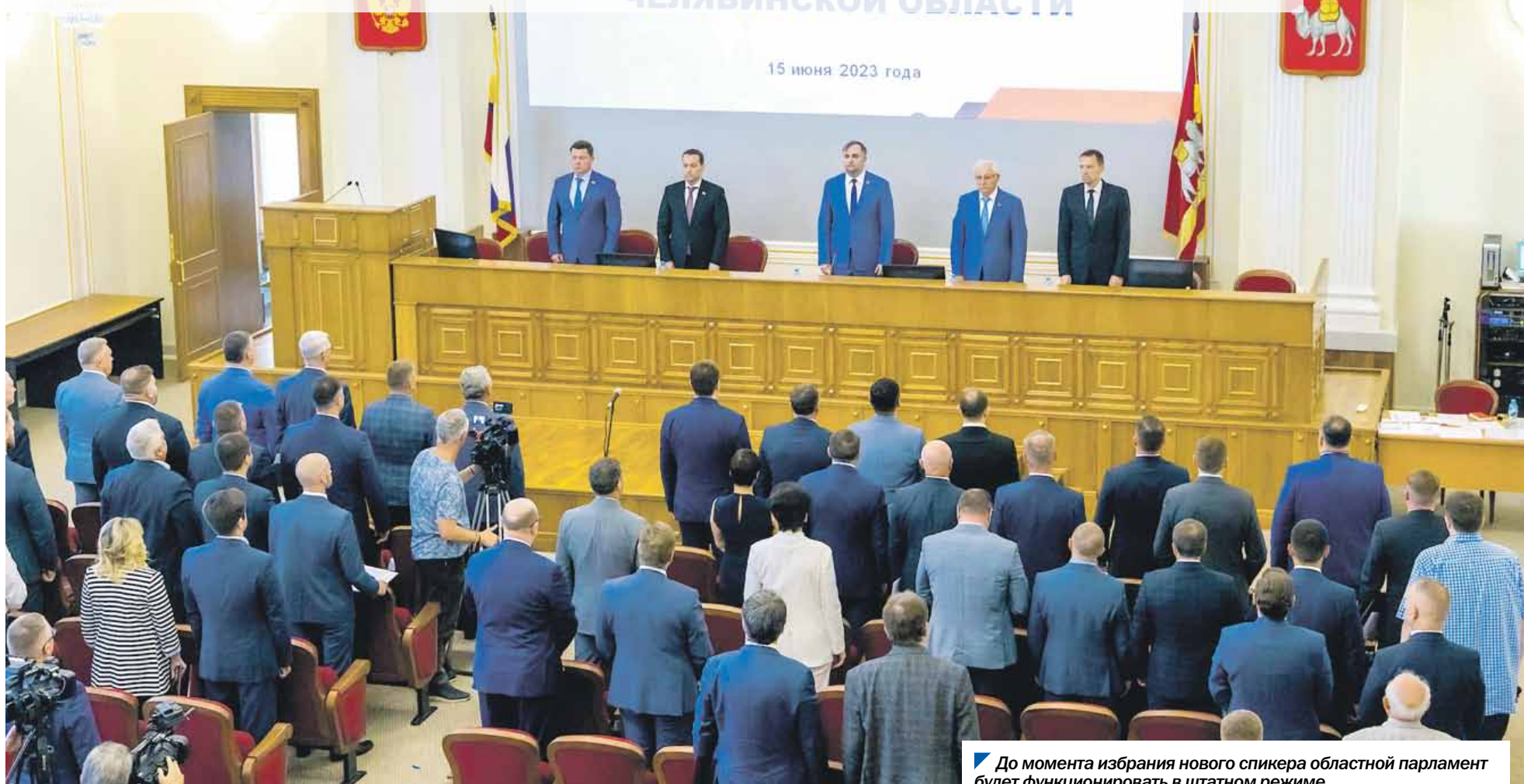
До момента избрания нового спикера областной парламент будет функционировать в штатном режиме.