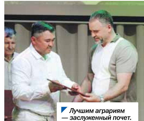
Лучшим аграриям — заслуженный почет.