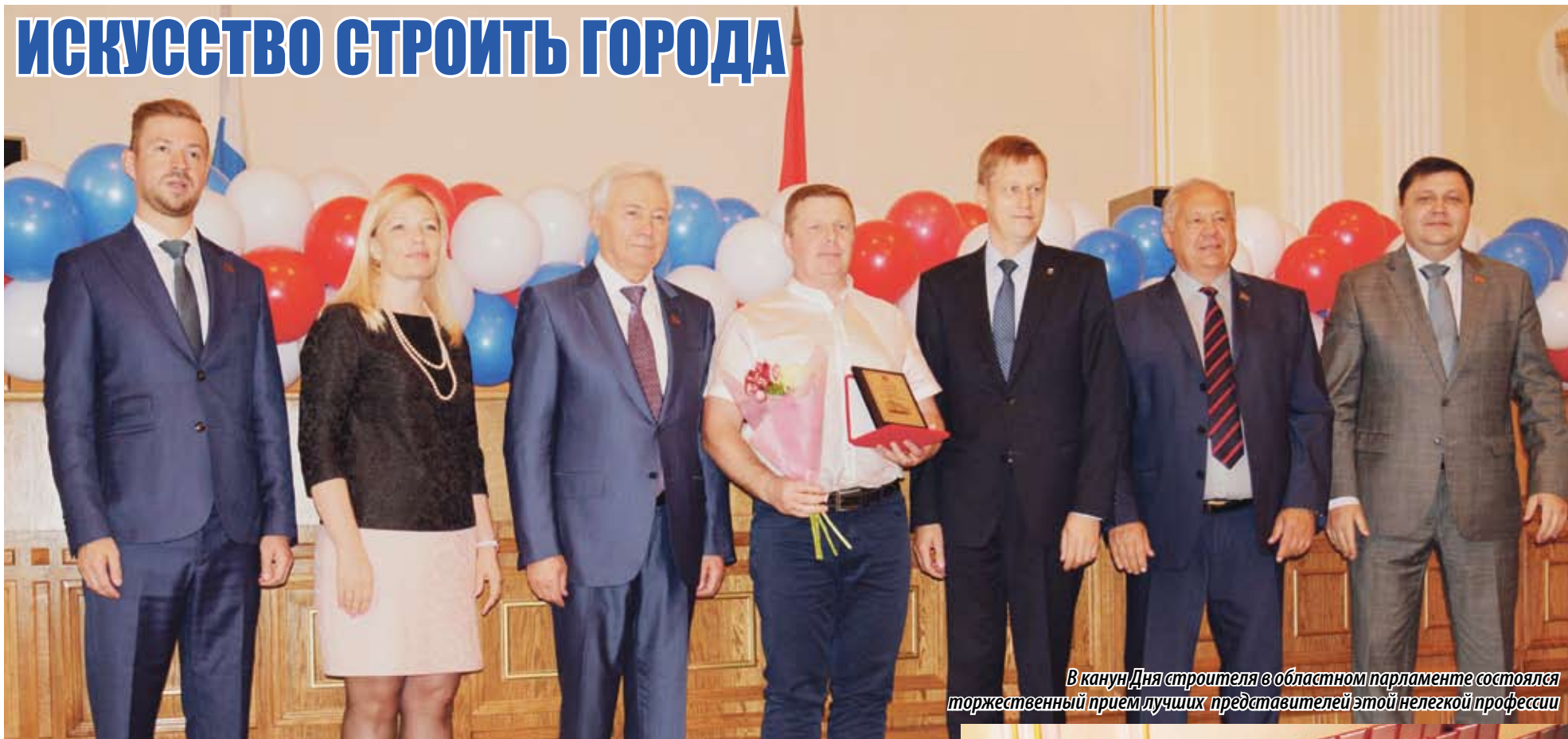
В канун Дня строителя в областном парламенте состоялся торжественный прием лучших представителей этой нелегкой профессии

ИСКУССТВО БЫВАЕТ РАЗНЫМ. ОНО УМЕЕТ ВОСХИЩАТЬ И УДИВЛЯТЬ, ПРИОБЩАТЬ К ПРЕКРАСНОМУ И ВОСПИТЫВАТЬ ЧУВСТВО ВКУСА, ВДОХНОВЛЯТЬ И ОДУХОТВОРЯТЬ. НАС ВСЕГДА ВОСХИЩАЮТ ПРОИЗВЕДЕНИЯ ИСКУССТВА ХУДОЖНИКОВ, СКУЛЬПТОРОВ, ПИСАТЕЛЕЙ... НО СУЩЕСТВУЕТ ОСОБЫЙ ВИД ИСКУССТВА, И ВЛАДЕЕТ ИМ НЕ КАЖДЫЙ. ЕГО ОСНОВНАЯ ЗАДАЧА — ДАРИТЬ ЛЮДЯМ КОМФОРТ, УЮТ, ТЕПЛО, БЕЗОПАСНОСТЬ. ИМЯ ЭТОМУ ИСКУССТВУ — СТРОИТЬ ДЛЯ ЛЮДЕЙ. И КОМУ КАК НЕ СТРОИТЕЛЯМ ЗНАТЬ ЦЕННОСТЬ СВОЕЙ РАБОТЫ. В КАНУН ДНЯ СТРОИТЕЛЯ В ОБЛАСТНОМ ПАРЛАМЕНТЕ СОСТОЯЛСЯ ТОРЖЕСТВЕННЫЙ ПРИЕМ ЛУЧШИХ ПРЕДСТАВИТЕЛЕЙ ЭТОЙ НЕЛЕГКОЙ ПРОФЕССИИ.