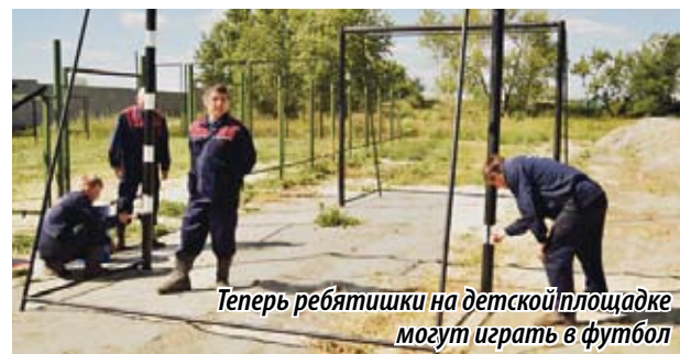
Теперь ребятишки на детской площадке могут играть в футбол