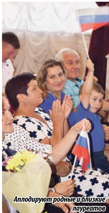
Аплодируют родные и близкие лауреатов

Завершилось торжественное мероприятие общим снимком на память и таким же общим исполнением гимна всех времен и спортсменов «Команда молодости нашей...». А нам остается только добавить: «О, спорт! Ты мир!»