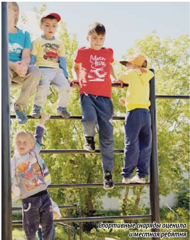
Спортивные снаряды оценила и местная ребятня