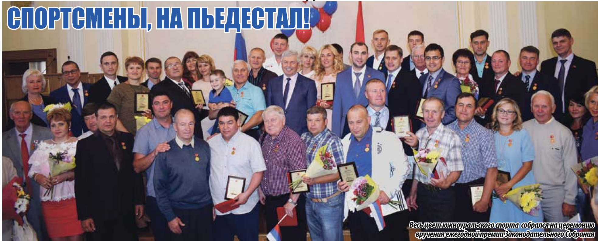
Весь цвет южноуральского спорта собрался на церемонию вручения ежегодной премии Законодательного Собрания

В СВОЕЙ РАБОТЕ (А РАБОТА ДЛЯ НИХ — САМА ЖИЗНЬ) ЭТИМ ЛЮДЯМ ДАЛЕКО НЕ ЧАСТО СЛУЧАЕТСЯ ОБЛАЧАТЬСЯ В СТРОГИЕ КОСТЮМЫ И ЭЛЕГАНТНЫЕ ПЛАТЬЯ. НО СЕГОДНЯ — ОСОБЫЙ ПОВОД. СЕГОДНЯ — ИХ ПРАЗДНИК. НАКАНУНЕ ДНЯ ФИЗКУЛЬТУРНИКА ПОД ГЕРБОМ ЧЕЛЯБИНСКОЙ ОБЛАСТИ И РОССИЙСКИМ ТРИКОЛОРОМ СОБРАЛСЯ ЦВЕТ ЮЖНОУРАЛЬСКОГО СПОРТА НА ЦЕРЕМОНИЮ ВРУЧЕНИЯ ЕЖЕГОДНОЙ ПРЕМИИ ЗАКОНОДАТЕЛЬНОГО СОБРАНИЯ.