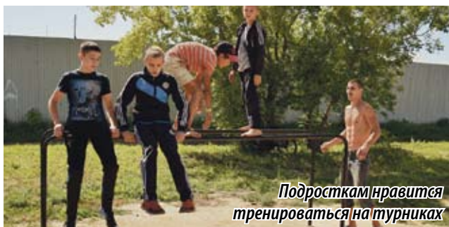
Подросткам нравится тренироваться на турниках