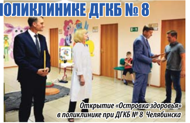
Открытие «Островка здоровья» в поликлинике при ДГКБ № 8 Челябинска

ПО ИНИЦИАТИВЕ ДЕПУТАТА ЗАКОНОДАТЕЛЬНОГО СОБРАНИЯ ЧЕЛЯБИНСКОЙ ОБЛАСТИ ВЛАДИМИРА ЧЕБЫКИНА (ФРАКЦИЯ «ЕДИНАЯ РОССИЯ») СОСТОЯЛОСЬ ОТКРЫТИЕ «ОСТРОВКА ЗДОРОВЬЯ» В ПОЛИКЛИНИКЕ ПРИ ДГКБ № 8 ЧЕЛЯБИНСКА. «ОСТРОВКИ ЗДОРОВЬЯ» – ЭТО ИГРОВЫЕ ЗОНЫ ДЛЯ ЮНЫХ ПАЦИЕНТОВ, ОЖИДАЮЩИХ ПРИЕМА ВРАЧА. ТЕПЕРЬ МАЛЫШИ СМОГУТ ЗАБЫТЬ О НЕПРИЯТНЫХ ПРОЦЕДУРАХ И ОТВЛЕЧЬСЯ, ИГРАЯ В РАЗВИВАЮЩИЕ ИГРЫ.