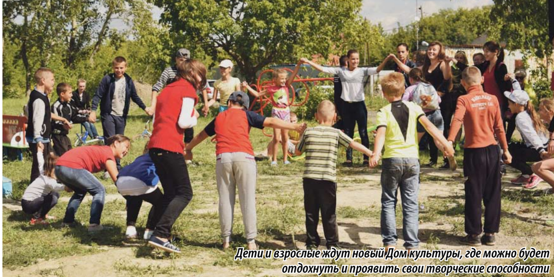
Дети и взрослые ждут новый Дом культуры, где можно будет отдохнуть и проявить свои творческие способности