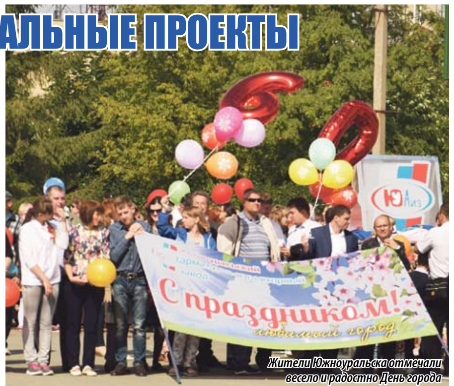
Жители Южноуральска отметили весело и радостно День города