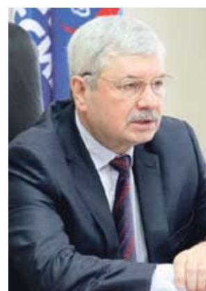
Владимир МЯКУШ, председатель Законодательного Собрания Челябинской области (фракция «Единая Россия»):

Напомним, Челябинской области из федерального бюджета на реализацию партийного проекта «Городская среда» был выделен 1 миллиард 191,3 миллиона рублей. Федеральное финансирование позволит привести в порядок 723 двора по Челябинской области, что касается столицы Южного Урала, то здесь будет благоустроено в общей сложности 165 дворов.