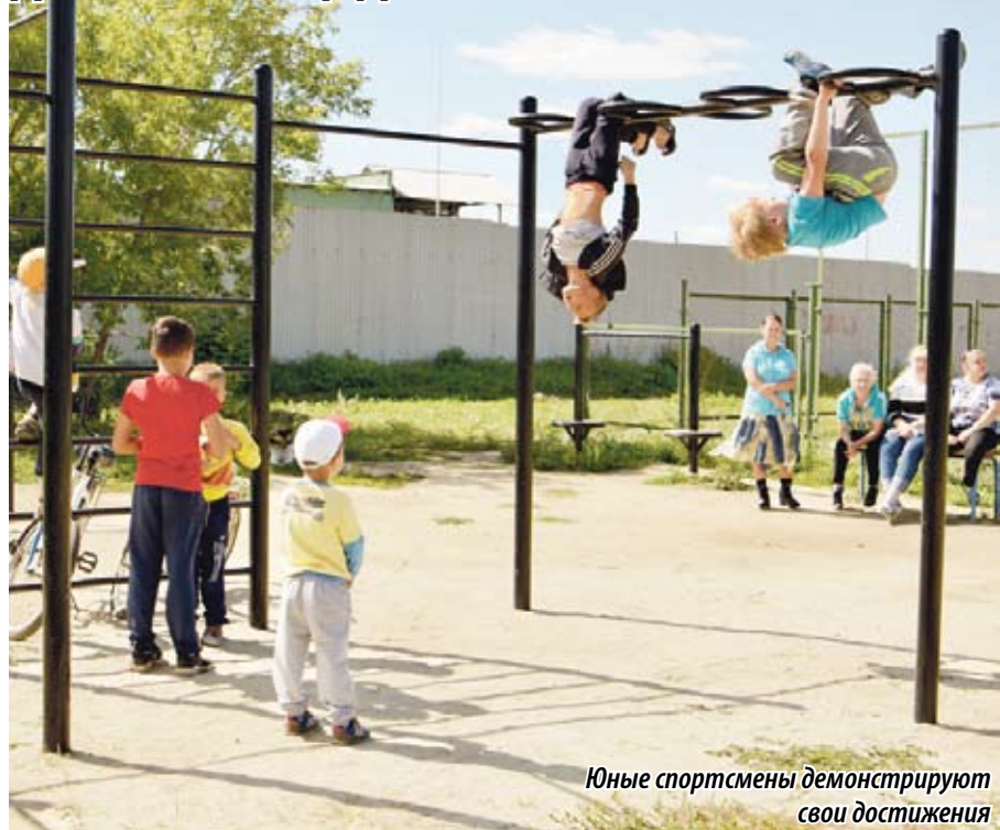
Юные спортсмены демонстрируют свои достижения

Сегодня здесь слышатся детские голоса, смех, ребята то и дело демонстрирует настоящие цирковые номера на установленных турниках и с радостью показывает свои спортивные достижения. И трудно представить, что совсем недавно на месте оборудованной детской и спортивной площадки был заросший пустырь, который местные жители