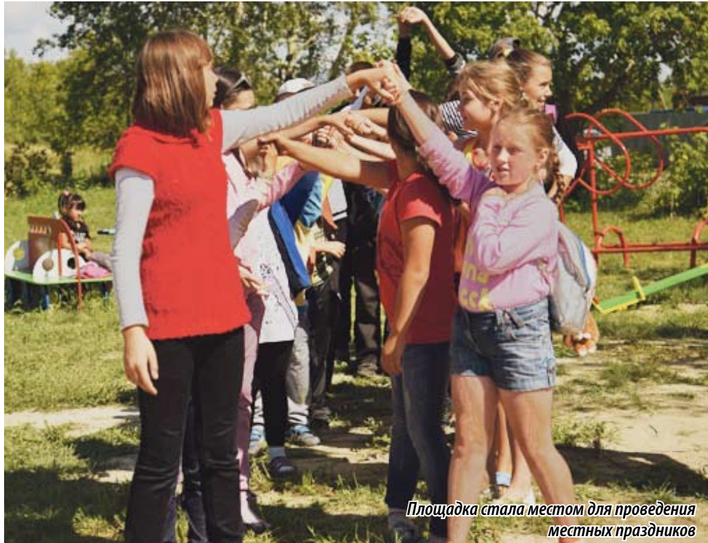
Площадка стала местом для проведения местных праздников

« В общей сложности на благоустройство площадки было выделено более 100 тысяч рублей. Мы и дальше продолжим заниматься ее оснащением. Планируем оборудовать не только зону для ребятишек, но и для молодежи, и для мам с маленькими детьми, и для старшего поколения. Каждый сможет здесь провести время с пользой: кто-то будет заниматься спортом, кто-то – просто отдыхать. Кроме того, обязательно высадим здесь цветы. Сделаем все, чтобы площадка стала по-настоящему ухоженной, красивой и понравилась всем жителям. До конца августа территория полностью будет благоустроена. »