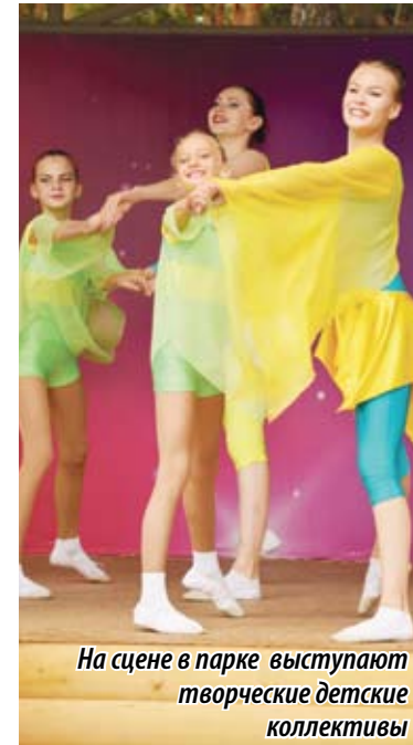
На сцене в парке выступают творческие детские коллективы

Вот она, кульминация сегодняшнего дня, итог совместной работы депутатов и жителей, результат исполнения наказов. Однако это только первые результаты. Не случайно