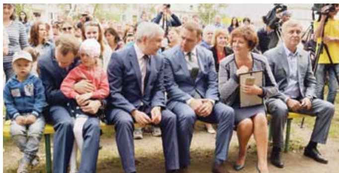
БЛАГОДАРИ ПРОГРАММЕ ПАРТИИ «ЕДИНАЯ РОССИЯ» «ГОРОДСКАЯ СРЕДА» ИЗ СРЕДСТВ ФЕДЕРАЛЬНОГО, ОБЛАСТНОГО И МУНИЦИПАЛЬНОГО БЮДЖЕТОВ В ЮЖНОУРАЛЬСКЕ В ЭТОМ ГОДУ ОТРЕМОНТИРОВАНО 24 ДВОРА И УЖЕ ПОДАНО 109 ЗАЯВОК НА СЛЕДУЮЩИЙ ГОД.

– Вместе с жителями мы еще недавно решили, что первоочередной задачей для Южноуральска является реконструкция парка. Сегодня видно, как много сделано за этот короткий период для того, чтобы парк снова стал любимым местом отдыха горожан. Но я считаю, что это только начало работы. Партийный проект «Парки малых городов» рассчитан до 2020 года, и мы должны продолжить реконструкцию парка. Стоит задача замены аттракционов, благоустройства территории, ландшафта. Уверен, что Южноуральск попадет во второй этап проекта. Кроме того, сегодня в Южноуральске идет активная работа по благоустройству, эффективно реализуется проект «Городская среда». В свою очередь призываю жителей объединить усилия, чтобы через год, когда здесь снова будут отмечать День города, мы могли приехать сюда и посмотреть, как парк и город в целом преобразились.