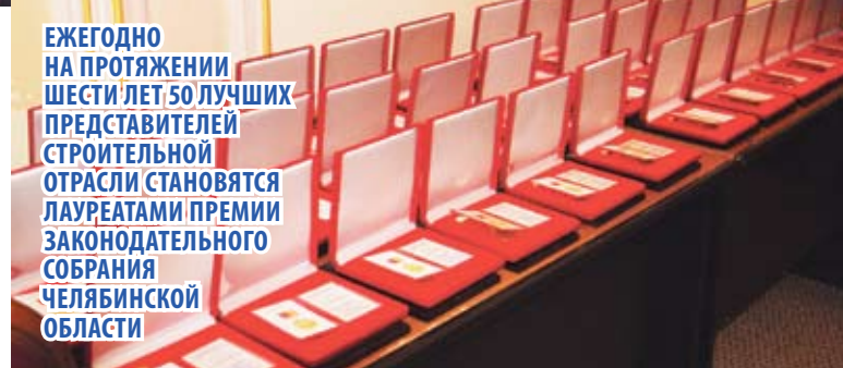
ЕЖЕГОДНО НА ПРОТЯЖЕНИИ ШЕСТИ ЛЕТ 50 ЛУЧШИХ ПРЕДСТАВИТЕЛЕЙ СТРОИТЕЛЬНОЙ ОТРАСЛИ СТАНОВЯТСЯ ЛАУРЕАТАМИ ПРЕМИИ ЗАКОНОДАТЕЛЬНОГО СОБРАНИЯ ЧЕЛЯБИНСКОЙ ОБЛАСТИ