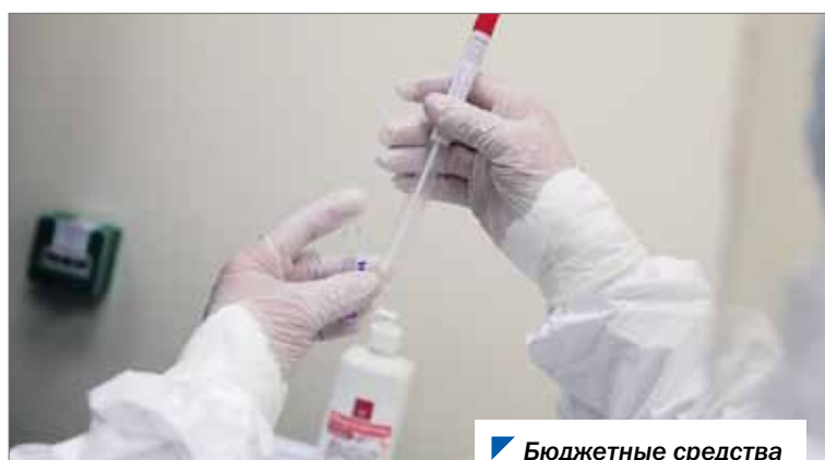
Бюджетные средства пойдут на медпомощь.

Более 50 млн рублей дополнительно направят в регионе на проведение компьютерной томографии при подозрении у пациентов коронавирусной инфекции и магнитно-резонансной томографии для выявления злокачественных новообразований.