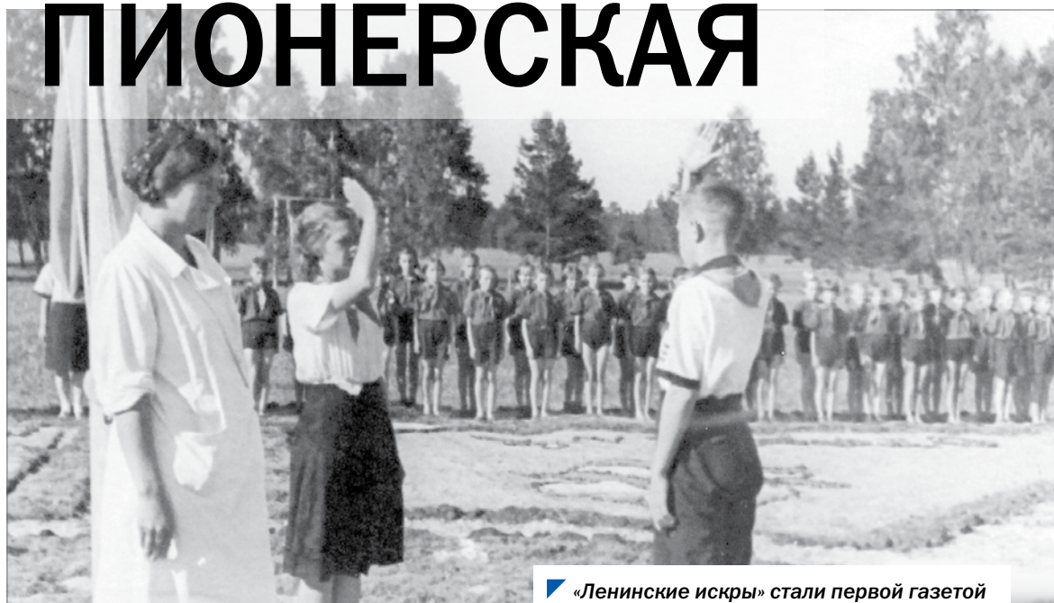
«Ленинские искры» стали первой газетой для юных южноуральцев 30-х годов.