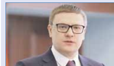
Алексей ТЕКСЛЕР, губернатор Челябинской области:

— В службы занятости обращаются и граждане, у которых нет подтвержденного дохода, достаточного стажа по прежнему месту работы. В этом случае предусмотрен минимальный размер пособия по безработице — 1 тысяча 500 рублей. Такие люди сейчас также нуждаются в поддержке государства, поэтому давайте действительно с 1 мая текущего года, то есть задним числом, увеличим минимальное пособие по безработице втрое — до 4,5 тысячи рублей. В таком объеме оно будет выплачиваться в течение трех месяцев, до 1 августа, — резюмировал Владимир Путин.