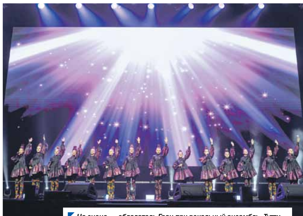
На сцене — обладатель Гран-при вокальный ансамбль «Тутти».