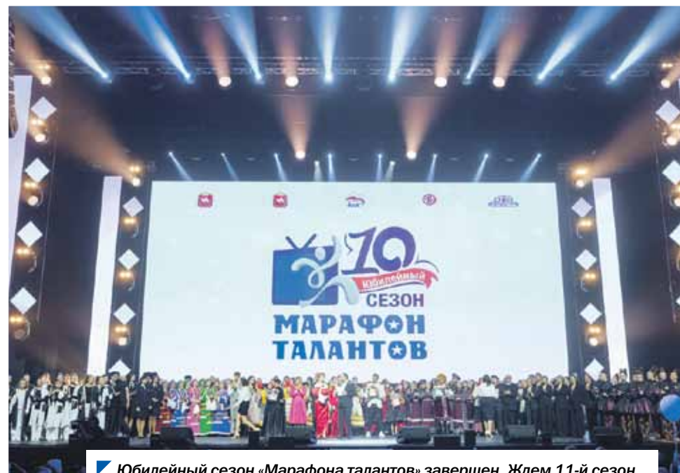
Юбилейный сезон «Марафона талантов» завершен. Ждем 11-й сезон.