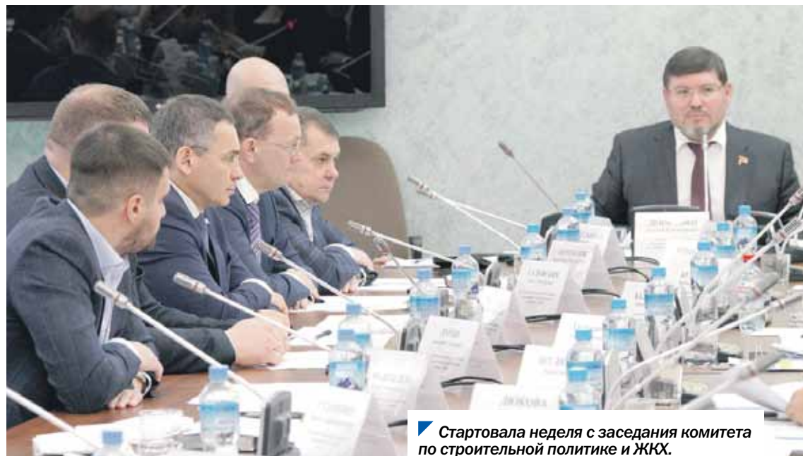
Стартовала неделя с заседания комитета по строительной политике и ЖКХ.

Законопроект о бюджете Челябинской области на 2024 год и плановый период 2025-го и 2026 годов был направлен губернатором Алексеем Текслером в южноуральский парламент 1 ноября.