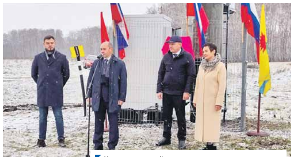
На торжественной церемонии открытия станции связи.

Напомним, базовые станции подключают к волоконно-оптическим линиям связи, что обеспечивает передачу данных на высокой скорости, а также позволяет существенно увеличить охват населенных пунктов региона цифровой инфраструктурой.