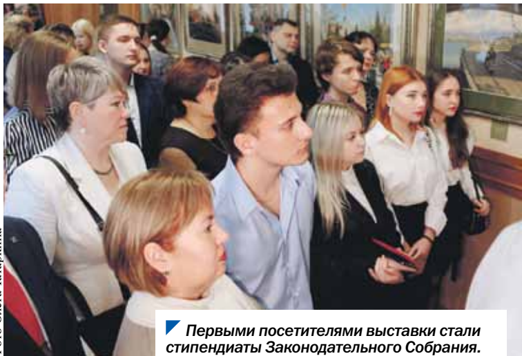
Первыми посетителями выставки стали стипендиаты Законодательного Собрания.

АЛЕКСАНДР ПАТРИТЕЕВ.