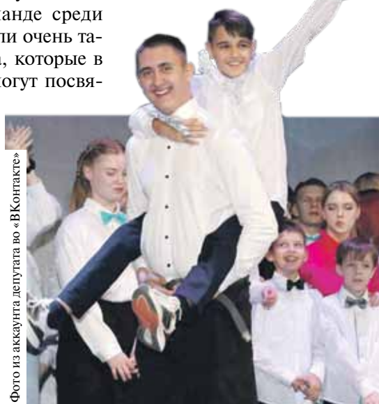
Фото из аккаунта депутата во «ВКонтакте»