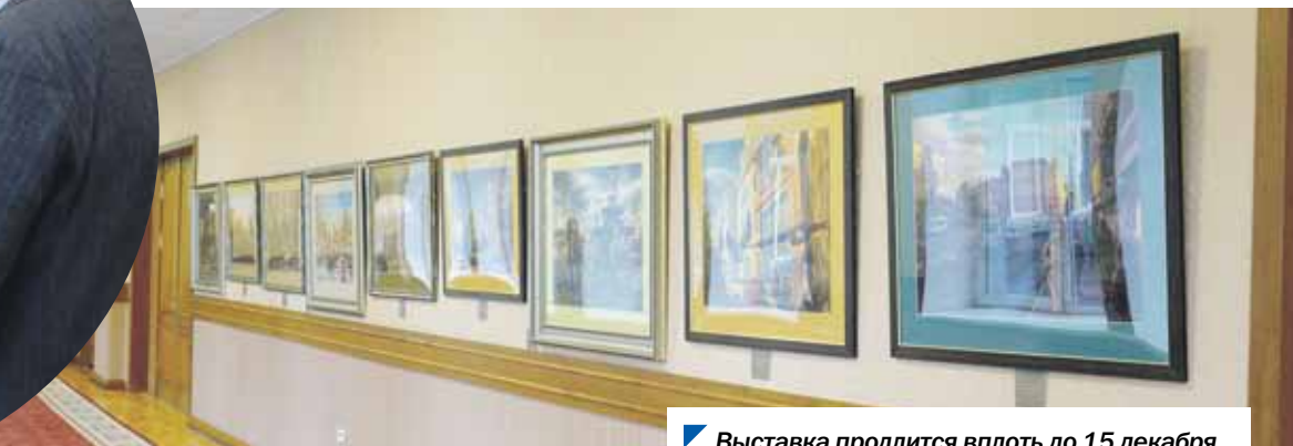
Выставка продлится вплоть до 15 декабря.