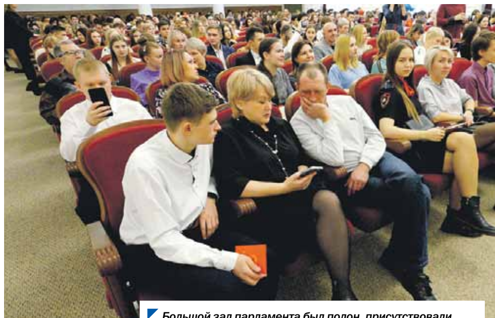
▶ Большой зал парламента был полон, присутствовали также родители, преподаватели, наставники стипендиатов.