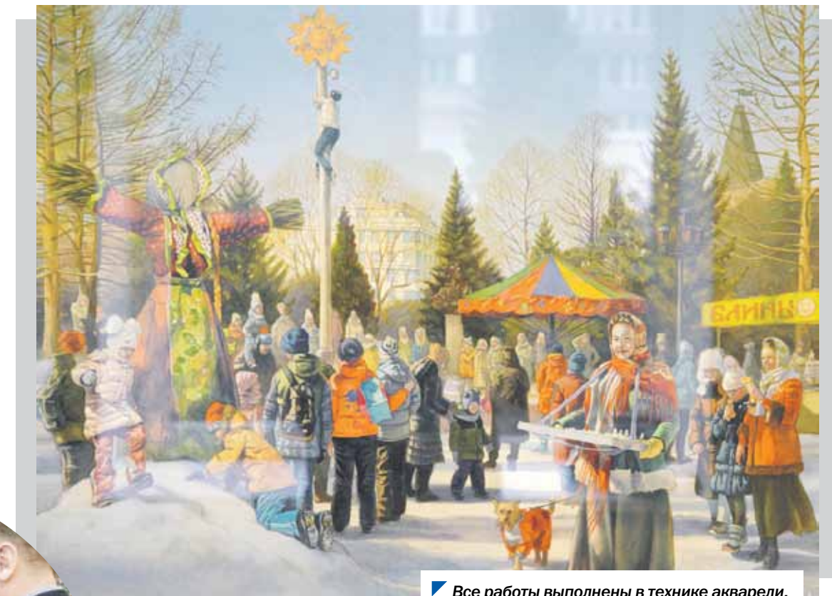
Все работы выполнены в технике акварели.