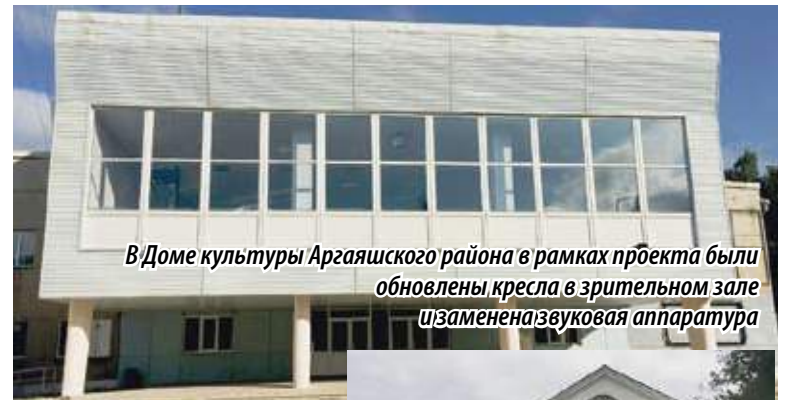
В Доме культуры Аргаяшского района в рамках проекта были обновлены кресла в зрительном зале и заменена звуковая аппаратура

– Дома культуры всегда были главной точкой притяжения в малых населенных пунктах, поэтому им необходима поддержка. Понятно, что в сельских поселениях хватает и других проблем, но это не дает нам право списывать