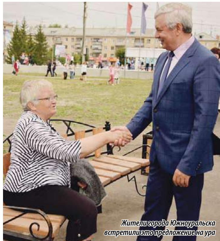
Жители города Южноуральска встретили это предложение на ура

Александр Патритеев.