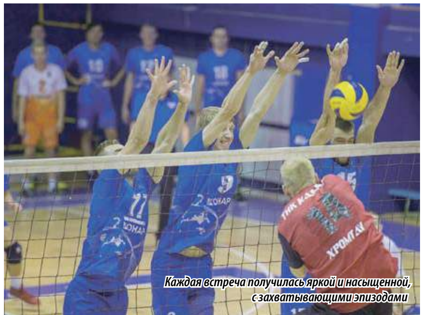
Каждая встреча получилась яркой и насыщенной, с захватывающими эпизодами

На турнире состоялось шесть матчевых встреч, каждая из которых получилась яркой и насыщенной захватывающими эпизодами. Волейбольные дружины не собирались уступать соперникам ни пяди площадки, ни одного игрового очка. Болельщики, а их собралось немало, с интересом следили за развитием спортивных баталий, поддерживая любимые команды. Главная интрига, как и полагается, разыгралась в финале, когда к заключительному туру хозяева площадки набрали шесть очков, а екатеринбуржцы – четыре и матч между ними должен был определить победителя. Встреча получилась напряженной. «Локомотиву-Изумруд» нужна была только победа, которая позволила бы набрать желанные три очка. Впрочем, и «Динамо» не собиралось отсиживаться в защите. Первая партия осталась за челябинцами – 25:21.