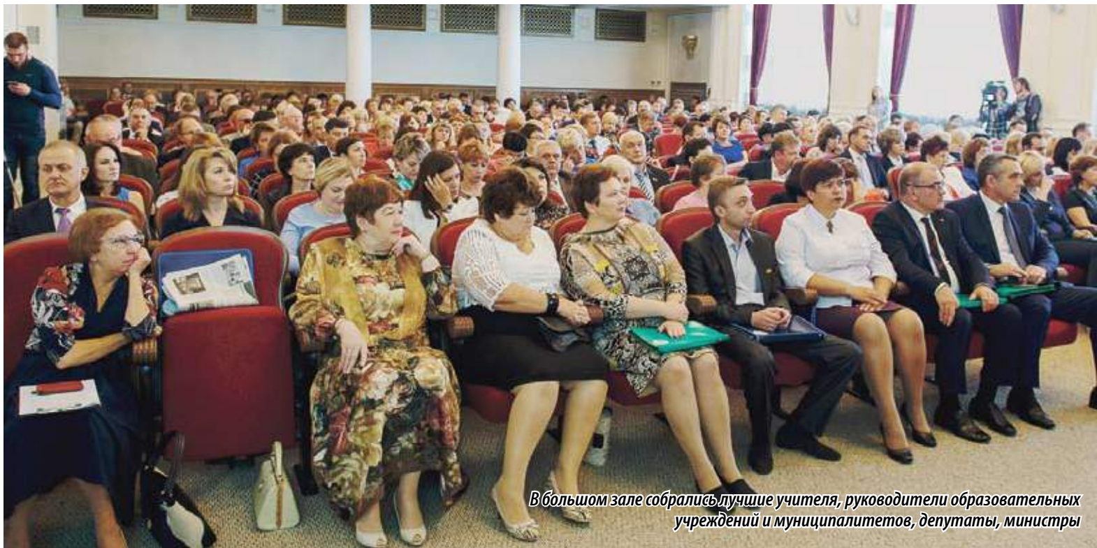
В большом зале собрались лучшие учителя, руководители образовательных учреждений и муниципалитетов, депутаты, министры

В ПЕРЕЧЕНЬ 500 ЛУЧШИХ ОБРАЗОВАТЕЛЬНЫХ УЧРЕЖДЕНИЙ РОССИИ ВОШЛИ 18 ШКОЛ ИЗ НАШЕГО РЕГИОНА. А В ТОП-25 ШКОЛ-ЛИДЕРОВ ВОШЕЛ ЛИЦЕЙ № 31 ИЗ ЧЕЛЯБИНСКА, ГДЕ ОН ЗАНЯЛ ПОЧЕТНОЕ 14-Е МЕСТО. ОБЛАСТЬ ПРОЧНО УДЕРЖИВАЕТ ПЯТОЕ МЕСТО В РЕЙТИНГЕ СРЕДИ РЕГИОНОВ РОССИИ ПО КОЛИЧЕСТВУ ДИПЛОМОВ ПОБЕДИТЕЛЕЙ И ПРИЗЕРОВ ОЛИМПИАД ШКОЛЬНИКОВ. ЭТОТ УСПЕХ СТАЛ ВОЗМОЖЕН И ПОТОМУ, ЧТО В ОБЛАСТИ СОЗДАНА ОДНА ИЗ ЛУЧШИХ СИСТЕМ ПОДГОТОВКИ УЧИТЕЛЕЙ.