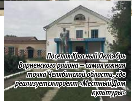
Поселок Красный Октябрь Варненского района – самая южная точка Челябинской области, где реализуется проект «Местный Дом культуры»