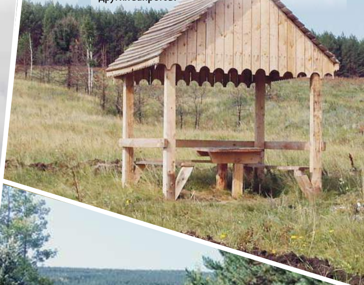
Место для любителей спокойных и неспешных прогулок на природе