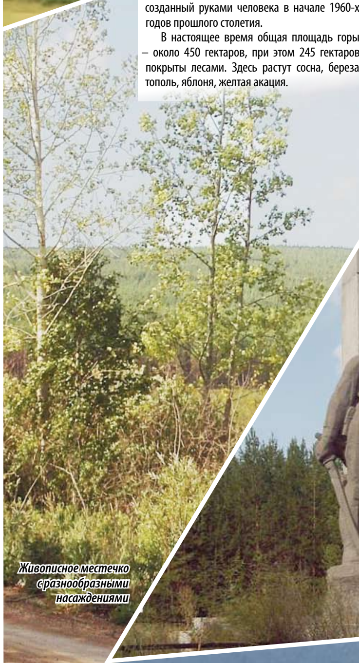
Живописное местечко с разнообразными насаждениями

Так, запрещается стоянка любых транспортных средств, проведение ремонтов, организация мойки транспорта. Кроме того, нельзя сжигать сухие листья, траву, разводить костры вне специально отведенных мест (за исключением плановых отжигов, проводимых лесной службой в целях снижения пожарной опасности). Запрещается наносить надписи на геологические объекты. Также действует много других запретов.