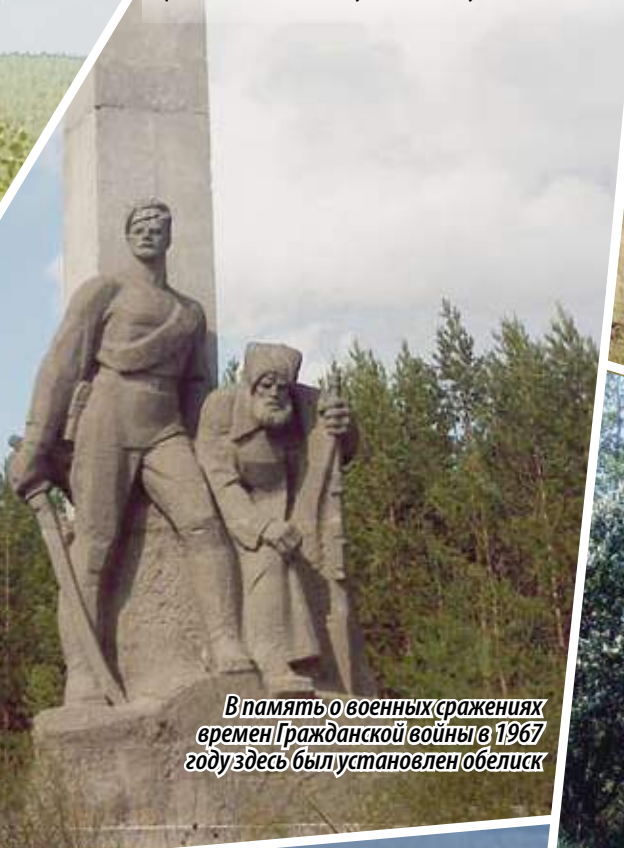
В память о военных сражениях времен Гражданской войны в 1967 году здесь был установлен обелиск