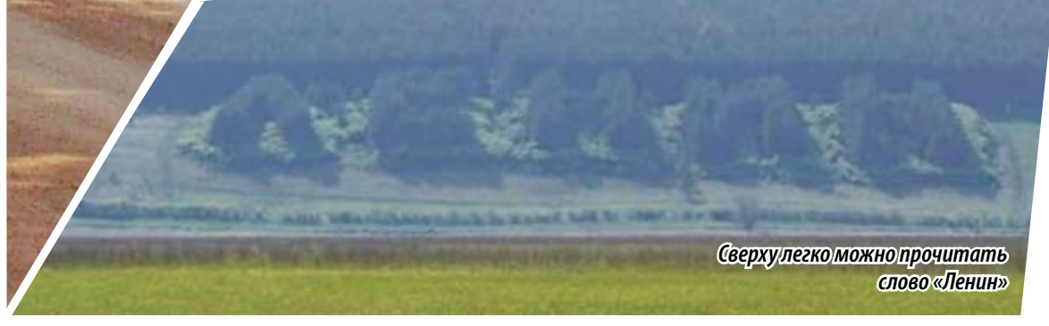
Сверху легко можно прочитать слово «Ленин»