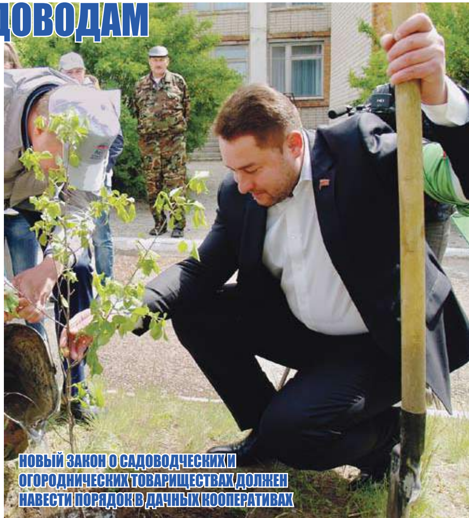
НОВЫЙ ЗАКОН О САДОВОДЧЕСКИХ И ОГОРОДНИЧЕСКИХ ТОВАРИЩЕСТВАХ ДОЛЖЕН НАВЕСТИ ПОРЯДОК В ДАЧНЫХ КООПЕРАТИВАХ

— Да, закон решил вопрос о лицензии на использование воды. Около года назад вышли нормативные документы, которые предписывали товариществу, по сути, оформлять лицензию на использование воды для полива. Это вызвало большое волнение. Также для СНТ создавались различные обязательства, например наличие в штате сотрудника по эксплуатации насосного оборудования. Затраты на содержание этой ставки, естественно, тоже ложились на собственников садов. Новый закон закрепляет