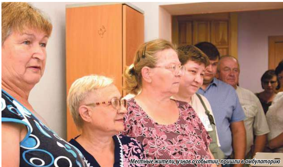
Местные жители, узнав о событии, пришли в амбулаторию