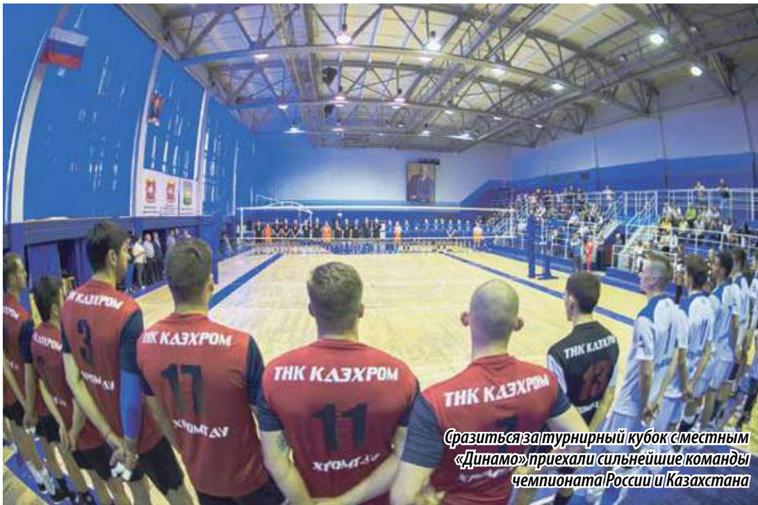
Сразиться за турнирный кубок с местным «Динамо» приехали сильнейшие команды чемпионата России и Казахстана