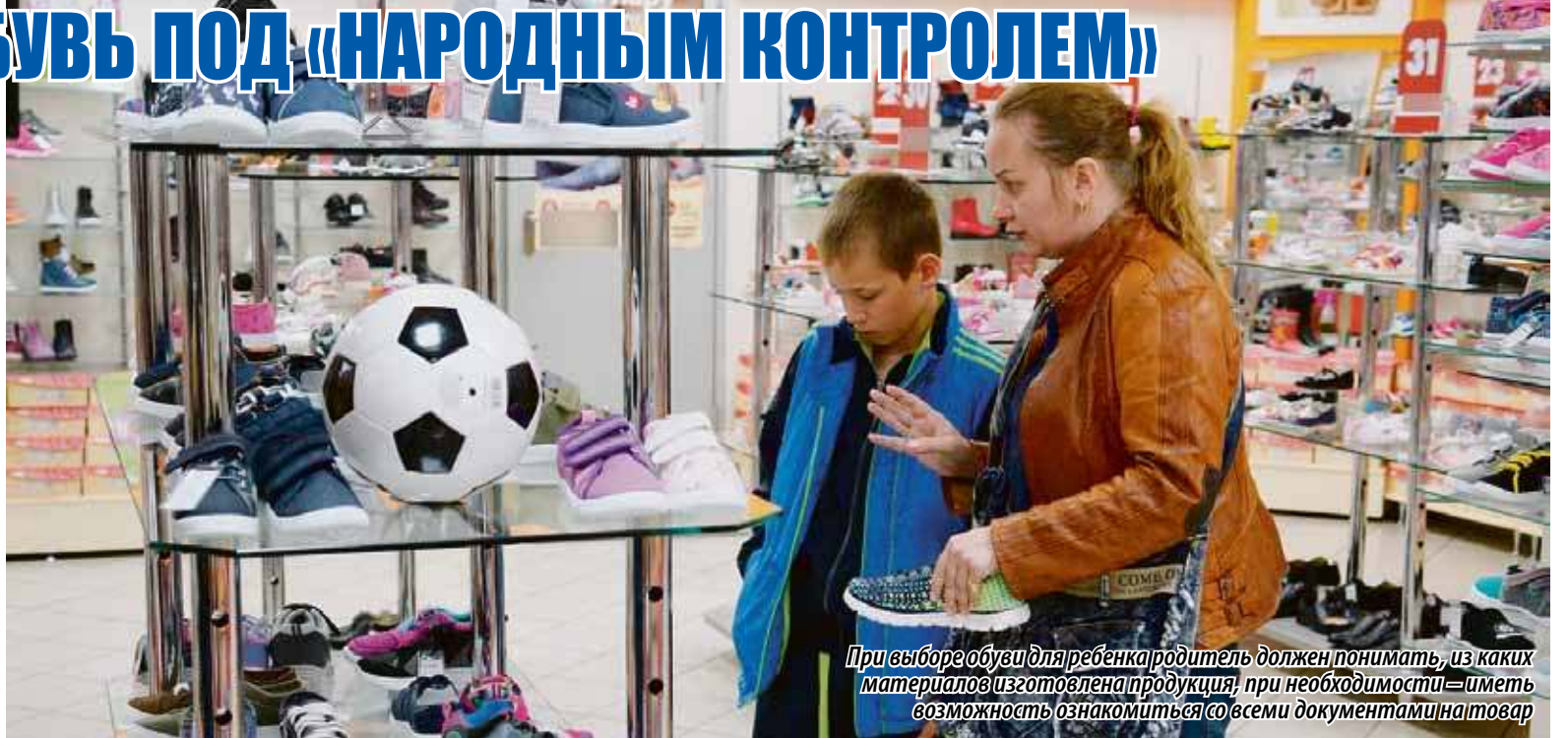
При выборе обуви для ребенка родитель должен понимать, из каких материалов изготовлена продукция, при необходимости — иметь возможность ознакомиться со всеми документами на товар

КАК ВЫ ВЫБИРАЕТЕ ОБУВЬ ДЛЯ СВОЕГО ЧАДА? СКОРЕЕ ВСЕГО ПО ПРИНЦИПУ «НРАВИТСЯ-НЕ НРАВИТСЯ», ПОДХОДИТ ПО РАЗМЕРУ ИЛИ НЕТ. НУ И, БЕЗУСЛОВНО, ВО МНОГОМ ОТ ЦЕНЫ ЗАВИСИТ ОКАЖЕТСЯ НОВАЯ ОБУВКА НА НОЖКАХ ВАШЕГО РЕБЕНКА ИЛИ ВСЕ ЖЕ ОСТАНЕТСЯ СТОЯТЬ НА МАГАЗИННОЙ ПОЛКЕ. А ВЫ В КУРСЕ, ЧТО К ДЕТСКОЙ ОБУВИ ЕСТЬ ОПРЕДЕЛЕННЫЕ ТРЕБОВАНИЯ, СТАНДАРТЫ И УСЛОВИЯ К ЕЕ СЕРТИФИКАЦИИ? УВЫ, НО ЧАЩЕ ВСЕГО ЭТО РОДИТЕЛЯМ ДАЖЕ В ГОЛОВУ НЕ ПРИХОДИТ. А МЕЖДУ ТЕМ НЕПРАВИЛЬНО ПОДОБРАННАЯ ОБУВКА МОЖЕТ СКАЗАТЬСЯ НА ЗДОРОВЬЕ ВАШЕГО ЧАДА И ОСОБЕННО МНОГО БЕД ОНА МОЖЕТ НАТВОРИТЬ ДЛЯ МАЛЫША.