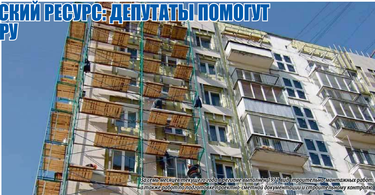
За семь месяцев текущего года в регионе выполнен 1971 вид строительно-монтажных работ, а также работ по подготовке проектно-сметной документации и строительному контролю

В своем выступлении руководитель регоператора подчеркнул положительную динамику в вопросе формирования фонда капитального ремонта на специальных счетах. За семь месяцев 2018 года 178 домов изменили способ формирова-