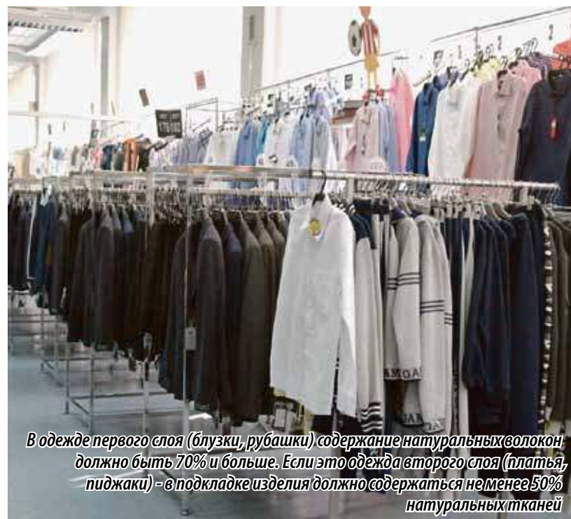
В одежде первого слоя (блузки, рубашки) содержание натуральных волокон должно быть 70% и больше. Если это одежда второго слоя (платья, пиджаки) — в подкладке изделия должно содержаться не менее 50% натуральных тканей

Добавим, что все выявленные в результате рейда замечания и нарушения будут переданы в Роспотребнадзор, чтобы специалисты ведомства имели возможность оценить качество представленных на школьных базарах моделей.