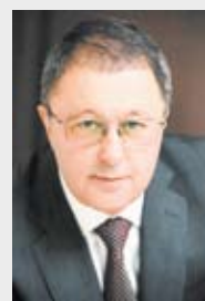
Семен Мительман, заместитель председателя Законодательного Собрания Челябинской области, председатель комитета по законодательству, государственному строительству и местному самоуправлению (фракция «Единая Россия»):

налогам и многим другим проблемам, – прокомментировал Семен Мительман. – И тем не менее процесс идет, в Законодательном Собрании создана постоянно действующая рабочая группа, осуществляющая мониторинг текущей ситуации. Госдумой внесены необходимые изменения в Бюджетный кодекс, которые позволяют сформировать районные бюджеты, и такая задача поставлена перед органами местного самоуправления. Более того, настоятельно рекомендовано при формировании бюджетов не увеличивать расходы на содержание органов местного самоуправления, эти расходы должны сохраниться на уровне 2014 года. В настоящее время активно ведется работа по назначению глав администраций. Поскольку текущий год станет переходным в формировании новой структуры органов местного самоуправления, решено не наделять районы дополнительными вопросами местного значения, а разграничить