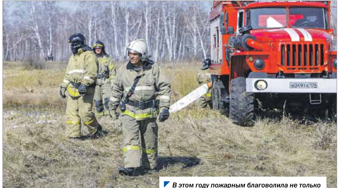
В этом году пожарным благоволила не только погода, но и дополнительные меры поддержки.

В феврале этого года областной парламент принял закон, наделивший органы местного самоуправления госполномочиями по организации тушения ландшафтных пожаров. Как реализуется закон на территории региона, обсудили депутаты комитета по экологии и природопользованию.