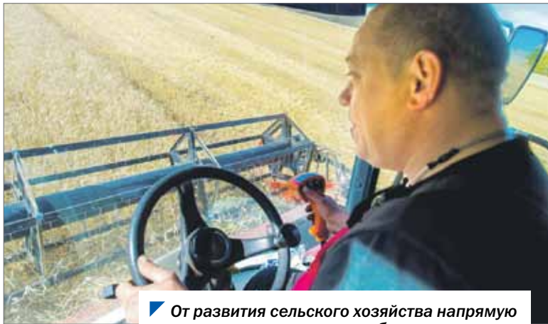
От развития сельского хозяйства напрямую зависит продовольственная безопасность.

Ведется работа и на будущее. Наша область приняла участие в отборе проектов мелиорации в Минсельхозе РФ на 2023 год.