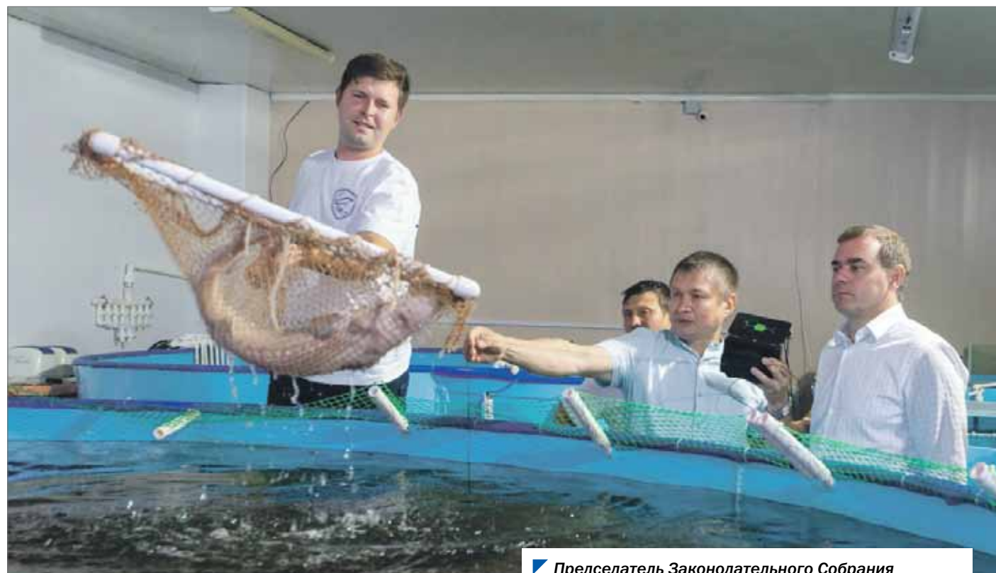
Председатель Законодательного Собрания Александр Лазарев на осетровой ферме в Кунашаке.

Как подчеркивает Александр Лазарев, на примере этого хозяйства видно, что не только крупные сельхозпроизводители, но и небольшие семейные предприятия вносят свой вклад в обеспечение продовольственной безопасности, снабжение рынка качественными продуктами.