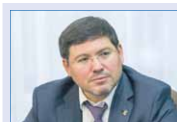
Алексей ДЕНИСЕНКО, председатель комитета Законодательного Собрания по строительной политике и ЖКХ:

Кроме того, с финансированием из различных источников было построено 569,7 км сетей газоснабжения, подключено к газу 9918 квартир и домов.