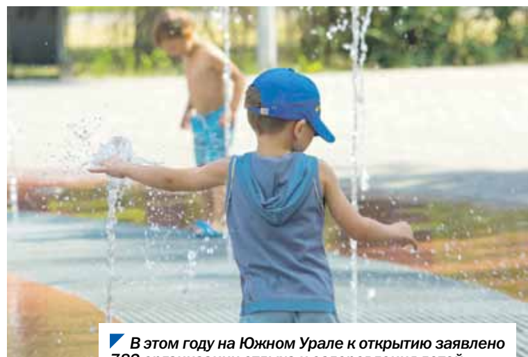
В этом году на Южном Урале к открытию заявлено 782 организации отдыха и оздоровления детей.

/// Проведение летней оздоровительной кампании находится в сфере особого внимания депутатов Законодательного Собрания. Это касается и качества питания, и противоклещевой обработки территории. Безопасность летнего отдыха детей — на постоянном контроле депутатов в своих округах.