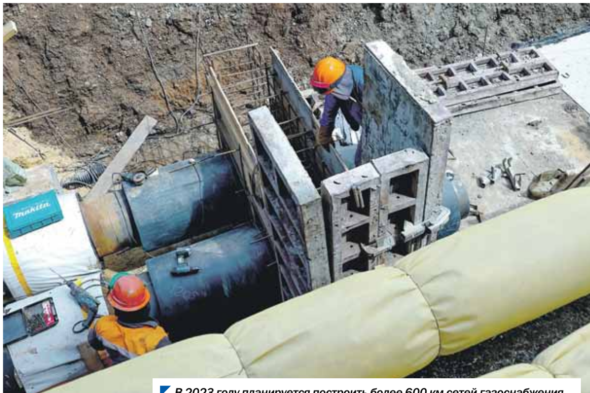
В 2023 году планируется построить более 600 км сетей газоснабжения.

Депутаты комитета Законодательного Собрания по строительной политике и ЖКХ под председательством Алексея Денисенко подвели итоги отопительного сезона 2022 — 2023 годов и обсудили ход подготовки к будущему сезону.