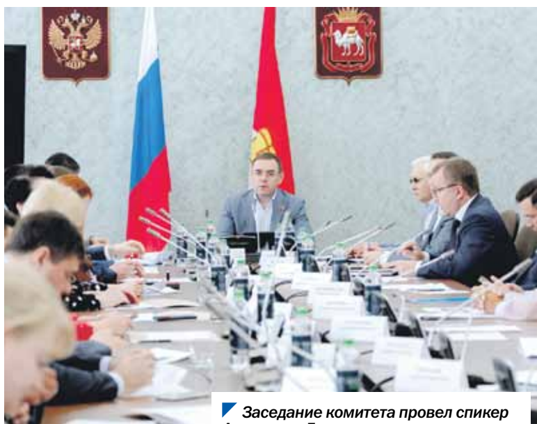
Заседание комитета провел спикер Александр Лазарев.

Депутаты комитета по бюджету и налогам под председательством спикера южноуральского парламента Александра Лазарева одобрили изменения в главный финансовый документ региона на 2023 год.