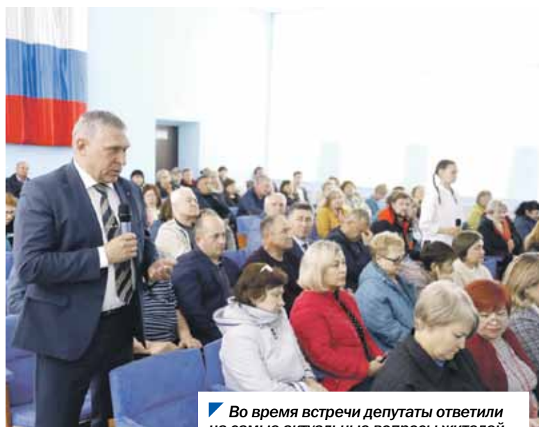
Во время встречи депутаты ответили на самые актуальные вопросы жителей.

На встрече шла речь об основных законах, принятых Законодательным Собранием, имеющих важное экономическое и социальное значение. Также обсуждались актуальные для муниципалитета темы: благоустройство, строительство культурных и спортивных объектов, реализация партийных проектов.