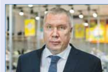
Павел ШИЛЯЕВ, заместитель председателя Законодательного Собрания, председатель комитета по промышленной политике, энергетике, транспорту и тарифному регулированию:

— Меры поддержки, которые были предоставлены нам в прошлом году, позволили сэкономленные средства направить на дальнейшие разработки. Таким образом, это стимулирует нас на более активный вывод новых продуктов на рынок, — пояснил представитель предприятия.