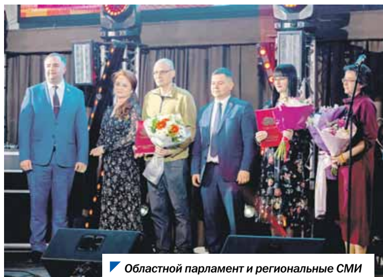
Областной парламент и региональные СМИ связывает многолетнее сотрудничество.

18–19 мая в рамках XXIV Фестиваля СМИ Челябинской области прошли многочисленные мастер-классы, круглые столы с привлечением экспертов из Москвы, Екатеринбурга, Пензы, Воронежа, Алтайского края и других регионов. В работе фестиваля участвовали депутаты Законодательного Собрания, вручив награды областного парламента.