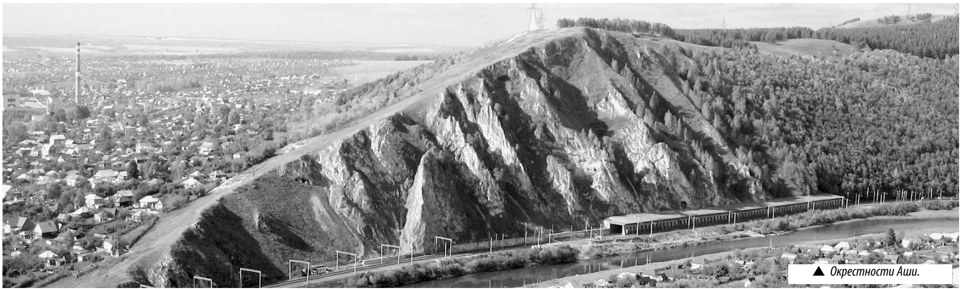
▲ Окрестности Аши.