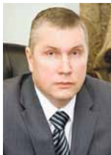
Павел ШИЛЯЕВ , председатель комитета Законодательного Собрания по промышленной политике и транспорту:

Также на заседании комитета по экономической политике и предпринимательству парламентарии отметили, что 2019 год должен стать своего рода переходным мостом между Стратегией-2020 и Стратегией-2035. То есть, речь идет о преемственности двух региональных стратегий.