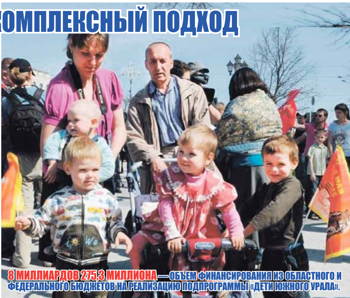
8 МИЛИАРДОВ 275,3 МИЛЛИОНА — ОБЪЕМ ФИНАНСИРОВАНИЯ ИЗ ОБЛАСТНОГО И ФЕДЕРАЛЬНОГО БЮДЖЕТОВ НА РЕАЛИЗАЦИЮ ПОДПРОГРАММЫ «ДЕТИ ЮЖНОГО УРАЛА».

Более четырех миллиардов рублей в рамках подпрограммы потрачено по направлению «Поддержка детей и семей с детьми». В данном случае 643 семьи получили выплаты в рамках регионального материнского капитала, стабильно предоставлялись выплаты областного единовременного пособия при рождении ребенка, а также ежемесячные выплаты гражданам, имеющим детей в возрасте до трех лет.