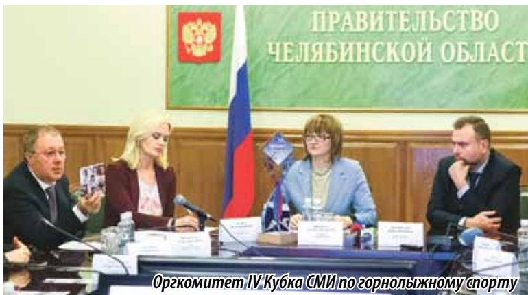
Оргкомитет IV Кубка СМИ по горнолыжному спорту