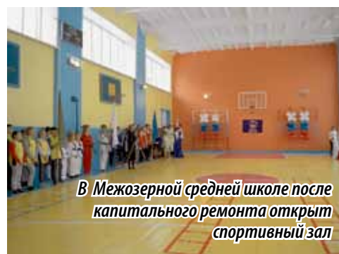
В Межозерной средней школе после капитального ремонта открыт спортивный зал

– Наказы избирателей – это одна из важных составляющих деятельности депутата Законодательного Собрания в избирательном округе, и их выпол-