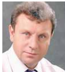
Александр БЕРЕСТОВ , председатель комитета Законодательного Собрания по аграрной политике:

К сожалению, экологические проблемы в нашем регионе накапливались не одно десятилетие. Пришло время решить их. Депутаты участвовали в рабочих группах по разработке Стратегии. Комитет дважды рассматривал ход ее подготовки и рекомендовал предусмотреть мероприятия по снижению загрязнения атмосферного воздуха в городах, развитию системы экологического мониторинга, рекультивации Челябинской свалки и других объектов накопленного экологического вреда. Все предложения и замечания комитета учтены. Уверен, что, решив стратегические задачи в сфере экологии и природопользования, наша область выйдет на кардинально новый уровень развития.