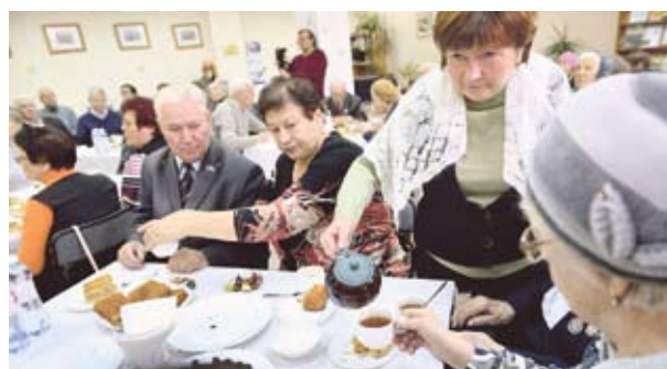
Ветераны попили чай и посмотрели музыкально-поэтический концерт

Особое впечатление произвела выставка моделей военной техники – их изготовили ребята из школ и колледжей города