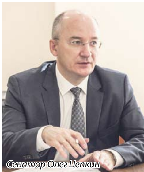
Сенатор Олег Цепкин

В СЕРЕДИНЕ ПРОШЛОЙ НЕДЕЛИ ЧЛЕН СОВЕТА ФЕДЕРАЦИИ ОЛЕГ ЦЕПКИН ПРОВЕЛ РАБОЧЕЕ СОВЕЩАНИЕ, НА КОТОРОМ ОБСУЖДАЛИСЬ ЗАКОНЫ И ПРЕДЛОЖЕНИЯ О НАЛОГОВЫХ ЛЬГОТАХ ИНВЕСТОРАМ В ЧЕЛЯБИНСКОЙ ОБЛАСТИ. НЕОБХОДИМОСТЬЮ ПРОВЕДЕНИЯ СОВЕЩАНИЯ ПОСЛУЖИЛО НЕДАВНЕЕ ПОРУЧЕНИЕ ГЛАВЫ РЕГИОНА БОРИСА ДУБРОВСКОГО ВНЕСТИ ИЗМЕНЕНИЯ В ДЕЙСТВУЮЩИЕ ОБЛАСТНЫЕ ЗАКОНЫ О ПРЕДОСТАВЛЕНИИ ЛЬГОТ ДЛЯ ИНВЕСТОРОВ, КОТОРЫЕ ПОЗВОЛИЛИ БЫ СДЕЛАТЬ ВЕСЬ ЗАКОНОДАТЕЛЬНЫЙ МЕХАНИЗМ ПРОЗРАЧНЫМ И ПРОСТЫМ В ПРИМЕНЕНИИ.