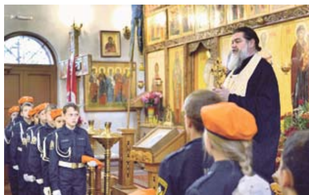
В храме святителя Василия Великого прошел благодарственный молебен и митинг