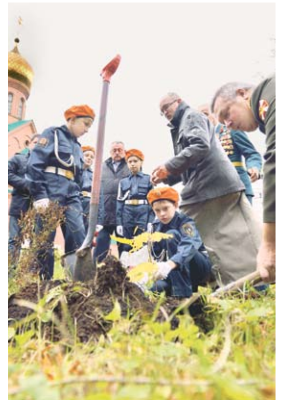
Напротив храма располагалась проходная танкового завода. В память об этом в сквере на территории храма посажена аллея памяти героев Танкограда. 6 октября к ней добавилось еще одно деревце: кадеты и ветераны вместе посадили маленький клен

Надежда МЕДВЕДКИНА.