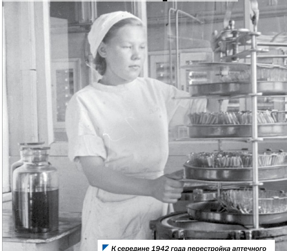
▶ К середине 1942 года перестройка аптечного хозяйства на военный лад уже была завершена.