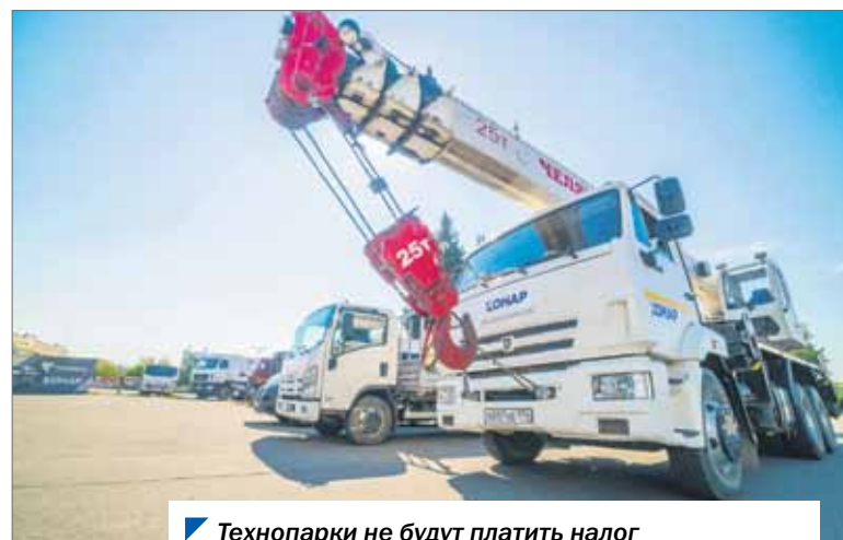
Технопарки не будут платить налог на грузовые автомобили и иные виды транспорта.

— Как территория со льготным налоговым и таможенным режимом, особая экономическая зона является одним из инструментов повышения эффективности уровня региональной экономики. Ее наличие позволяет региону создавать новые рабочие места, развивать экспортную базу, обеспечивать импортозамещение, — пояснил парламентарий.