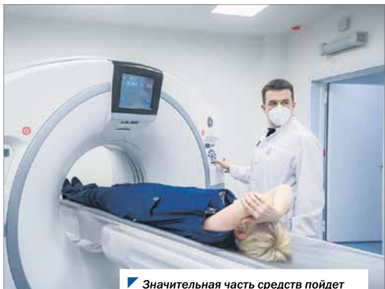
Значительная часть средств пойдет на модернизацию медучреждений.

Поправки в региональный бюджет в связи с поступлением 2 млрд 954,4 млн рублей из федеральной казны приняты на сентябрьском заседании Законодательного Собрания.