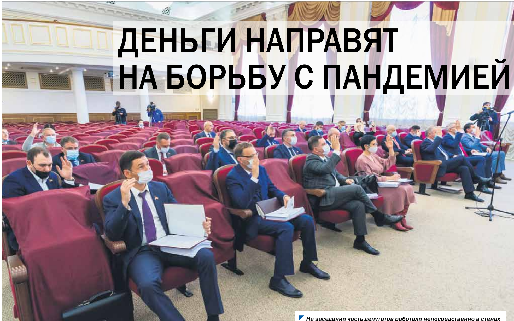
На заседании часть депутатов работали непосредственно в стенах парламента, остальные находились на прямой связи в своих округах.

В минувший четверг состоялось четырнадцатое заседание Законодательного Собрания. Центральным вопросом повестки стали изменения в областном бюджете в связи с поступлением около трех миллиардов рублей из федеральной казны. Большую долю федерального трансферта в регионе решено направить на оказание медицинской помощи южноуральцам, в том числе с заболеванием коронавирусом, а также на поддержку медиков, стоящих на переднем крае борьбы с пандемией.