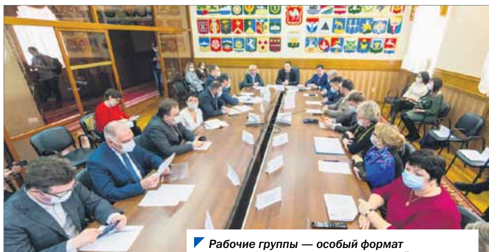
Рабочие группы — особый формат деятельности комитета по социальной политике.

С октября 2020 года по сентябрь 2021 года: 29 заседаний комитета по социальной политике проведено; 108 вопросов рассмотрено на заседаниях комитета; 32 законопроекта вынесено на заседания Законодательного Собрания; 15 проектов постановлений подготовлено.