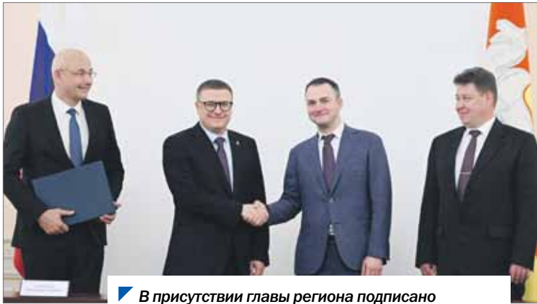
В присутствии главы региона подписано концессионное соглашение о реализации проекта.

составит общая площадь объектов кампуса.