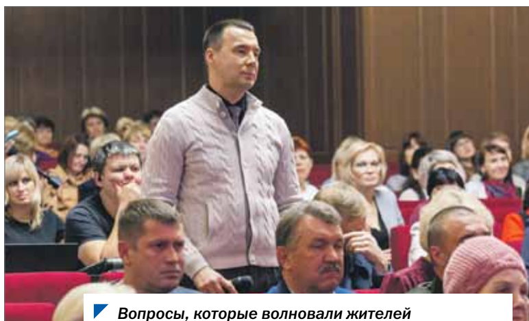
▶ Вопросы, которые волновали жителей на встречах, наверняка близки всем южноуральцам.