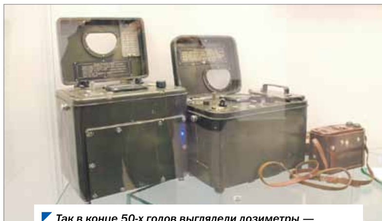
Так в конце 50-х годов выглядели дозиметры — приборы для измерения дозы радиоактивного излучения.

Авария 1957 года принесла огромное количество проблем, которые до сих пор не до конца решены. Она стала темным пятном в истории атомной промышленности страны.