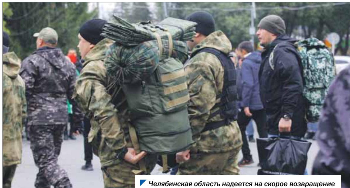
Челябинская область надеется на скорое возвращение домой своих бойцов, оказывая поддержку их родным.

оплаты труда в Челябинской области. Детям мобилизованных