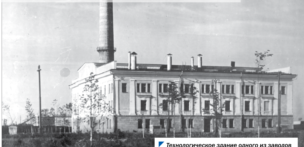
Технологическое здание одного из заводов химкомбината «Маяк», начало 1960-х годов.

ской и Тюменской областей, где тогда жили 270 тысяч человек.