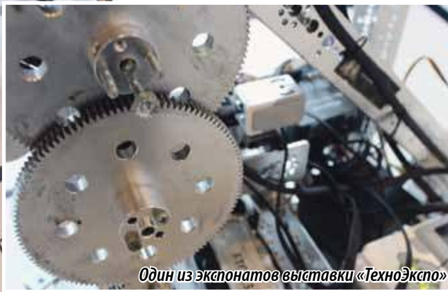
Один из экспонатов выставки «ТехноЭкспо»

Константин ЗАХАРОВ , заместитель председателя Законодательного Собрания Челябинской области, председатель комитета по экономической политике и предпринимательству (фракция «Единая Россия»):