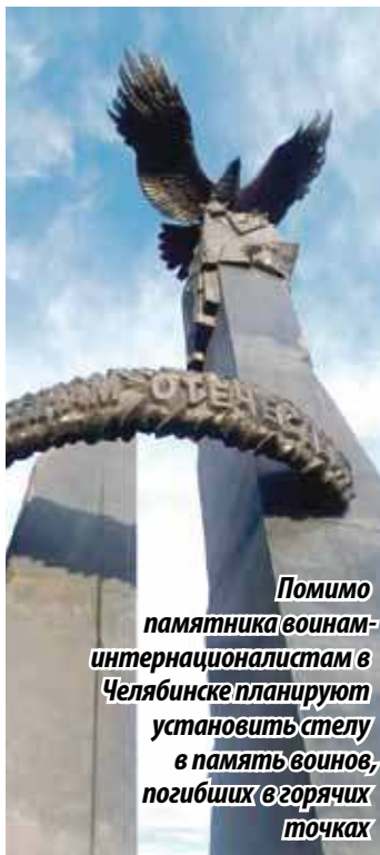
Помимо памятника воинам-интернационалистам в Челябинске планируют установить стелу в память воинов, погибших в горячих точках

Следующее заседание рабочей группы состоится в октябре.