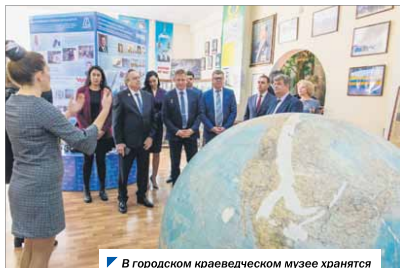
В городском краеведческом музее хранятся уникальные космические экспонаты.