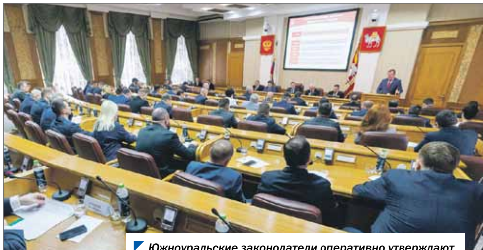
Южноуральские законодатели оперативно утверждают меры поддержки, которые предлагает глава региона.