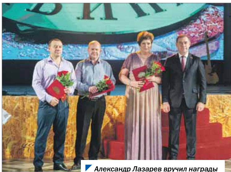
Александр Лазарев вручил награды работникам хлебокомбината.

Председатель Законодательного Собрания Александр Лазарев поздравил руководство и коллектив АО «Первый хлебокомбинат» с 90-летним юбилеем предприятия.