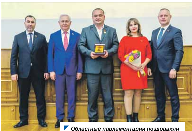
Областные парламентарии поздравили работников дорожной отрасли региона.