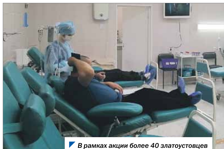
В рамках акции более 40 златоустовцев пришли на станцию переливания крови.