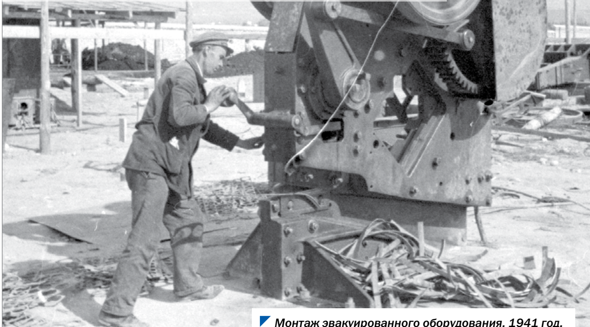
Монтаж эвакуированного оборудования, 1941 год.

6 октября в Челябинской области отмечалась памятная дата — День героев Танкограда. Она установлена 18 августа 2016 года на заседании Законодательного Собрания. Дата была выбрана не случайно. По решению Государственного комитета обороны именно в этот день в 1941 году началась эвакуация из Ленинграда танкового производства Кировского завода в Челябинск.