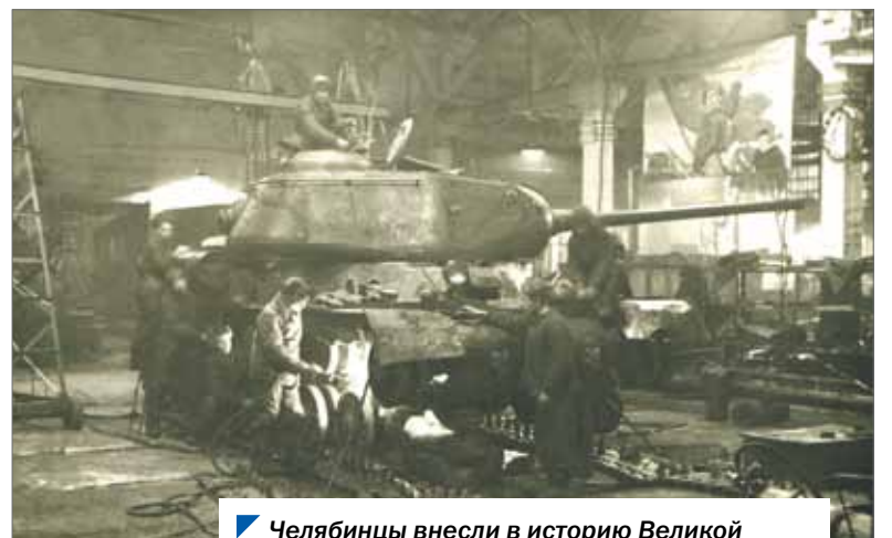
Челябинцы внесли в историю Великой Отечественной войны гордое имя «Танкоград».

характеристикам не вполне отвечает ее требованиям. Поэтому завод начал параллельно с КВ производить средние танки. В 1943 году был создан тяжелый танк ИС. Одновременно завод начал производство тяжелых самоходок СУ-152. Позже вместо этих самоходок начали производить ИСУ-152 и ИСУ-122 на базе танка ИС. Кировский завод сочетал в своих стенах разнообразное производство. Он осуществлял сборку танков, производил к ним большой ассортимент деталей, а также танковые дизели. Все производимые дизели были различными модификациями дизеля В-2. Кировский завод производил запчасти к танкам, литье для 76-миллиметровых снарядов и 120-миллиметровых мин, детали реактивных снарядов.