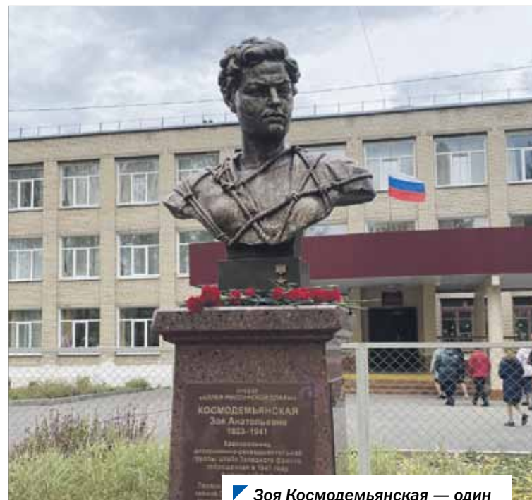
Зоя Космодемьянская — один из символов народного героизма.

Зоя Космодемьянская стала одним из символов героизма советского народа в годы Великой Отечественной войны. Образ девушки-красноармейца отражен в художественной литературе, публицистике, кинематографе, живописи, монументальном искусстве, музейных экспозициях.