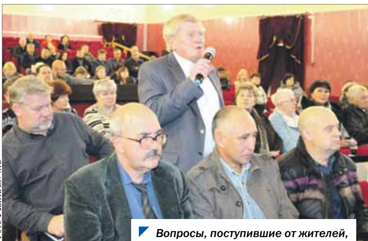
Вопросы, поступившие от жителей, депутаты взяли на контроль.