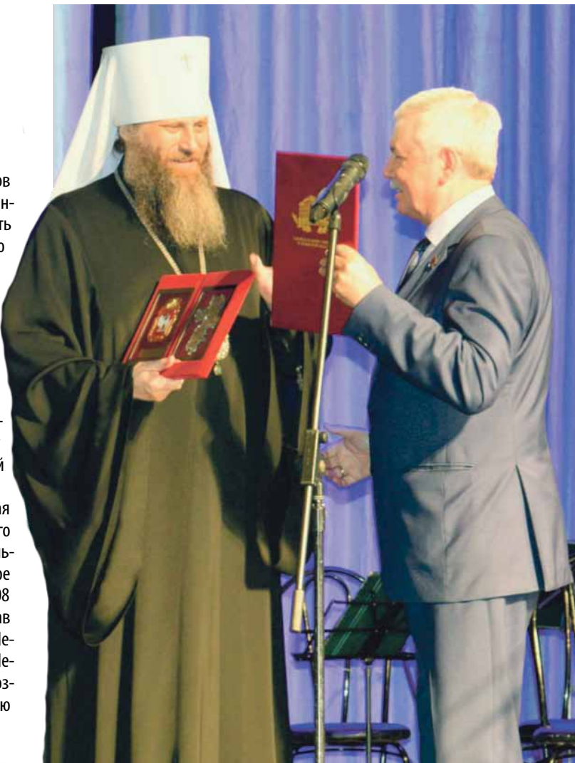
Владимир МЯКУШ , председатель Законодательного Собрания Челябинской области (фракция «Единая Россия»):

Стоит отметить, что Челябинская епархия прошла непростой путь своего становления. В качестве самостоятельной она была учреждена в сентябре 1918 года. Однако еще раньше, в 1908 году, в Оренбургской епархии, в состав которой на тот момент входил и Челябинский уезд, было учреждено Челябинское рекреатство. Это стало возможным благодаря бурному развитию церковной жизни на Южном Урале.