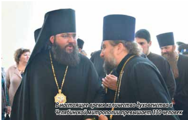
В настоящее время количество духовенства в Челябинской митрополии превышает 330 человек