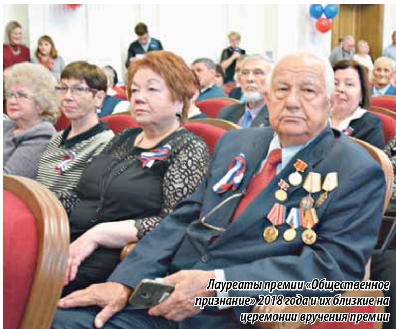
Лауреаты премии «Общественное признание» 2018 года и их близкие на церемонии вручения премии

в памяти человека и в нужный момент всплывают.