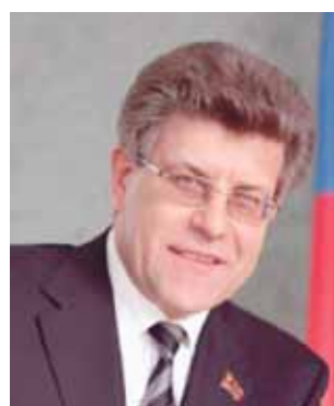
Александр ЖУРАВЛЕВ , заместитель председателя Законодательного Собрания Челябинской области, председатель комитета по социальной политике (фракция «Единая Россия»):

«Ход реализации федерального и регионального законов по предоставлению сертификатов материнского капитала депутаты Законодательного Собрания рассматривают регулярно и держат эту тему на постоянном контроле. Ведь она касается семей с детьми. К сожалению, в последнее время отмечаются факты незаконного обналичивания средств федерального материнского капитала. И нам сейчас важно понять, где именно есть пробел в законодательстве, который позволяет реализовывать мошеннические схемы. Мы уже подключили к этому вопросу прокуратуру Челябинской области, органы прокуратуры в территориях, главы муниципалитетов, председателей собраний депутатов, сотрудников министерства юстиции и другие контролирующие ведомства. Как только вопрос будет всесторонне изучен, мы подготовим предложения, которые направим на федеральный уровень.»