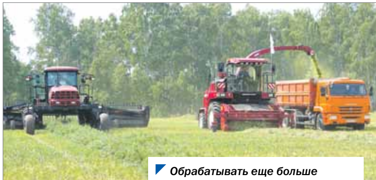
Обрабатывать еще больше мешают законодательные нюансы.

На Южном Урале за три последних года площадь пашни в обработке увеличилась на 119 тысяч гектаров. В этом году планируется ввести в сельхозоборот 8,4 тысячи гектаров. Однако, наряду с успехами, существует и ряд проблем.