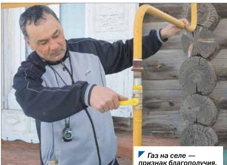
Газ на селе — признак благополучия.

В Челябинской области в этом году к сетевому газоснабжению подключат около десяти тысяч квартир и домов. На эти цели из регионального бюджета выделен один миллиард рублей.