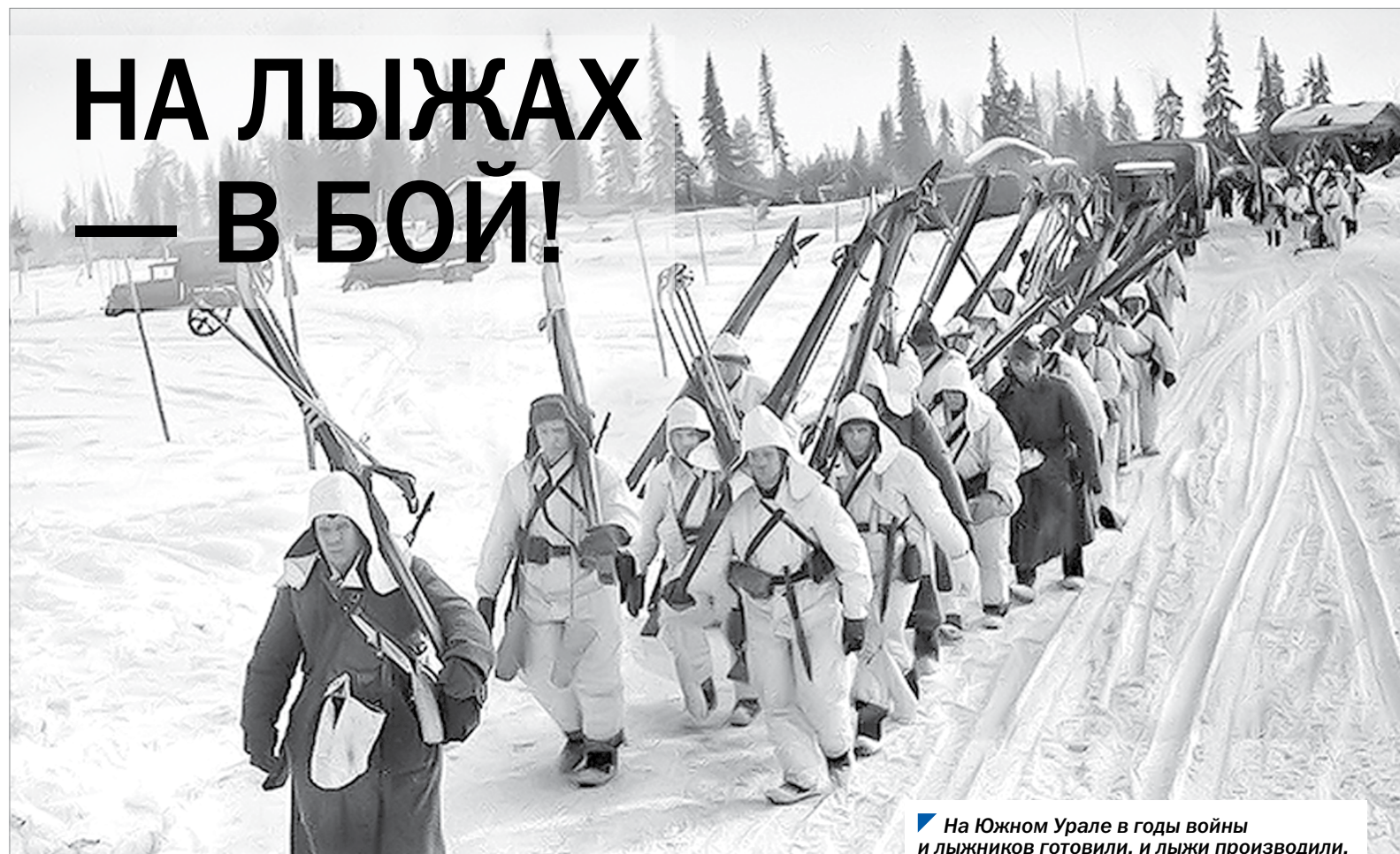
На Южном Урале в годы войны и лыжников готовили, и лыжи производили.

Лето 1941 года подходило к концу. Понимая, что военные действия могут принять затяжной характер и будут проходить в условиях зимы, правительство СССР и Государственный Комитет Обороны предприняли меры, направленные на подготовку боевых лыжных подразделений.