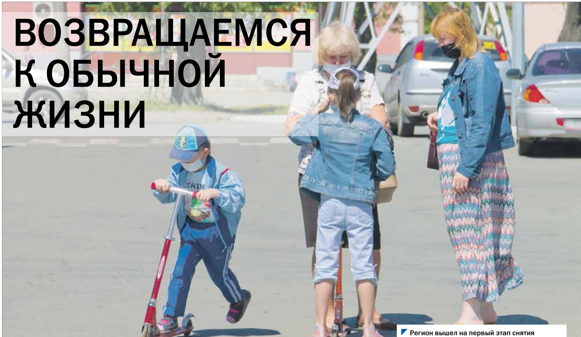
Регион вышел на первый этап снятия ограничений. Но масочный режим сохраняется.

На Южном Урале несколько дней подряд фиксировалось плавное снижение количества заболевших коронавирусом за сутки. Также наблюдается высокий уровень охвата тестированием населения, есть необходимый запас свободных коечных мест на госпитальных базах. Основываясь на этих трех главных показателях, губернатор Алексей Текслер объявил о первом этапе снятия ограничений, введенных в регионе из-за пандемии коронавируса.