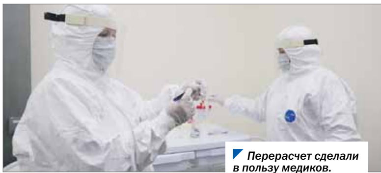
Перерасчет сделали в пользу медиков.

Медработникам области выплатили еще 55,4 млн рублей за работу с ковидными больными. Стимулирующие выплаты поступили после корректировок в постановлении федерального правительства.