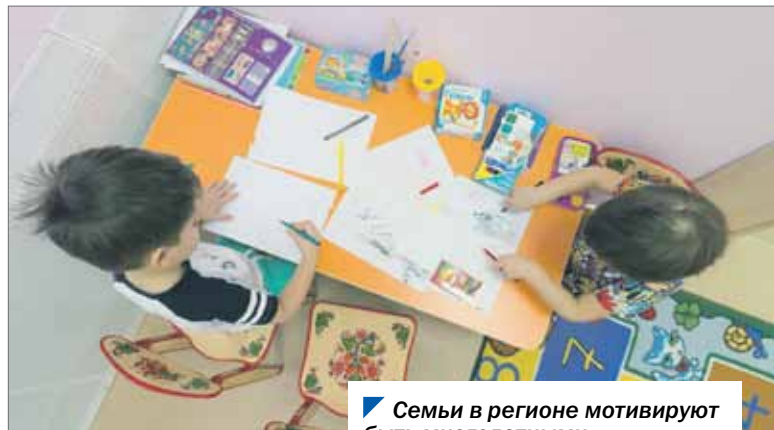
Семьи в регионе мотивируют быть многодетными.

В Челябинской области планируют расширить возможность использования регионального материнского капитала. Его разрешат тратить еще на три направления.