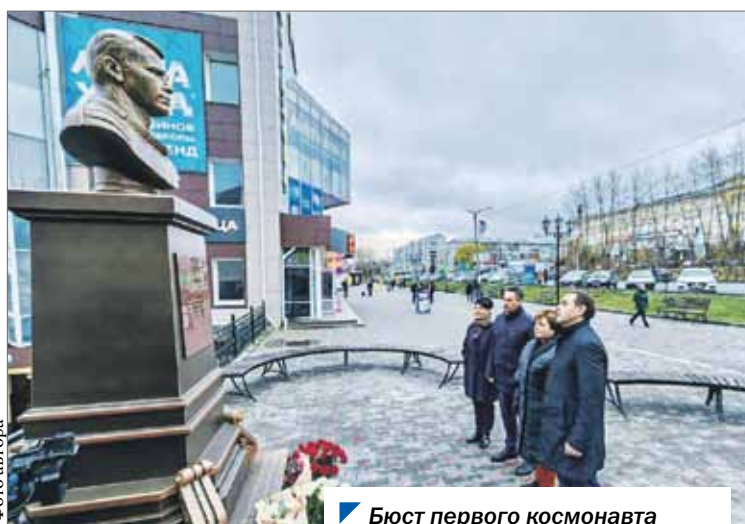
Бюст первого космонавта появился на проспекте Гагарина.

ТАКЖЕ В НОМЕРЕ: южноуральские архивисты — о рождении ЧТПЗ... с. 7