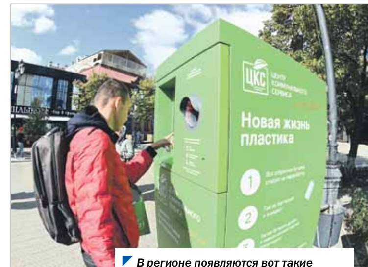
В регионе появляются вот такие фандоматы для раздельного сбора ТКО.

Что касается несанкционированных свалок, в этом году в регионе ликвидировали 423 такие свалки. Как отметил замминистра экологии Сергей Лавров, соглашения на ликвидацию несанкционированных свалок заключили только 26 муниципалитетов. Депутаты решили разобраться в сложившейся ситуации.