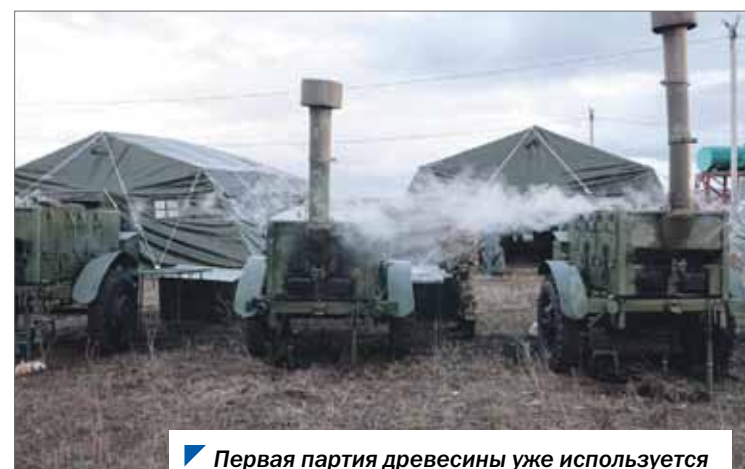
Первая партия древесины уже используется для обогрева полевых шатров.

— Важно, чтобы мобилизованные бойцы, проходя боевое слаживание, не отвлекались на бытовые вопросы, не растеряли боевого настроения. Мы гордимся, что в нашем округе есть предприятия и люди, готовые по первому зову прийти на помощь региону и стране в целом, — отметили депутаты.