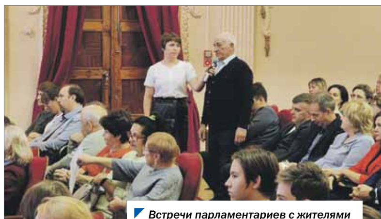
Встречи парламентариев с жителями Челябинской области продолжатся.