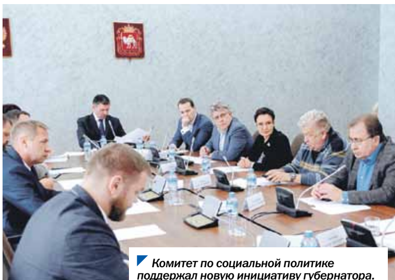
Комитет по социальной политике поддержал новую инициативу губернатора.

В Челябинской области студенты профессиональных образовательных организаций, воспитывающиеся в многодетных семьях, смогут получить компенсацию за обучение. Выплата составит 20% от расходов за годовую оплату обучения.