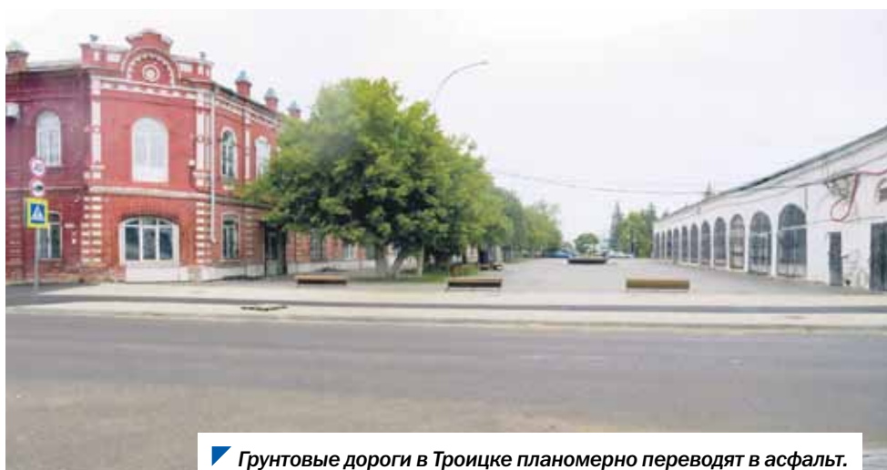
Грунтовые дороги в Троицке планомерно переводят в асфальт.