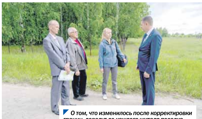
О том, что изменилось после корректировки границ, доведут до каждого жителя поселка.

путаты Законодательного Собрания приняли поправки в областные законы по корректировке границ пяти и состава семи муниципалитетов, в частности Еткульского, Октябрьского, Саткинского, Увельского и Троицкого районов. Для рассмотрения готовятся законопроекты по Катав-Ивановскому и Ашинскому районам.