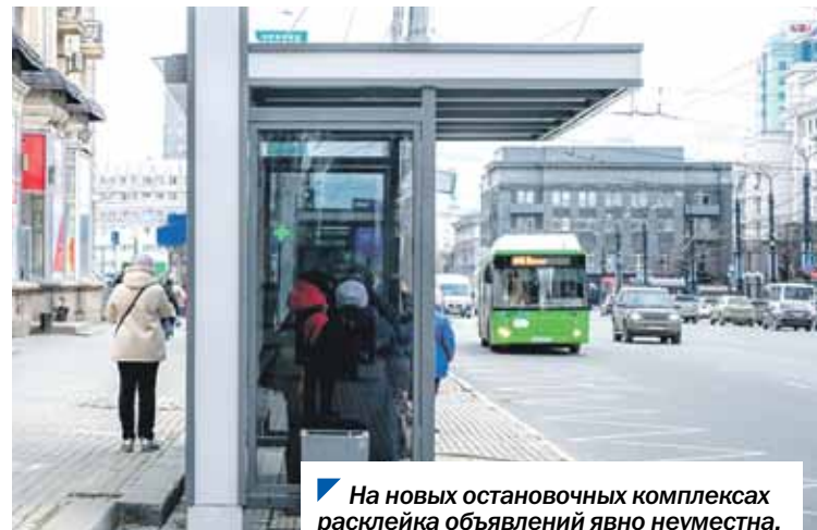
На новых остановочных комплексах расклейка объявлений явно неуместна.