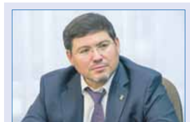
Алексей ДЕНИСЕНКО, председатель комитета Законодательного Собрания по строительной политике и ЖКХ:

Председатель временной комиссии Алексей Денисенко обратил внимание, что основная задача нацпроекта — увеличение доли автодорог регионального значения в нормативном состоянии до