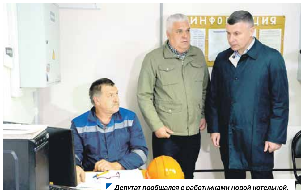
Депутат пообщался с работниками новой котельной.

— В целом можно сказать, что город динамично развивается. Совместная работа местных властей и депутатов приносит свои плоды, — резюмировал парламентарий.