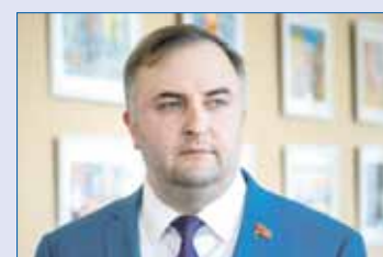
Олег ГЕРБЕР, исполняющий обязанности председателя Законодательного Собрания:

Отметим, Челябинская область стала пилотным регионом по реализации федерального проекта «Национальная система пространственных данных», в рамках которого обеспечивается описание местоположения границ муниципальных образований, населенных пунктов и территориальных зон с их внесением в Единый государственный реестр недвижимости. За прошедшие пять месяцев этого года де-