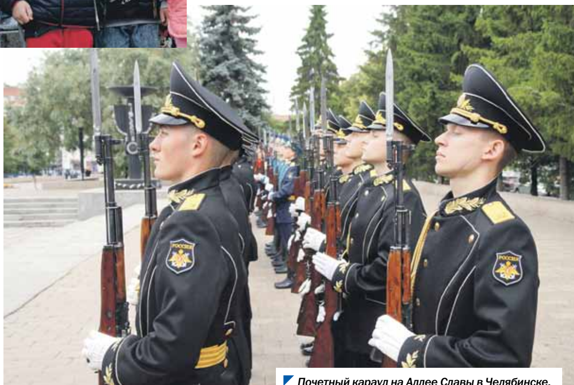
Почетный караул на Аллее Славы в Челябинске.

22 июня — особый день в истории России. День памяти о тех, кто отдал свои жизни за свободу и независимость нашей Родины в годы Великой Отечественной войны. В прошлый четверг в Челябинске состоялась церемония возложения венков и цветов к Вечному огню на Аллее Славы.