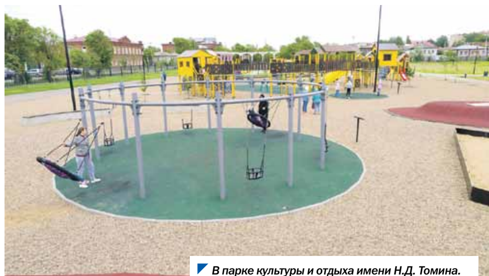
В парке культуры и отдыха имени Н.Д. Томина.

— Я уроженка Троицка, но так вышло, что в начале 2000-х уехала. Часто приезжаю сюда с детьми навещать своих родителей. Со стороны, конечно, видно, как преобразился город, —