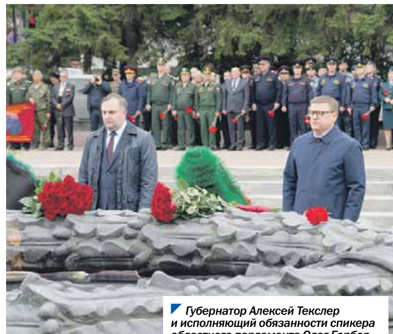
Губернатор Алексей Текслер и исполняющий обязанности спикера областного парламента Олег Гербер.