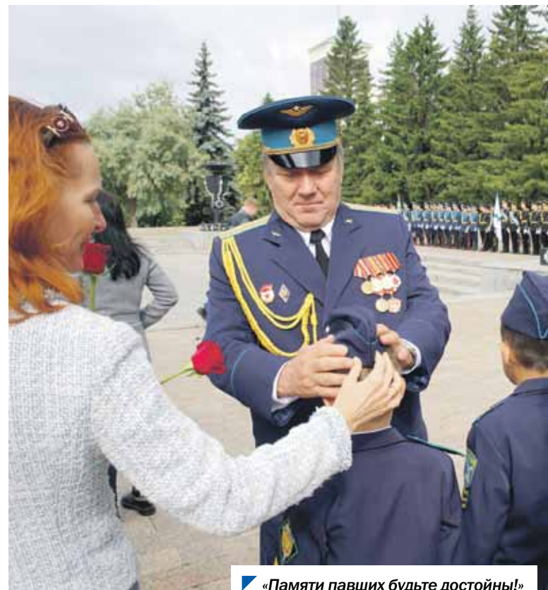
«Памяти павших будьте достойны!»

В построении почетного караула приняли участие курсанты Челябинского филиала учебно-научного центра «Военно-воздушная академия».