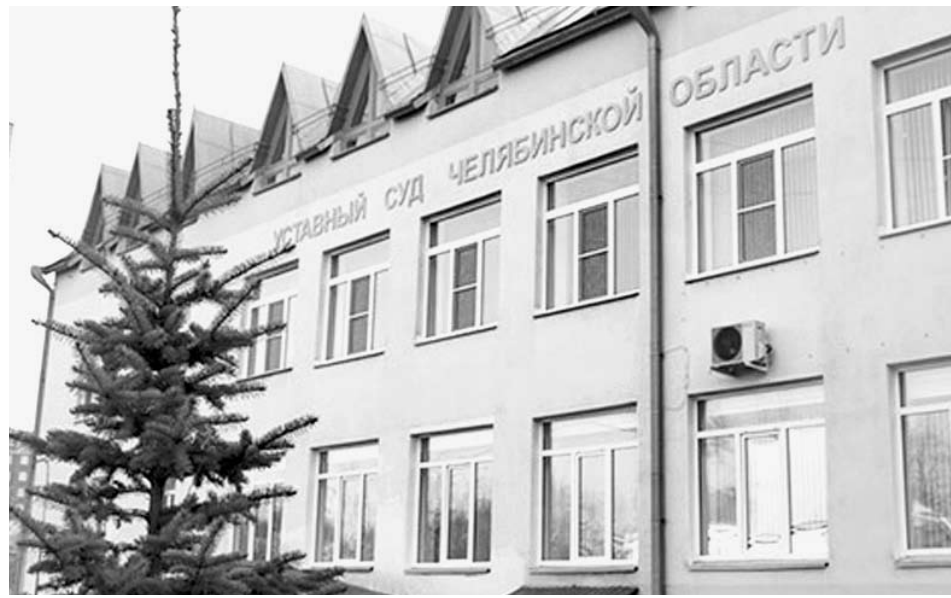
Уставный суд — это третья ветвь областной власти на Южном Урале, наряду с правительством и Законодательным Собранием. Его задача — осуществлять уставной контроль над двумя другими ветвями власти, уравновешивая их.

Кстати, открытие состоялось на этой неделе, в среду. Структура разместилась в доме № 7 по улице Образцова. Изначально задумывалось, что Уставный суд станет своего рода арбитром в спорах между муниципальными и региональными органами власти, а также парламентариями разных уровней. Однако практика показала, что жители области также стремятся участвовать в принятии законов. Но заявления от граждан, согласно изначально