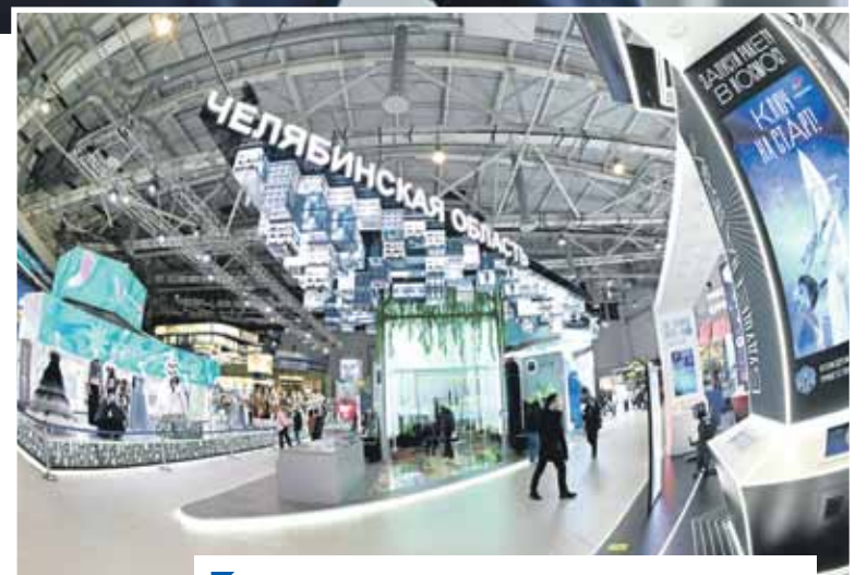
Выставка-форум проходит на знаменитой ВДНХ.

— В свете той ситуации, которая происходит вокруг России, очень важно подчеркнуть достоинства каждого