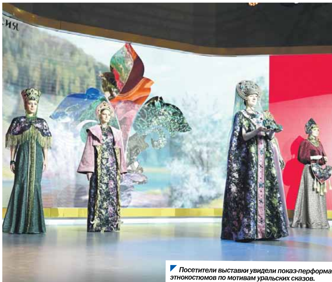
Посетители выставки увидели показ-перформанс этно костюмов по мотивам уральских сказов.

День Челябинской области прошел на выставке-форуме «Россия»