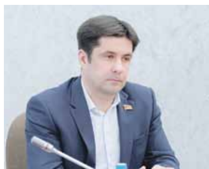
Дмитрий ПЫСИКОВ, первый заместитель председателя комитета по аграрной политике:

— В 2024 году на развитие сельского хозяйства в Челябинской области планируется выделить 2,9 миллиарда рублей, что соответствует ассигнованиям 2023 года. При этом важно отметить, что нынешний год был сложным по