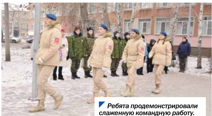
Ребята продемонстрировали слаженную командную работу.