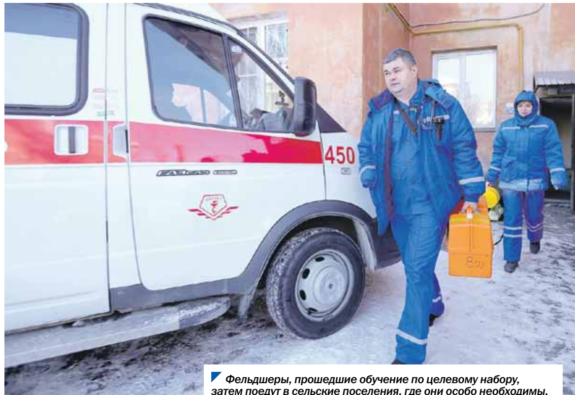
Фельдшеры, прошедшие обучение по целевому набору, затем поедут в сельские поселения, где они особо необходимы.

В рамках целевого договора обучающимся будет предоставляться ежемесячная денежная выплата. Инициативу губернатора Алексея Текслера поддержали депутаты комитета Законодательного Собрания по социальной политике.