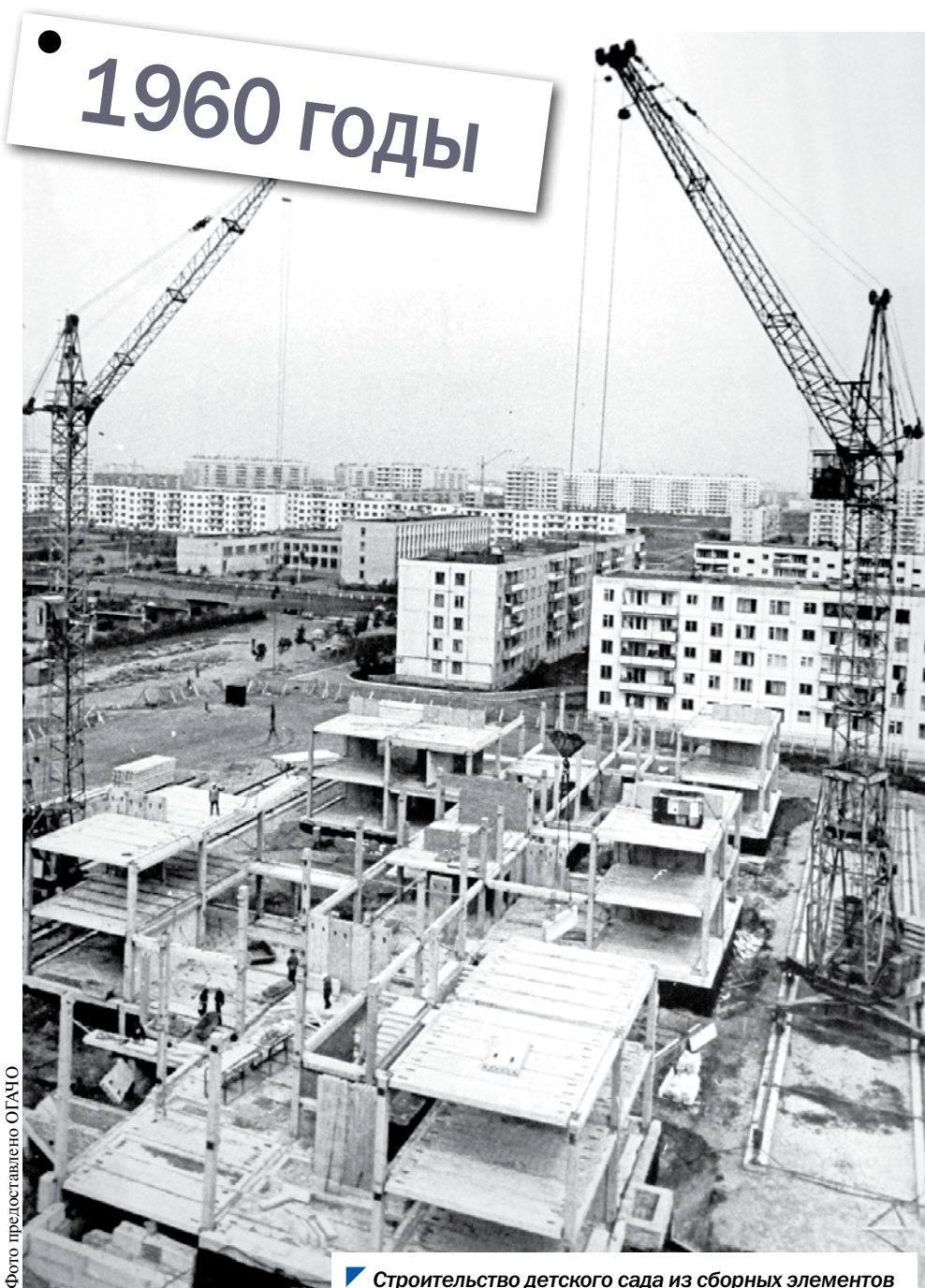
Строительство детского сада из сборных элементов в Калининском районе г. Челябинска, 1970-е.

«Парламентской недели» и Объединенного государственного архива Челябинской области.