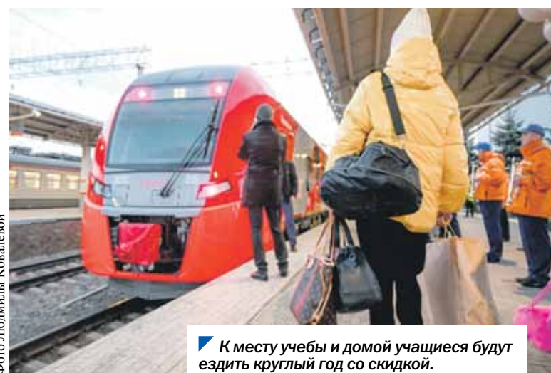
К месту учебы и домой учащиеся будут ездить круглый год со скидкой.

Инициативу на рассмотрение Законодательного Собрания внес губернатор. Напомним, сейчас областным законом предусмотрены льготы учащимся школ, студентам-очникам профессиональных образовательных организаций и высших учебных заведений в размере 50% скидки от действующих тарифов на проезд железнодорожным транспортом общего пользования в пригородном сообщении с 1 января по 15 июня и с 1 сентября по 31 декабря.