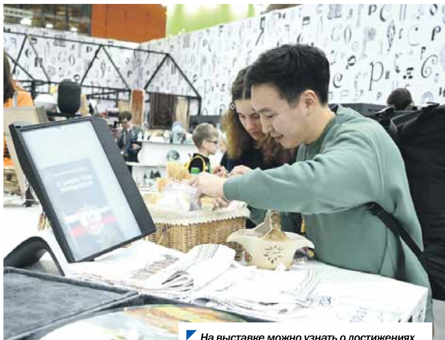
На выставке можно узнать о достижениях каждого из 89 регионов России.