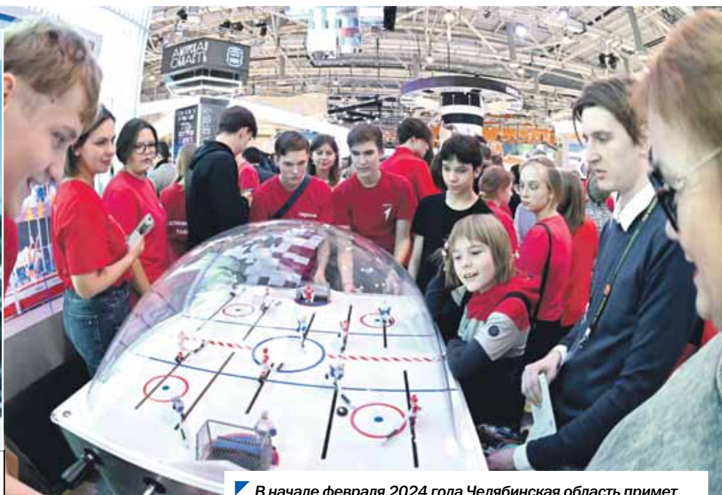
В начале февраля 2024 года Челябинская область примет Всероссийскую спартакиаду по зимним видам спорта.

Алексей Текслер: «Мы посвятили наш стенд человеку и его мечте. Мы считаем, что в Челябинской области любая мечта может осуществиться, и делаем все, чтобы так и было. Мы любим Челябинскую область и нашу страну»