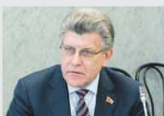
Александр Журавлев родился 19 ноября.

Депутат по Единому избирательному округу, первый заместитель председателя комитета Законодательного Собрания по социальной политике, входит в состав комитета Законодательного Собрания по законодательству, государственному строительству и местному самоуправлению.