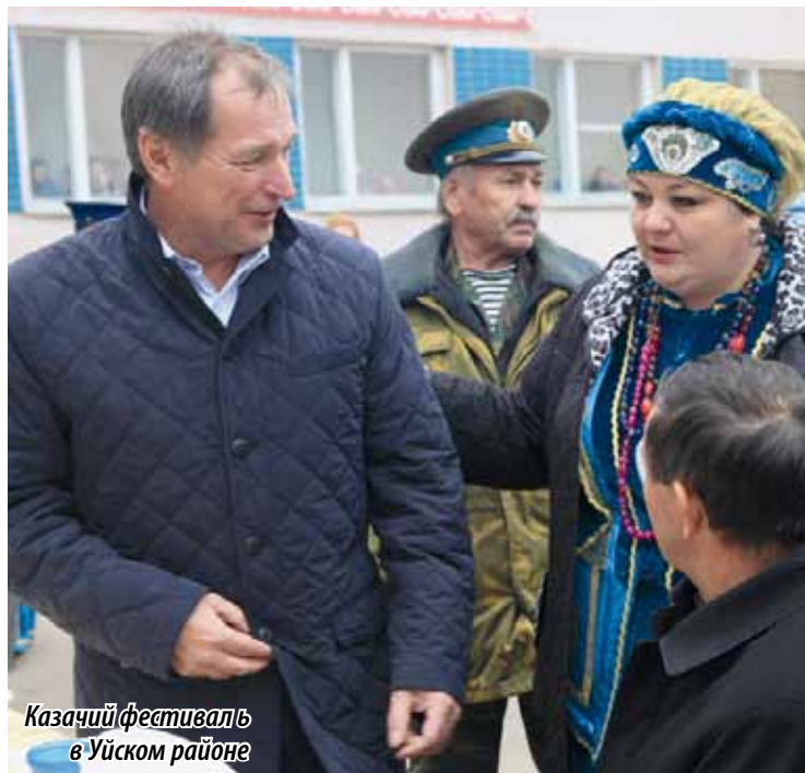
Казачий фестиваль в Уйском районе