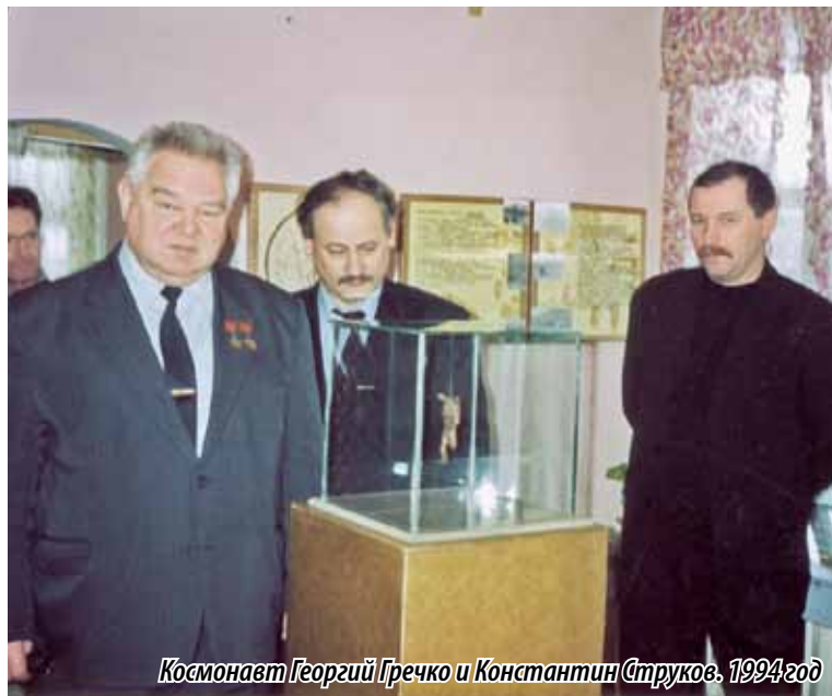
Космонавт Георгий Гречко и Константин Струков, 1994 год

Константин Струков человек слова. Если он обещает что-то сделать, то непременно выполняет обещание.