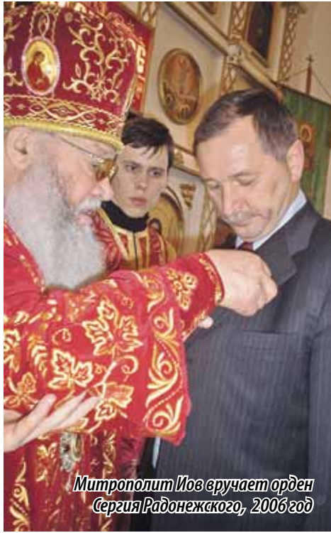
Митрополит Иос вручает орден Сергия Радонежского, 2006 год