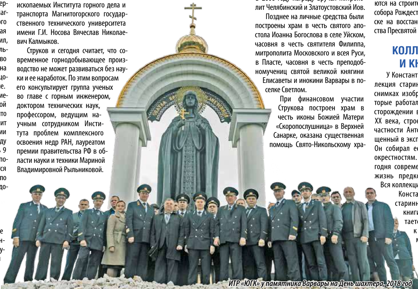
ИТР «ЮГК» у памятника Варвары на День шахтера, 2018 год