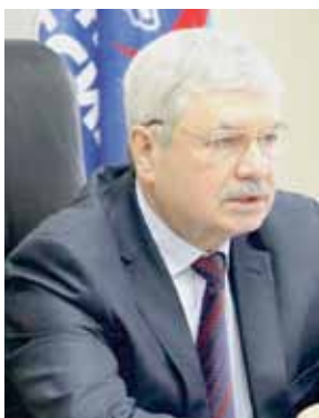
Владимир МЯКУШ, председатель Законодательного Собрания Челябинской области (фракция «Единая Россия»):

«Бывая в муниципальных образованиях, встречаясь с нашими жителями в рамках общественных приемных, часто можно было слышать от пенсионеров вопрос: «Почему, имея автомобиль мощностью, например, 153 лошадиных силы, я должен платить транспортный налог в полном объеме, хотя на автомобиле до 150 л. с. он уплачивался льготниками в размере 1 рубля за лошадиную силу?» Неслучайно глава региона