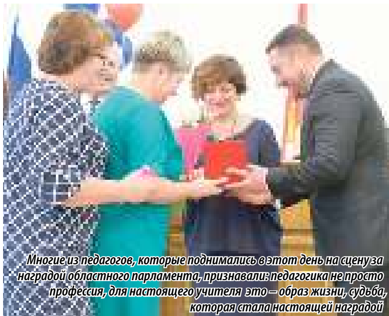
Многие из педагогов, которые поднимались в этот день на сцену за наградой областного парламента, признавали: педагогика не просто профессия, для настоящего учителя это — образ жизни, судьба, которая стала настоящей наградой