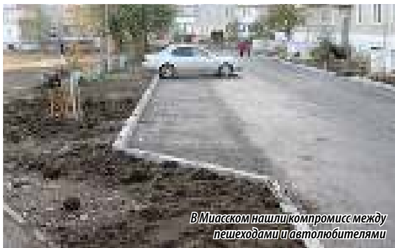
В Миасском нашли компромисс между пешеходами и автолюбителями