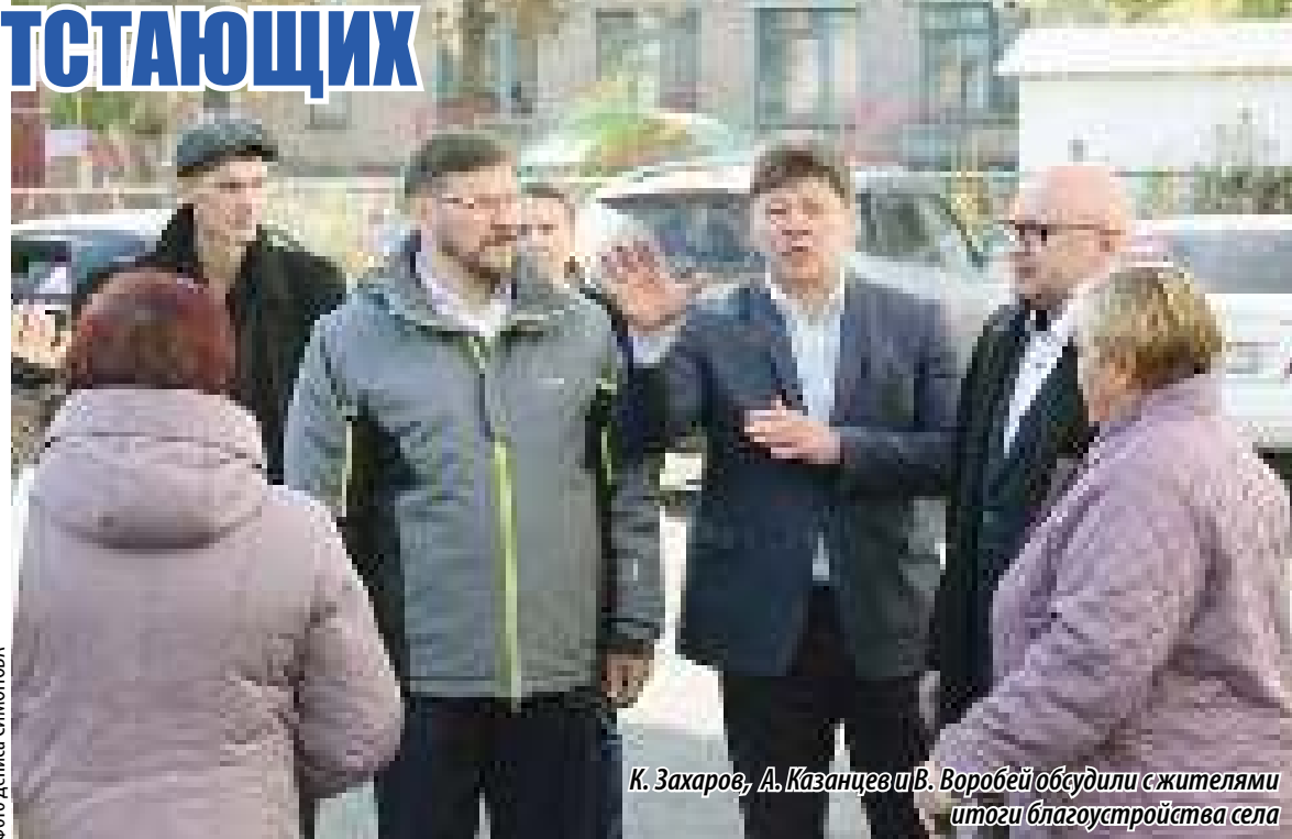
К. Захаров, А. Казанцев и В. Воробей обсудили с жителями итоги благоустройства села

Константин ЗАХАРОВ , заместитель председателя Законодательного Собрания Челябинской области (фракция «Единая Россия»):