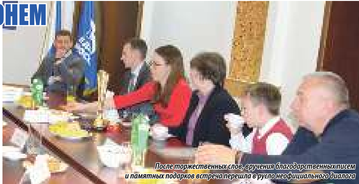
После торжественных слов, вручения благодарственных писем и памятных подарков встреча перешла в русло неофициального диалога