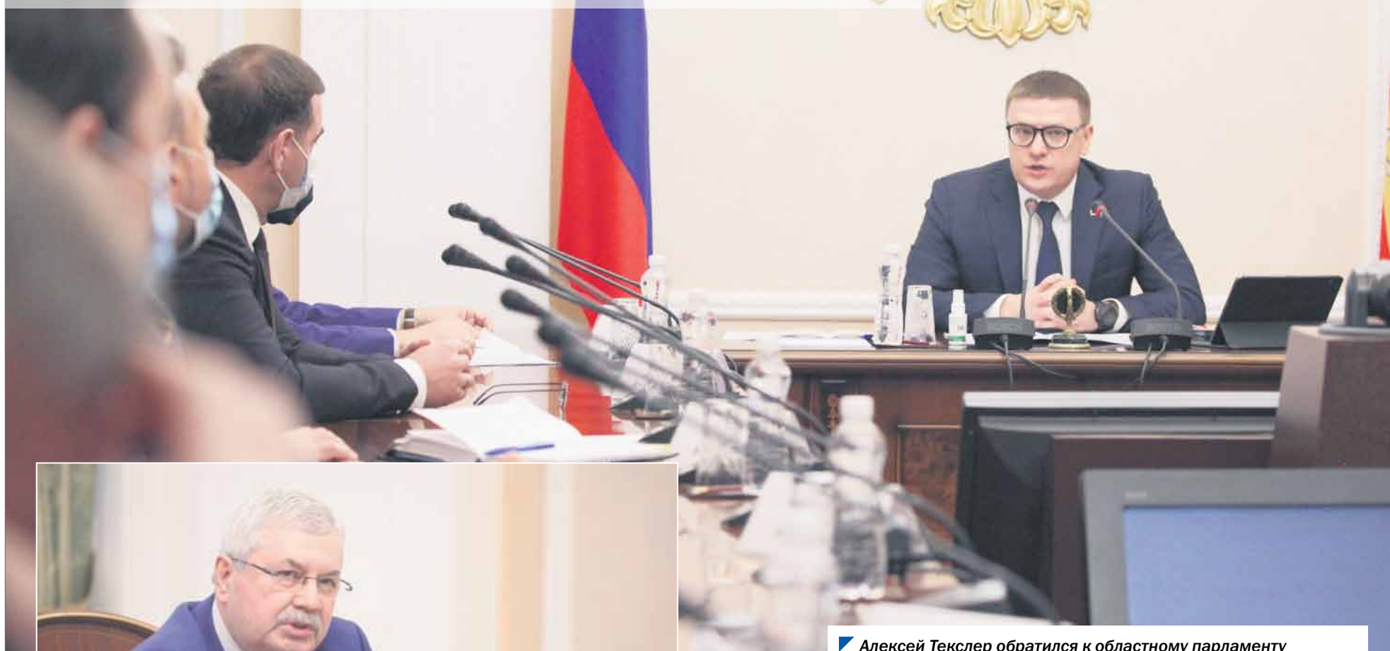
▲ Алексей Текслер обратился к областному парламенту с просьбой активно включиться в обсуждение проекта бюджета.