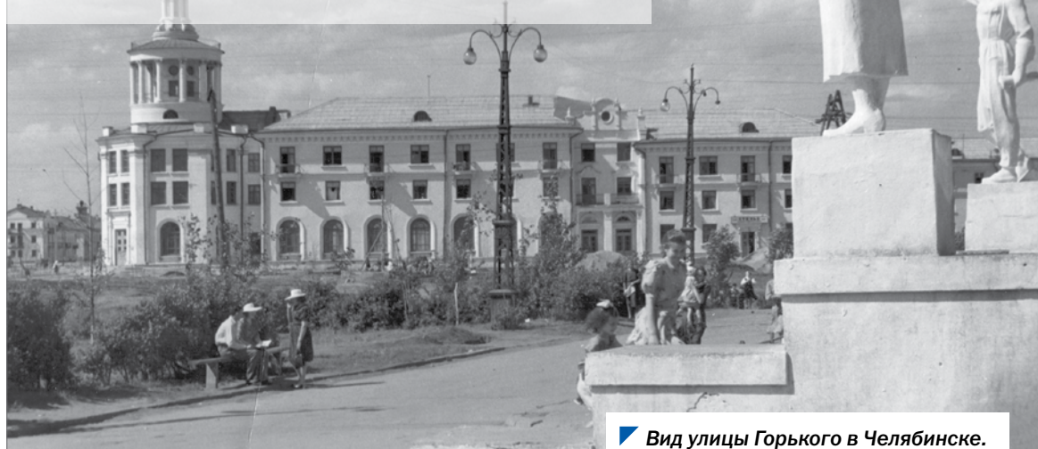
▶ Вид улицы Горького в Челябинске. Послевоенное время.

района тратили в очереди по 6 часов. В районе часто на несколько часов прерывалась подача питьевой воды.