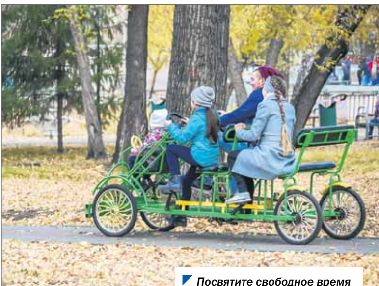
Посвятите свободное время самым близким людям.

— Мы должны остановить распространение инфекции, а для этого нужно разорвать социальные связи, — объясняет депутат Законодательного Собрания.