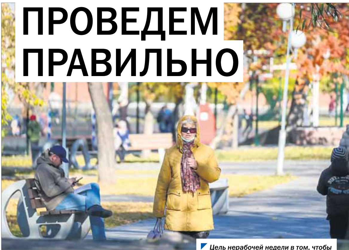
Цель нерабочей недели в том, чтобы сбить пик новой волны пандемии.