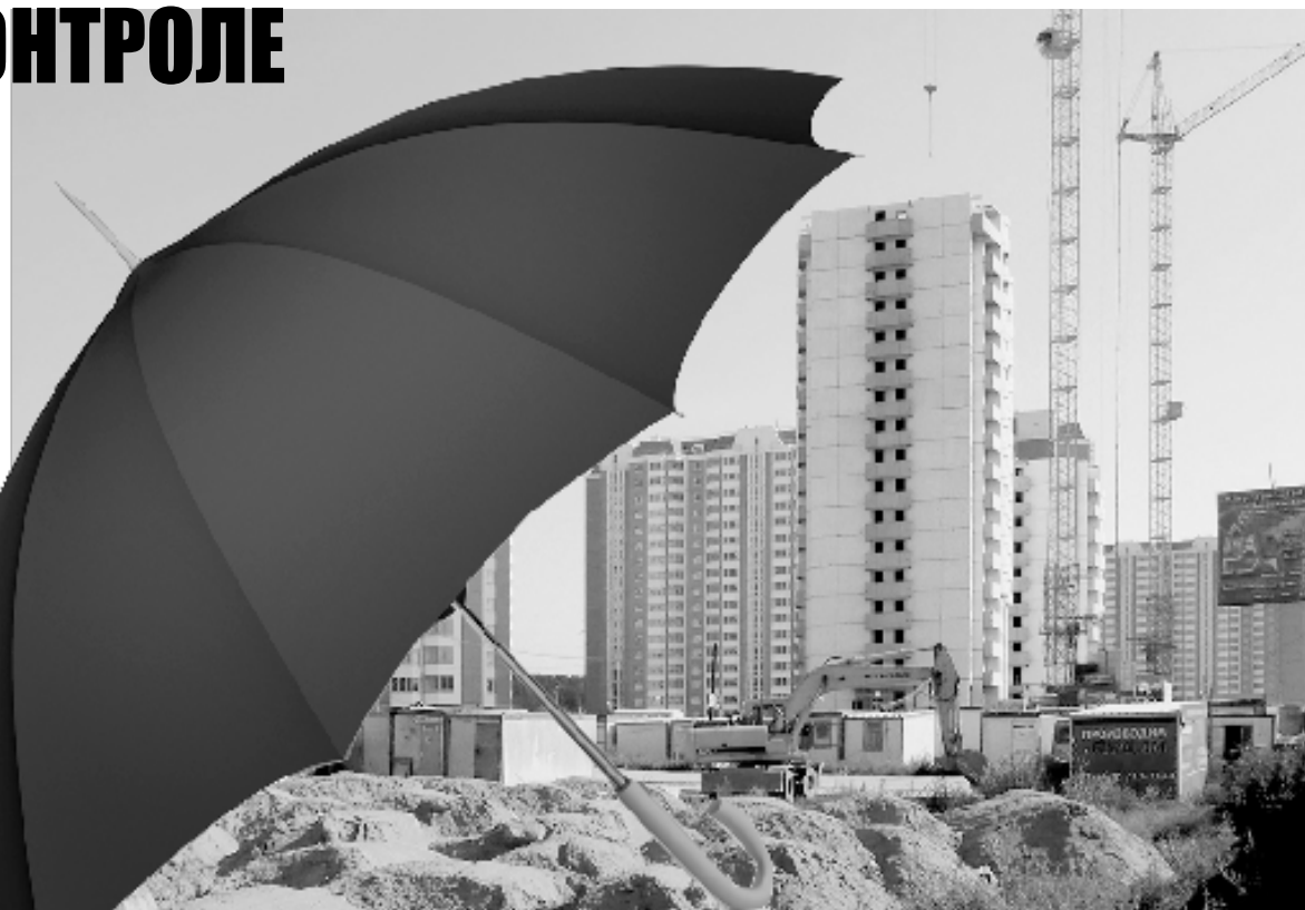
Коллаж Людмила МАНУРИНОЙ

стройщиков, которые обманывают людей, к уголовной ответственности. К сожалению, вторую законодательную инициативу в Госдуме не приняли во внимание, однако первая наша законодательная инициатива нашла поддержку у депутатов