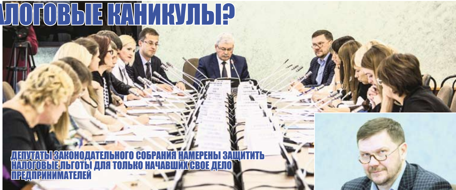
ДЕПУТАТЫ ЗАКОНОДАТЕЛЬНОГО СОБРАНИЯ НАМЕРЕНЫ ЗАЩИТИТЬ НАЛОГОВЫЕ ЛЬГОТЫ ДЛЯ ТОЛЬКО НАЧАВШИХ СВОЕ ДЕЛО ПРЕДПРИНИМАТЕЛЕЙ

В связи с этим возникла обоснованная необходимость привести в соответствие с новым классификатором — ОКВЭД 2014 года (который с 1 января следующего года будет действовать взамен отмененным классификаторам) виды деятельности, установленные в действующих законах. При этом основная задача членов рабочей группы, заседание которой состоялось 9