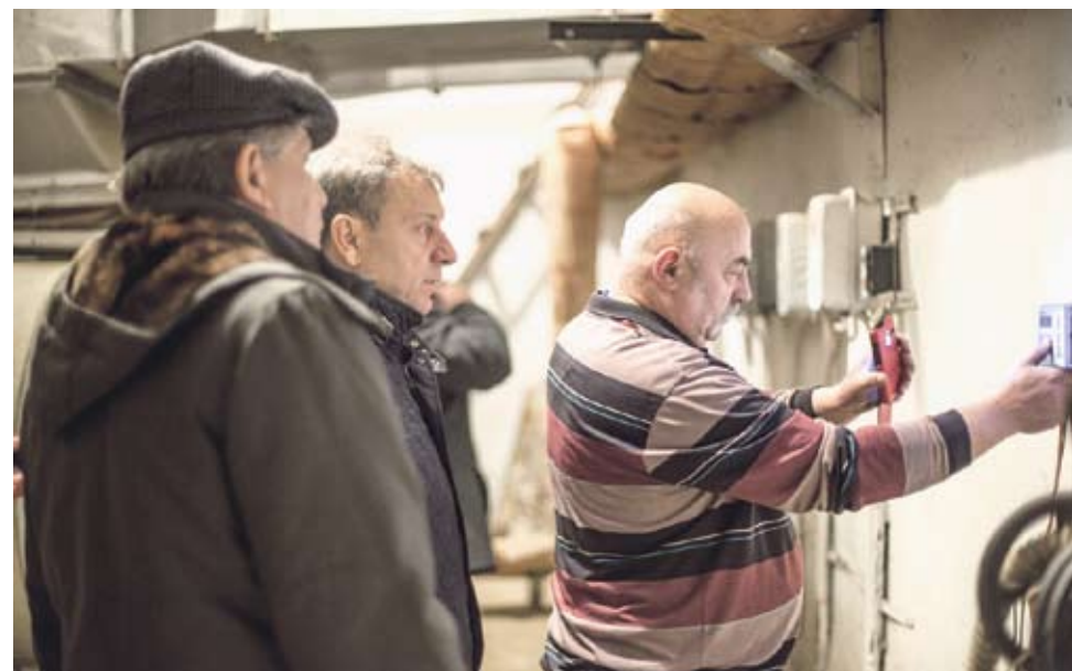
Проверка работы системы отопления в Бишкильской школе.