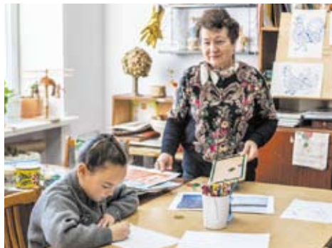
Занятие в художественном кружке.