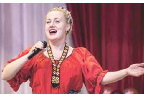
Выступления творческих коллективов на концерте в селе Кундравы.

Именно они, аграрии России, отметили 11 ноября свой профессиональный праздник – День работников сельского хозяйства и перерабатывающей промышленности. Он традиционно празднуется именно в ноябре: к этому сроку завершаются все уборочные работы и можно подвести итоги. По данным министерства сельского хозяйства Челябинской области, в нынешнем году в нашем регионе собрано более 1 миллиона 900 тысяч тонн зерна. Вклад в областную зерновую копилку внесли хлеборобы Чебаркульского района, собравшие более 60 тысяч тонн. Местные полеводы заготовили достаточное количество кормов, чтобы в штатном режиме провести зимовку скота. Порадовали животноводы: за 10 месяцев получено 11 тысяч тонн молока, при удое на 1 фуражную корову в среднем по району 4509 килограммов, что на 300 килограммов больше, чем в прошлом году.