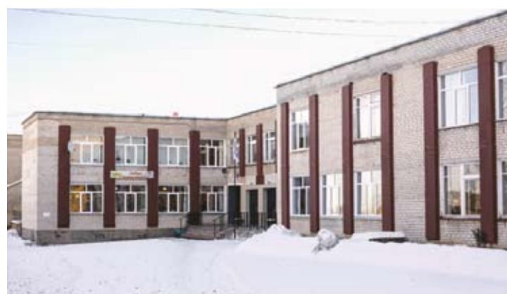
Бишкильская общеобразовательная школа имени героя России Германа Угрюмова.

«В свое время ко мне на депутатский прием пришли два педагога Бишкильской школы и объяснили, что в случае когда на улице более чем -15 градусов, детей отпускают домой. Было принято решение о том, чтобы общими усилиями руководства области, Законодательного Собрания, администрации района снять проблемный вопрос. Кроме того, поставлены новые окна на сумму 600 тысяч рублей, отремонтирована кровля на 2,8 миллиона рублей. К тому же муниципальное предприятие взамен котлов древесного топлива установило автоматизированную газовую котельную, и она, безусловно, дает больше тепла школе...»