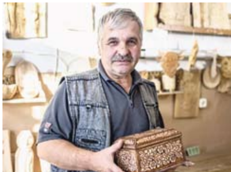
В творческой мастерской резьбы по дереву.