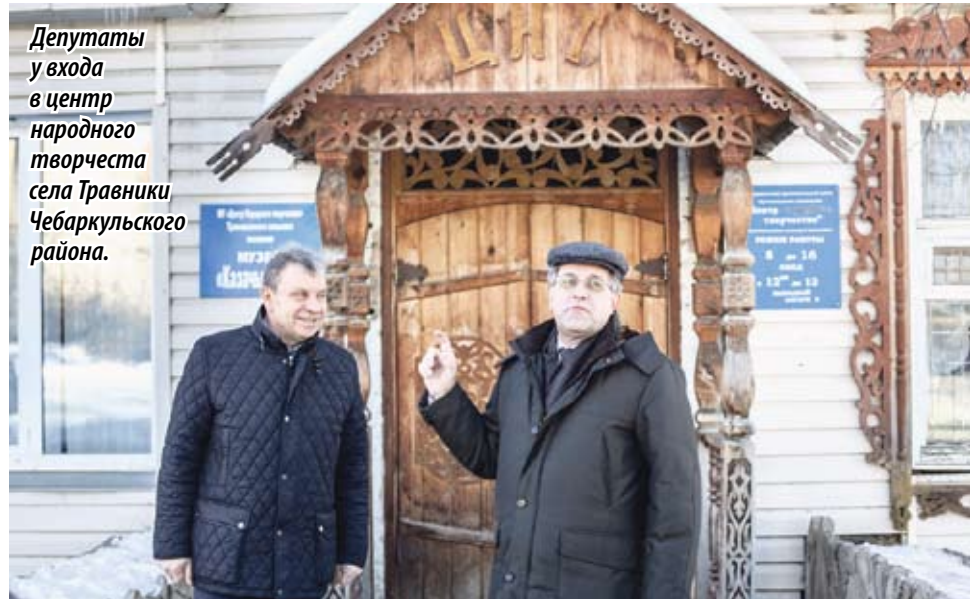
Депутаты у входа в центр народного творчества села Травники Чебаркульского района.