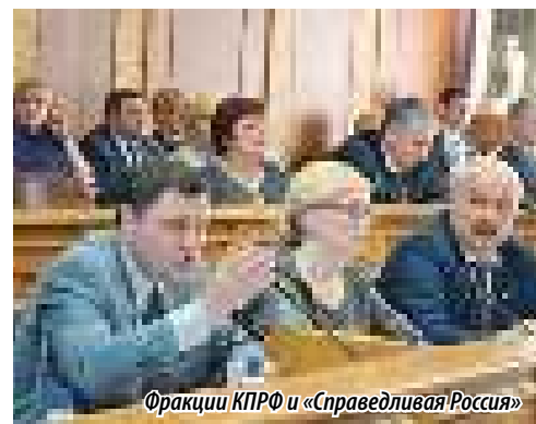
Фракции КПРФ и «Справедливая Россия»