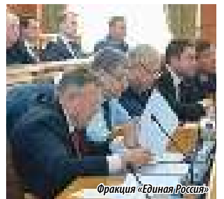
Фракция «Единая Россия»