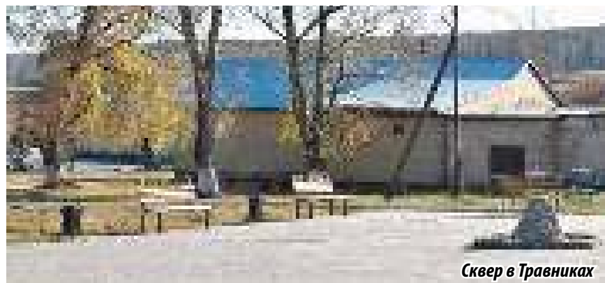
Сквер в Травниках