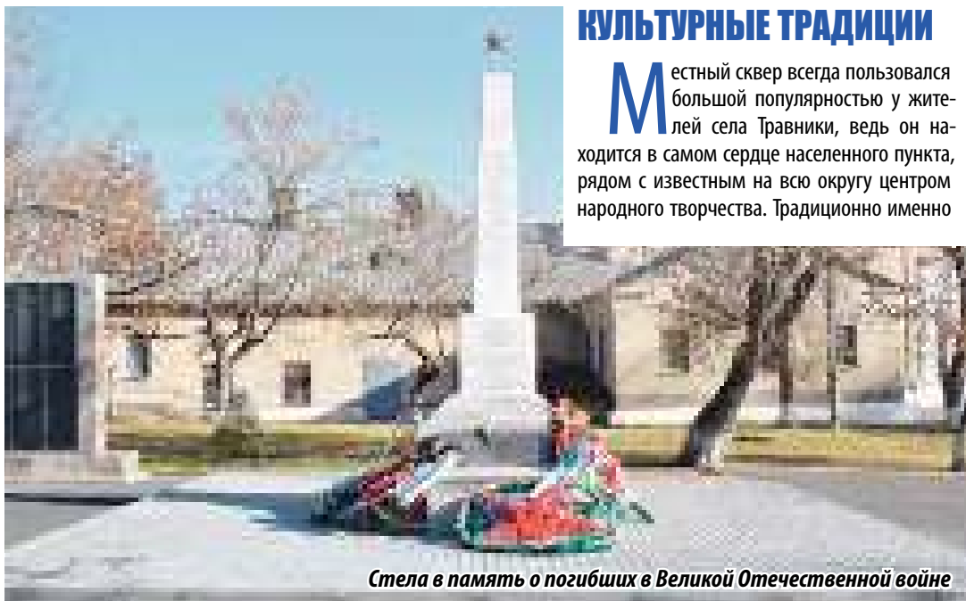
Стела в память о погибших в Великой Отечественной войне