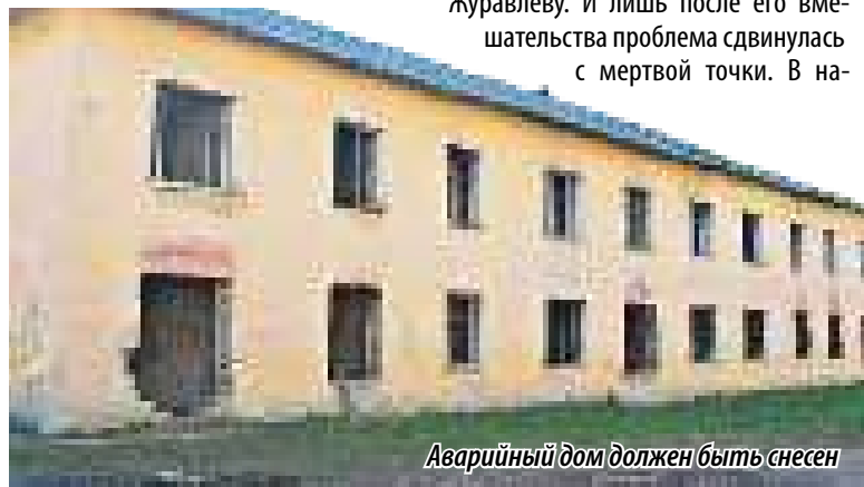
Аварийный дом должен быть снесен