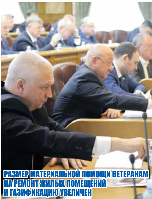
РАЗМЕР МАТЕРИАЛЬНОЙ ПОМОЩИ ВЕТЕРАНАМ НА РЕМОНТ ЖИЛЫХ ПОМЕЩЕНИЙ И ГАЗИФИКАЦИЮ УВЕЛИЧЕН

Кроме того, за счет перераспределения денежные средства в размере 477,5 млн рублей пойдут на увеличение фонда оплаты труда педагогических работников дошкольного образования с целью достижения в 2019 году целевых показателей майских указов главы государства. Сто миллионов направят на строительство или покупку жилья для переселения граждан из жилищного фонда, признанного непригодным для проживания. На создание новых мест в общеобразовательных организациях – 89 млн рублей, дотации на сбалансированность местных бюджетов – более 33 млн рублей.