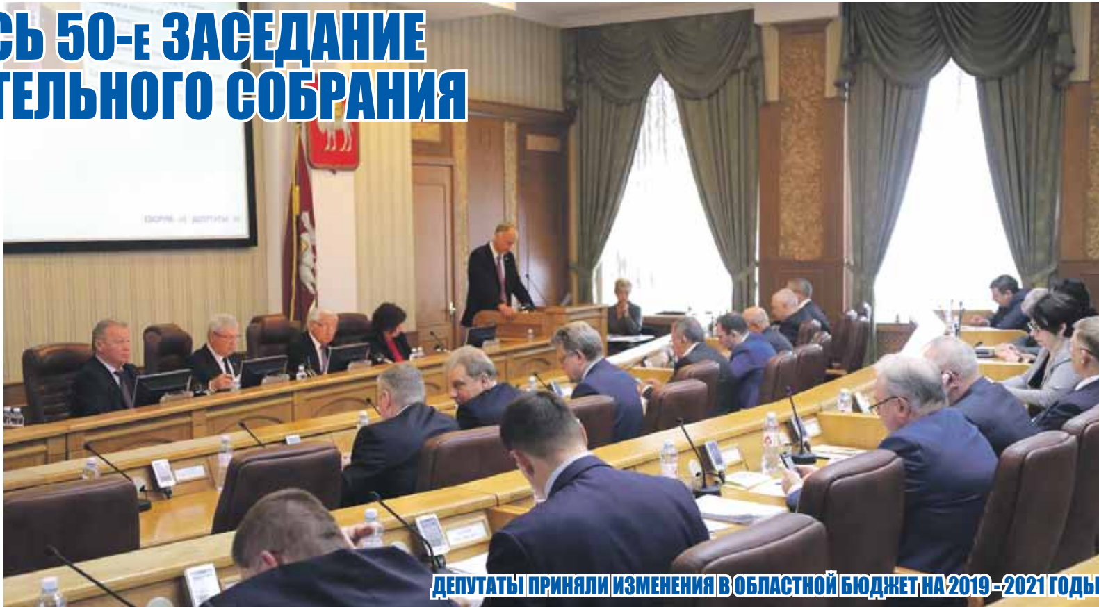
ДЕПУТАТЫ ПРИНЯЛИ ИЗМЕНЕНИЯ В ОБЛАСТНОМ БЮДЖЕТЕ НА 2019–2021 ГОДЫ

31 ОКТЯБРЯ, В ПОСЛЕДНИЙ ДЕНЬ МЕСЯЦА, ПРОШЛО ПЯТИДЕСЯТОЕ ЗАСЕДАНИЕ ЗАКОНОДАТЕЛЬНОГО СОБРАНИЯ ЧЕЛЯБИНСКОЙ ОБЛАСТИ. ЦЕНТРАЛЬНЫМИ ВОПРОСАМИ ПОВЕСТКИ ОКТЯБРЬСКОГО ЗАСЕДАНИЯ ПОД ПРЕДСЕДАТЕЛЬСТВОМ СПИКЕРА ЮЖНОУРАЛЬСКОГО ПАРЛАМЕНТА ВЛАДИМИРА МЯКУША (ФРАКЦИЯ «ЕДИНАЯ РОССИЯ») СТАЛИ ИЗМЕНЕНИЯ В РЕГИОНАЛЬНОМ БЮДЖЕТЕ. КРОМЕ ТОГО, ПО УЖЕ СЛОЖИВШЕЙСЯ ТРАДИЦИИ ДЕПУТАТЫ ПОДДЕРЖАЛИ ПАКЕТ СОЦИАЛЬНЫХ ЗАКОНОВ, В ТОМ ЧИСЛЕ КАСАЮЩИХСЯ ПОДДЕРЖКИ ВЕТЕРАНОВ ВЕЛИКОЙ ОТЕЧЕСТВЕННОЙ ВОЙНЫ, ЧТО ОСОБЕННО СИМВОЛИЧНО НАКАНУНЕ ЮБИЛЕЙНОГО ГОДА – 75-ЛЕТИЯ ПОБЕДЫ.