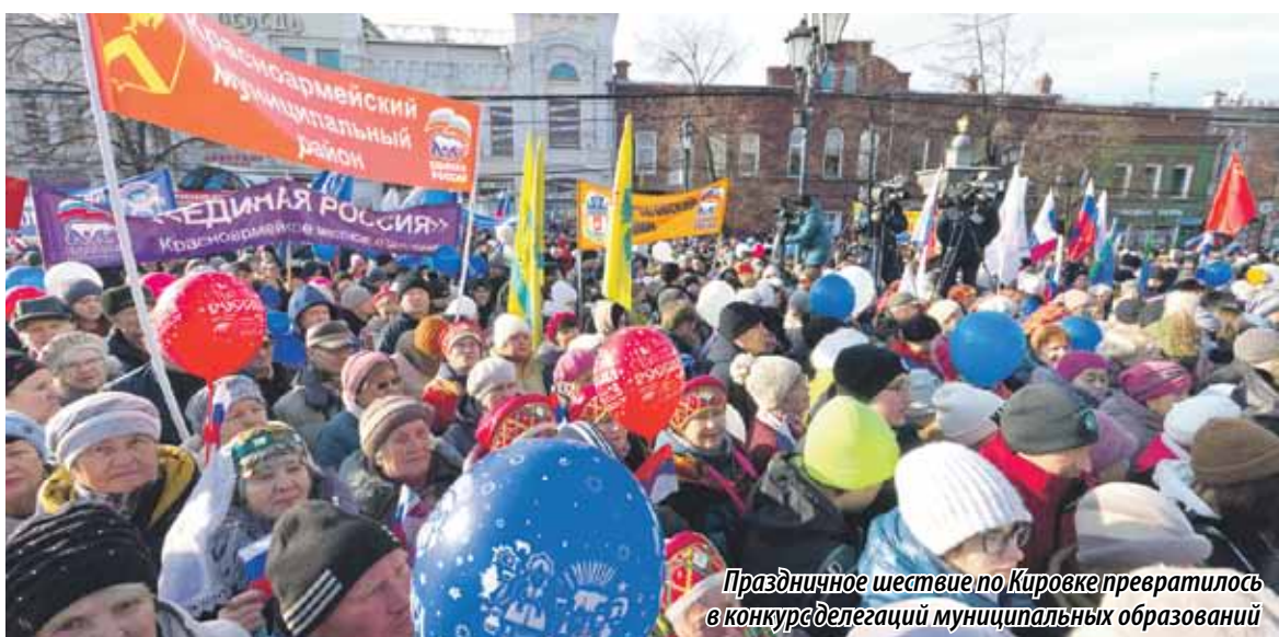
Праздничное шествие по Кировке превратилось в конкурс делегаций муниципальных образований

4 НОЯБРЯ ЮЖНЫЙ УРАЛ БОЛЬШОЙ МНОГОНАЦИОНАЛЬНОЙ СЕМЬЕЙ ОТМЕТИЛ ДЕНЬ НАРОДНОГО ЕДИНСТВА. ЕДВА ЛИ НЕ В КАЖДОМ НАСЕЛЕННОМ ПУНКТЕ ПРОШЛИ СВОИ КОНЦЕРТЫ И НАРОДНЫЕ ГУЛЯНЬЯ, СОЕДИНИВШИЕСЬ В ИТОГЕ В ОДИН ДРУЖНЫЙ ХОРОВОД. ЦЕНТРАЛЬНОЙ ПЛОЩАДКОЙ ПРАЗДНИКА СТАЛА ПЕШЕХОДНАЯ ЧАСТЬ УЛИЦЫ КИРОВА В ЧЕЛЯБИНСКЕ.