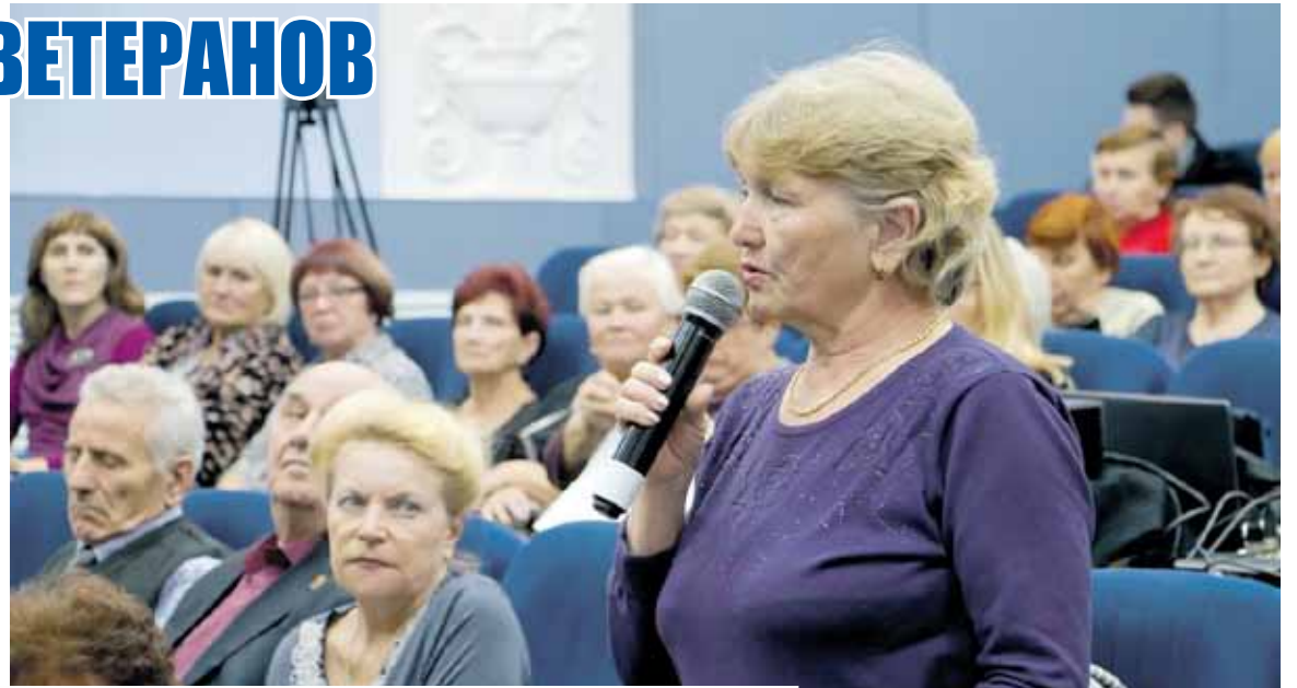
Немало вопросов озвучили ветераны по подготовке к 75-летию Победы

Немало вопросов озвучили ветераны по предстоящей подготовке и проведению мероприятий, посвященных 75-летию Победы в Великой Отечественной войне. И, конечно, всякий раз ответ был положительным. Так, вскоре будут выделены средства на благоустройство воинских захоронений в Бредах; матери-