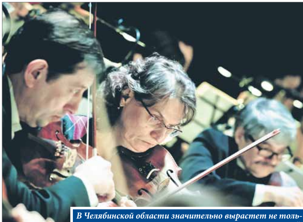
В Челябинской области значительно вырастет не только количество, но и качество культурных мероприятий

Будут приобретены 2 передвижных автоклуба для сельских территорий (Верхнеуральский и Пластовский районы)