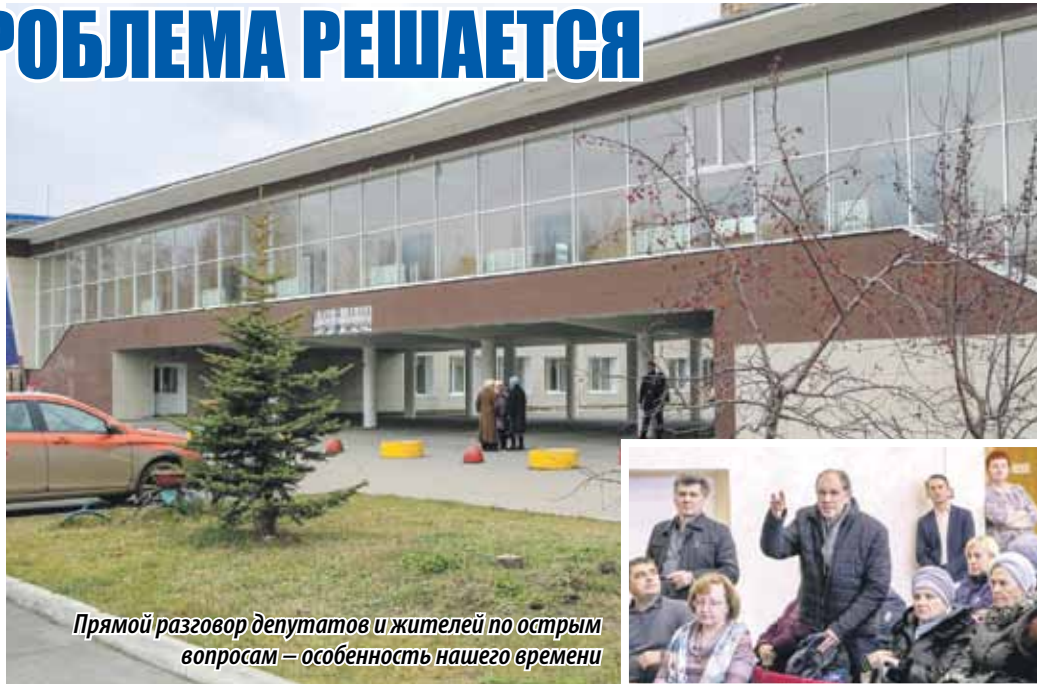
Прямой разговор депутатов и жителей по острым вопросам – особенность нашего времени

– Это займет примерно полгода. Но работа по исправлению замечаний идет в еже-