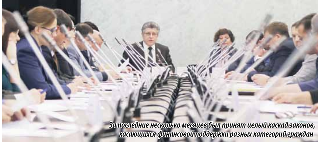
За последние несколько месяцев был принят целый каскад законов, касающихся финансовой поддержки разных категорий граждан