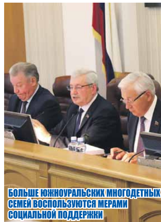
БОЛЬШЕ ЮЖНОУРАЛЬСКИХ МНОГОДЕТНЫХ СЕМЕЙ ВОСПОЛЬЗУЮТСЯ МЕРАМИ СОЦИАЛЬНОЙ ПОДДЕРЖКИ

Еще один закон касается безвозмездного предоставления благоустроенного жилья семьям, которые с 1 января 2016 года взяли на воспитание не менее пяти детей в возрасте от 10 до 15 лет. Ряд семей в Челябинской области уже получили такое жилье. Между тем в Законодательное Собрание поступали обращения от приемных родителей, чьи дети выходят за рамки установленного возраста, а значит, они не могли воспользоваться мерой поддержки. Мы инициировали рабочее совещание, обратились в адрес главы региона, который поддержал предложение и внес законопроект, расширивший возрастной диапазон. Считаю эту меру действенной в решении проблем приемных семей. »