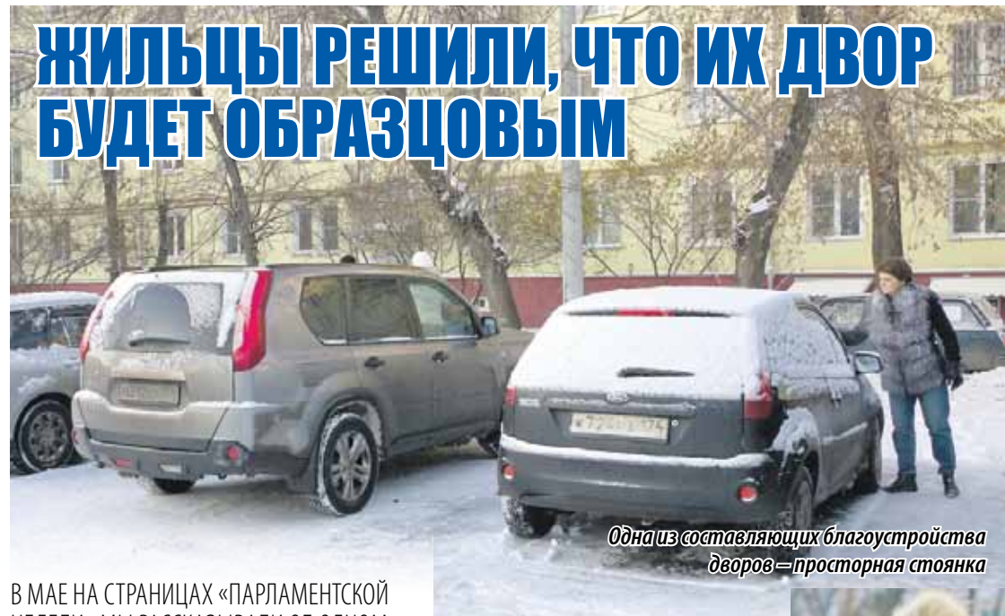
Одна из составляющих благоустройства дворов – просторная стоянка

В МАЕ НА СТРАНИЦАХ «ПАРЛАМЕНТСКОЙ НЕДЕЛИ» МЫ РАССКАЗЫВАЛИ ОБ ОДНОМ ИЗ ДВОРОВ ТРАКТОРЗАВОДСКОГО РАЙОНА ЧЕЛЯБИНСКА, ЖИТЕЛИ КОТОРОГО НЕ ПЕРВЫЙ ГОД СТРЕМИЛИСЬ ПОПАСТЬ В ПРОЕКТ «ГОРОДСКАЯ СРЕДА», НО, ТАК И НЕ ПРИДЯ К ЕДИНУМУ МНЕНИЮ, ПРЕДЛОЖИВ БОЛЕЕ 10 ВОЗМОЖНЫХ ВАРИАНТОВ БЛАГОУСТРОЙСТВА И СНОВА НЕ УСПЕВ ВОЙТИ В ПРОЕКТ НА ТЕКУЩИЙ ГОД, ОБРАТИЛИСЬ ЗА ПОМОЩЬЮ К ПРЕДСЕДАТЕЛЮ ЗАКОНОДАТЕЛЬНОГО СОБРАНИЯ ВЛАДИМИРУ МЯКУШУ (ФРАКЦИЯ «ЕДИНАЯ РОССИЯ»). ИЗВЕСТНО, ЧТО ПОДДЕРЖКА БЫЛА ПОЛУЧЕНА. НО КАКОВА СУДЬБА МНОГОСТРАДАЛЬНОЙ ДВОРОВОЙ ТЕРРИТОРИИ? ЧТО С НЕЙ СТАЛО ЗА ЭТО ВРЕМЯ? ПОСМОТРЕЛИ СПУСТЯ ПОЧТИ ПОЛГОДА.