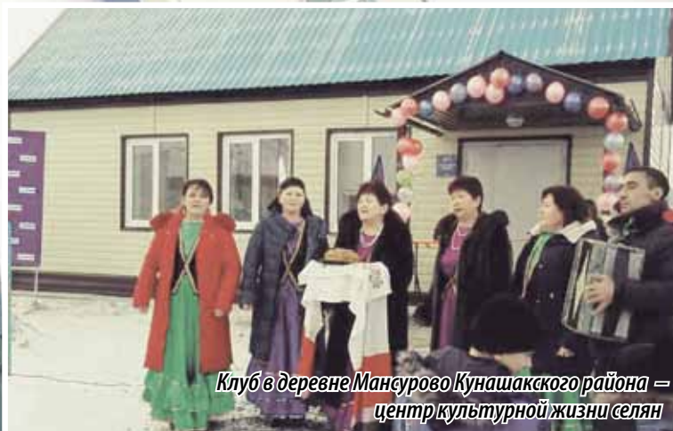
Клуб в деревне Мансурово Кунашакского района — центр культурной жизни селян

После масштабной реконструкции городской Дом культуры стал еще одной достопримечательностью Южноуральска