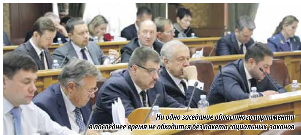
Ни одно заседание областного парламента в последнее время не обходится без пакета социальных законов

Так, объем трансфертов из федерального бюджета увеличился на сумму 4 млрд 169,8 млн рублей. Основной объем средств в размере чуть более четырех миллиардов рублей направят на финансовое обеспечение дорожной деятельности для развития автодорог регионального и местного значения. Более 80 миллионов рублей пойдет на реконструкцию и капитальный ремонт региональных и муниципальных театров. На развитие рынка газомоторного топлива выделено 80 миллионов рублей. Пять миллионов направлено на создание модельных муниципальных библиотек.