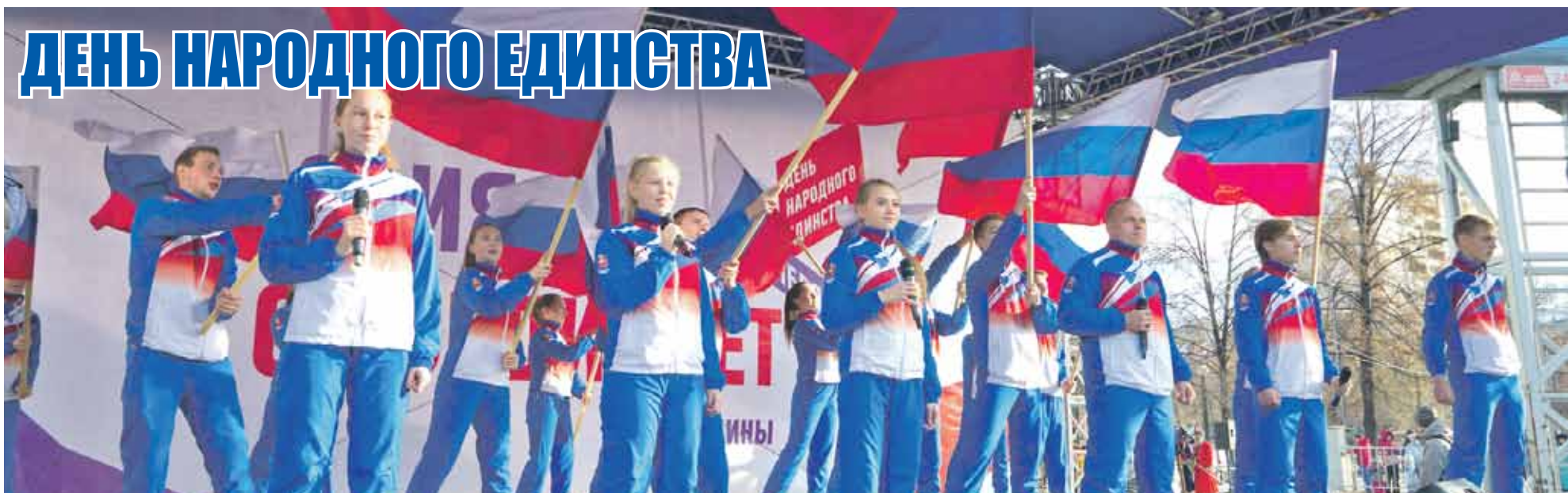
Для молодого поколения южноуральцев День народного единства — молодой праздник