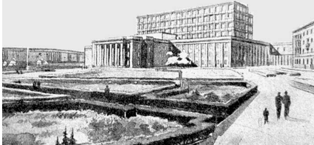
Дом Советов по версии тридцатых годов. На месте нынешнего драмтеатра.

Многое из того, что задумали архитекторы прошлого, воплощено в современной южноуральской столице. Широкие прямые улицы, красивые парки, уникальные для своего времени здания торгового центра, цирка, драматического театра... Но далеко не все замыслы были претворены в жизнь. Не катаемся мы на лодочках по полноводной реке Миасс, не смотрим выступления цирковых трупп в шапите в парке имени Гагарина, не женимся в нарядном Дворце бракосочетаний, похожем на распутившийся белый цветок... С историками и архивистами мы собрали топ-10 нереализованных идей из советских генпланов.