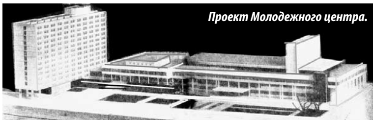
Проект Молодежного центра.

высокий зал, где с высоты 20 метров яркие солнечные лучи высвечивают торжественное место – стол для регистрации брака. Залы шампанского, комнаты депутата и фотографов, киоски сувениров и цветов – все будет к услугам новобрачных. Родители и друзья смогут со специальных мест в зале и на антресолях любоваться церемонией бракосочетания».