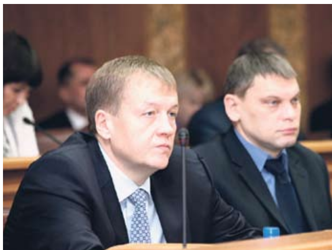
Депутаты фракции КПРФ