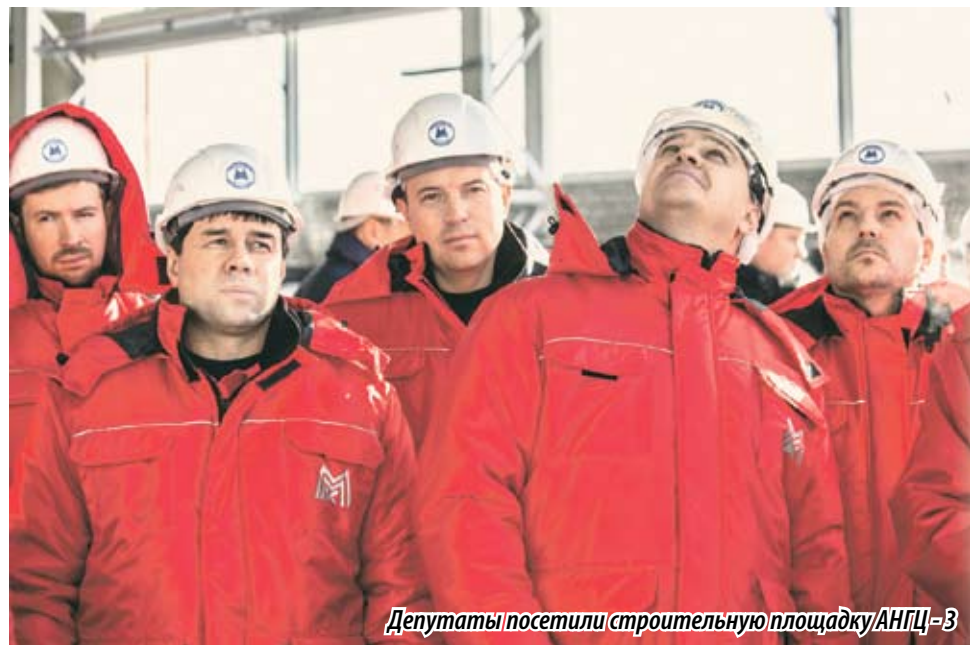
Депутаты посетили строительную площадку АНГЦ-3