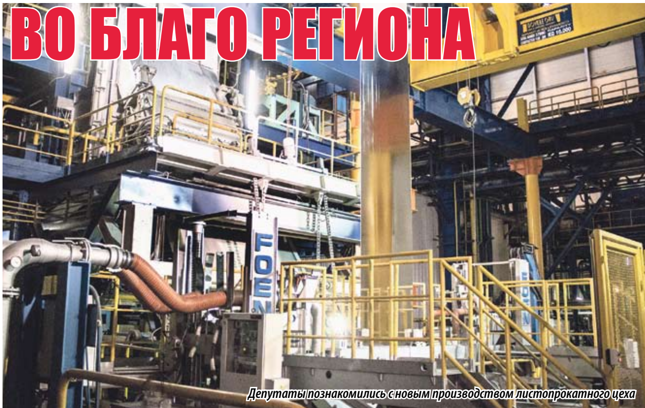
Депутаты познакомилась с новым производством листопрокатного цеха

ХАРАКТЕРИСТИКИ АНГЦ-3 ЛПЦ-11 ОАО «ММК»: НАЧАЛО СТРОИТЕЛЬСТВА: 24 МАРТА 2016 ГОДА. ПУСК АГРЕГАТА: 14 ИЮЛЯ 2017 ГОДА. ПРЕДВАРИТЕЛЬНАЯ СТОИМОСТЬ: 6 МЛРД 784 МЛН РУБЛЕЙ. В ТОМ ЧИСЛЕ СТОИМОСТЬ КОНТРАКТНОГО ОБОРУДОВАНИЯ: 2 МЛРД 196 МЛН РУБЛЕЙ. ТОЛЩИНА ВЫПУСКАЕМОЙ ПОЛОСЫ: 0,25 – 1 ММ. ШИРИНА ПОЛОСЫ: 800 – 1400 ММ. СКОРОСТЬ: 180 М/МИН. ЗАПЛАНИРОВАННАЯ ПРОИЗВОДИТЕЛЬНОСТЬ: 450 ТЫСЯЧ ТОНН В ГОД.