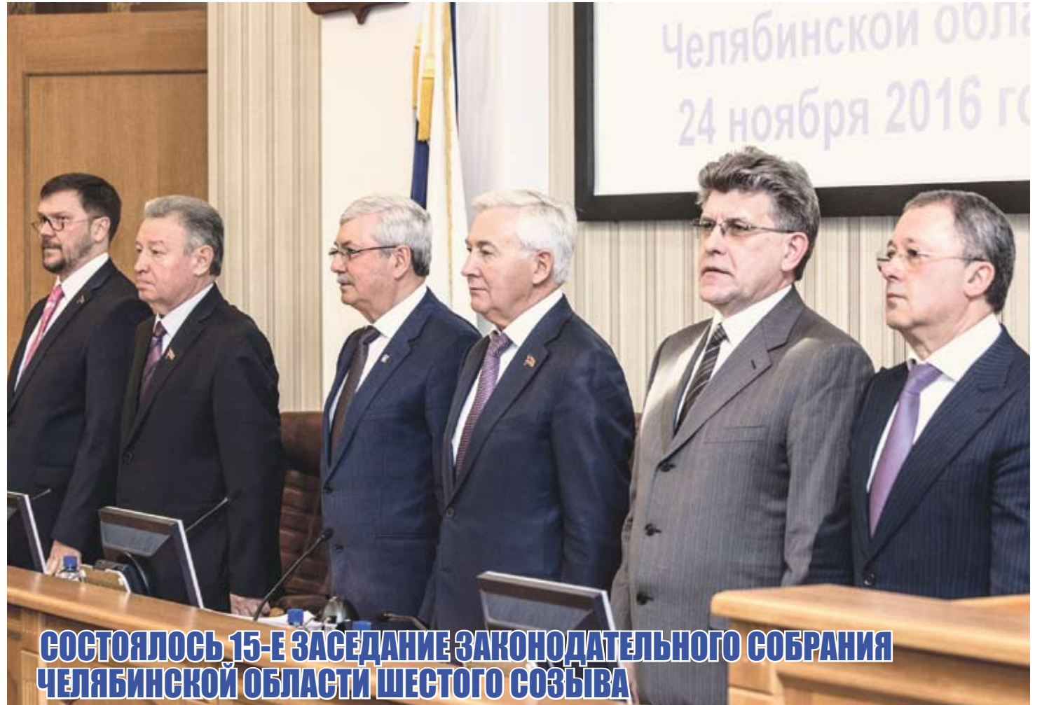
СОСТОЯЛОСЬ 15-Е ЗАСЕДАНИЕ ЗАКОНОДАТЕЛЬНОГО СОБРАНИЯ ЧЕЛЯБИНСКОЙ ОБЛАСТИ ШЕСТОГО СОЗЫВА

В ПРОШЛЫЙ ЧЕТВЕРГ, 24 НОЯБРЯ, СОСТОЯЛОСЬ 15-Е ЗАСЕДАНИЕ ДЕПУТАТОВ ЗАКОНОДАТЕЛЬНОГО СОБРАНИЯ ЧЕЛЯБИНСКОЙ ОБЛАСТИ ШЕСТОГО СОЗЫВА. ПОВЕСТКА НОЯБРЬСКОГО ЗАСЕДАНИЯ ДЕПУТАТСКОГО КОРПУСА БЫЛА НАСЫЩЕННОЙ. ПАРЛАМЕНТАРИИ ПРИНЯЛИ РЯД ВАЖНЕЙШИХ СОЦИАЛЬНЫХ ЗАКОНОВ. ТАК, ПРИНЯТО РЕШЕНИЕ О ЕДИНОВРЕМЕННОЙ ВЫПЛАТЕ СЕЛЬСКИМ ФЕЛЬДШЕРАМ, УВЕЛИЧЕНА ДОХОДНАЯ И РАСХОДНАЯ ЧАСТИ ОБЛАСТНОГО БЮДЖЕТА, УТВЕРЖДЕН НОВЫЙ ПОРЯДОК БЕСПЛАТНОГО ПРЕДОСТАВЛЕНИЯ ЗЕМЕЛЬНЫХ УЧАСТКОВ ДЛЯ ИНДИВИДУАЛЬНОГО ЖИЛИЩНОГО СТРОИТЕЛЬСТВА. КРОМЕ ТОГО, ВНЕСЕНЫ ИЗМЕНЕНИЯ В НАЛОГОВОЕ ЗАКОНОДАТЕЛЬСТВО. ПОДРОБНЕЕ ОБ ЭТИХ И ДРУГИХ ЗАКОНОПРОЕКТАХ ЧИТАЙТЕ В ТЕКУЩЕМ НОМЕРЕ «ПАРЛАМЕНТСКОЙ НЕДЕЛИ». РЯД ЗАКОНОПРОЕКТОВ КАСАЛСЯ ИМУЩЕСТВЕННЫХ ВОПРОСОВ И ТЕХНИЧЕСКОЙ ПРАВКИ.