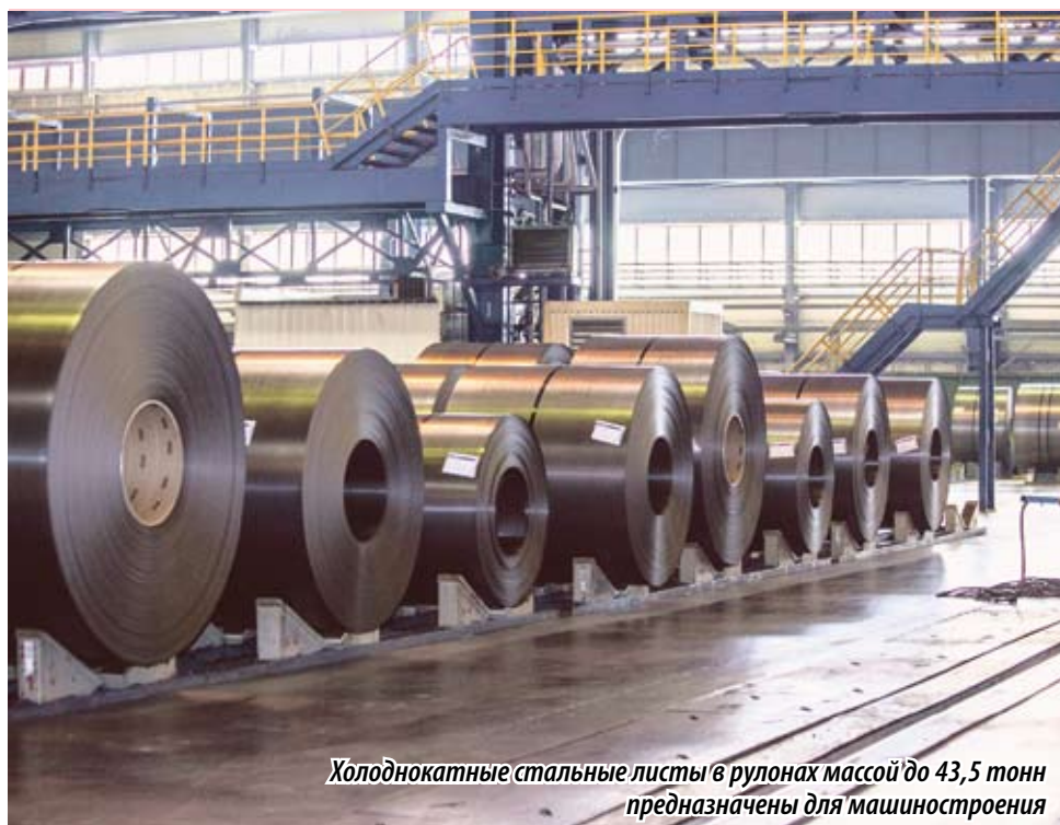
Холоднокатные стальные листы в рулонах массой до 43,5 тонн предназначены для машиностроения

По результатам голосования депутаты Законодательного Собрания в составе двух комитетов единогласно поддержали проекты законов и рекомендовали их к принятию в первом и третьем чтениях. Было отмечено, что новые законы отменяют действие предыдущих. Между тем предприятия, получившие согласно прежним законам право на льготы, которые еще действуют, продолжают эти льготы получать, что оговорено в переходном положении.