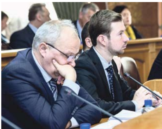
Депутаты фракции «Справедливая Россия»