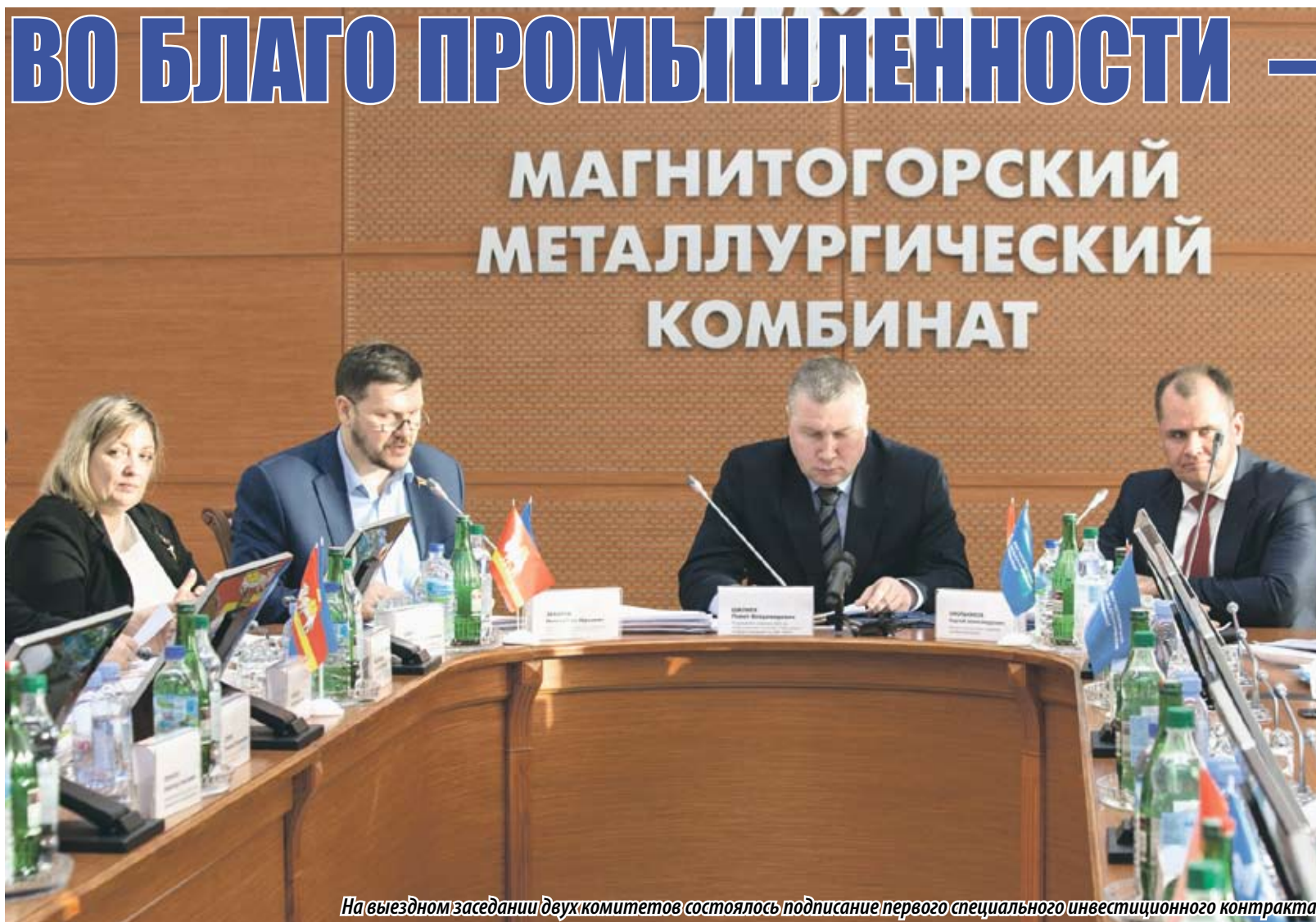
На выездном заседании двух комитетов состоялось подписание первого специального инвестиционного контракта

НЫНЕШНИЙ ГОД МОЖНО НАЗВАТЬ ЗНАКОВЫМ ДЛЯ ПРОМЫШЛЕННОСТИ ЧЕЛЯБИНСКОЙ ОБЛАСТИ: ИМЕННО НА ЮЖНОМ УРАЛЕ ВПЕРВЫЕ В РОССИЙСКОЙ ПРАКТИКЕ СОЗДАН РЕГИОНАЛЬНЫЙ ФОНД РАЗВИТИЯ ДАННОЙ ОТРАСЛИ, ЗАРЕГИСТРИРОВАНЫ ПЕРВЫЕ В ОБЛАСТИ КЛАСТЕР И ИНДУСТРИАЛЬНЫЙ ПАРК. А НАКАНУНЕ В МАГНИТОГОРСКЕ В РАМКАХ СОВМЕСТНОГО ЗАСЕДАНИЯ КОМИТЕТОВ ОБЛАСТНОГО ЗАКОНОДАТЕЛЬНОГО СОБРАНИЯ ПО ПРОМЫШЛЕННОЙ ПОЛИТИКЕ И ТРАНСПОРТУ И ПО ЭКОНОМИЧЕСКОЙ ПОЛИТИКЕ И ПРЕДПРИНИМАТЕЛЬСТВУ ПОДПИСАН ПЕРВЫЙ В РЕГИОНЕ СПЕЦИАЛЬНЫЙ ИНВЕСТИЦИОННЫЙ КОНТРАКТ (СПИК). ПРЕДМЕТОМ КОНТРАКТА МЕЖДУ ЧЕЛЯБИНСКОЙ ОБЛАСТЬЮ И ОАО «МАГНИТОГОРСКИЙ МЕТАЛЛУРГИЧЕСКИЙ КОМБИНАТ» СТАЛ АГРЕГАТ НЕПРЕРЫВНОГО ГОРЯЧЕГО ЦИНКОВАНИЯ № 3, СТРОЯЩИЙСЯ СЕГОДНЯ НА ПРЕДПРИЯТИИ. СТИМУЛОМ ДЛЯ РЕАЛИЗАЦИИ НОВОГО ИНВЕСТПРОЕКТА ПОСЛУЖИЛИ ЗАКОНОДАТЕЛЬНЫЕ ИНИЦИАТИВЫ.