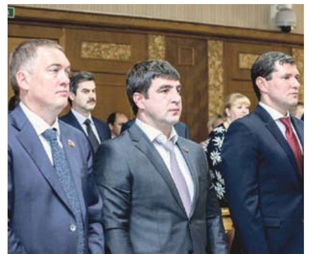
Депутаты фракции ЛДПР