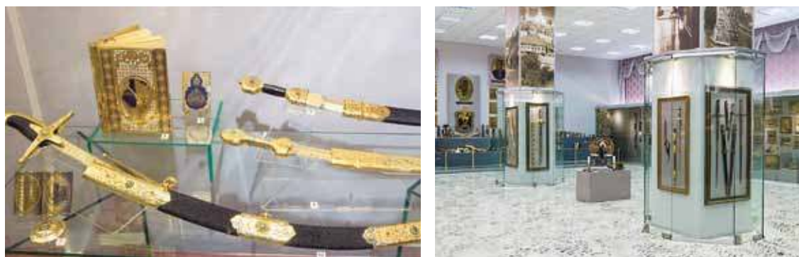
Владимир МЯКУШ, председатель Законодательного Собрания Челябинской области (фракция «Единая Россия»):

В рамках рабочего визита в Златоуст центральными стали вопросы улучшения медицинского обслуживания жителей, а именно необходимость проведения капитального ремонта в кардиологическом диспансере городской больницы № 3. В свое время мы провели рабочее совещание, определив пути решения проблемы. Соответствующее обращение было направлено в адрес губернатора Челябинской области Бориса Дубровского, чьим распоряжением были выделены средства на разработку проектно-сметной документации. Сегодня мы также обсудили возможность уменьшения сроков проведения самого капитального ремонта. Думаю, что Борис Александрович поддержит предложение, и средства на проведение ремонта в кардиологическом отделении будут изысканы. В свою очередь исполнение решений, которые приняты на сегодняшнем оперативном совещании, проконтролируют депутаты Законодательного Собрания. Уверен, что уже в ближайшее время жители Златоуста почувствуют улучшение медицинского обслуживания.