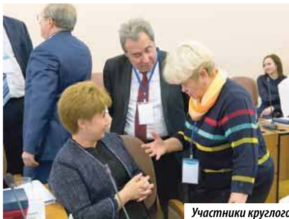
Участники круглого стола проанализировали эффективность реформы МСУ в Челябинске

По результатам заседания круглого стола была выработана резолюция, в которую вошли все озвученные предложения.