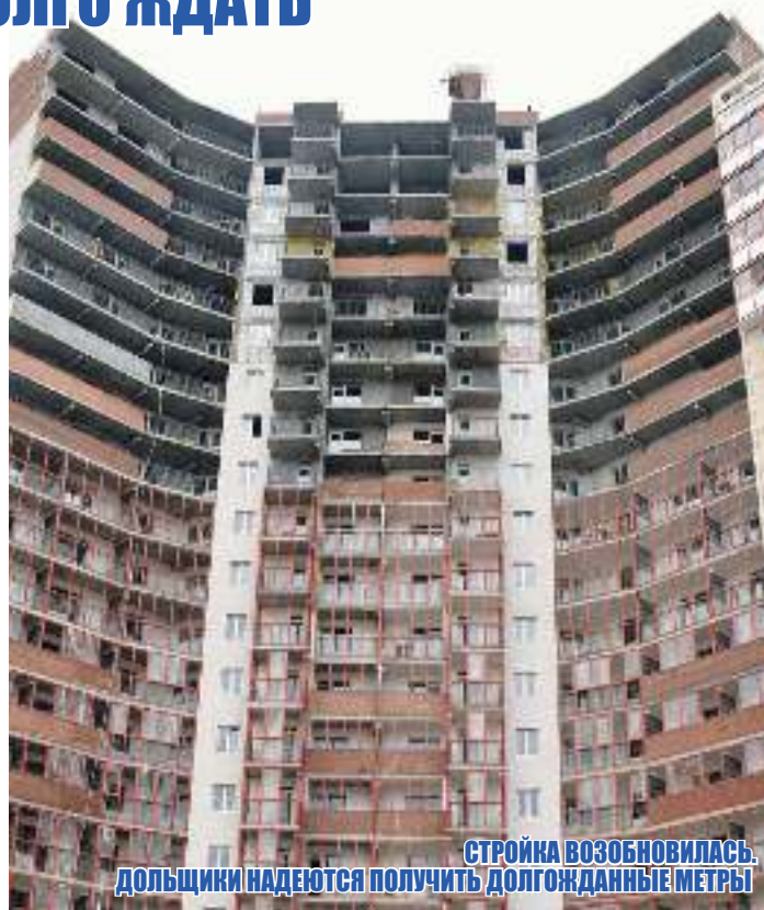
СТРОЙКА ВОЗОБНОВИЛАСЬ. ДОЛЬЩИКИ НАДЕЮТСЯ ПОЛУЧИТЬ ДОЛГОЖДАННЫЕ МЕТРЫ