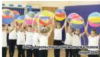
Одно удовольствие заниматься в таком спортзале