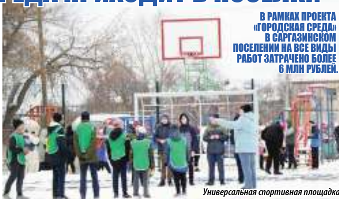
Универсальная спортивная площадка

Тем временем уже рядом и звуки музыки, возвещающие о скором начале праздника, посвященного окончанию работ по благоустройству придомовых территорий. Проще говоря, праздник двора. Председатель Законодательного Собрания останавливается для