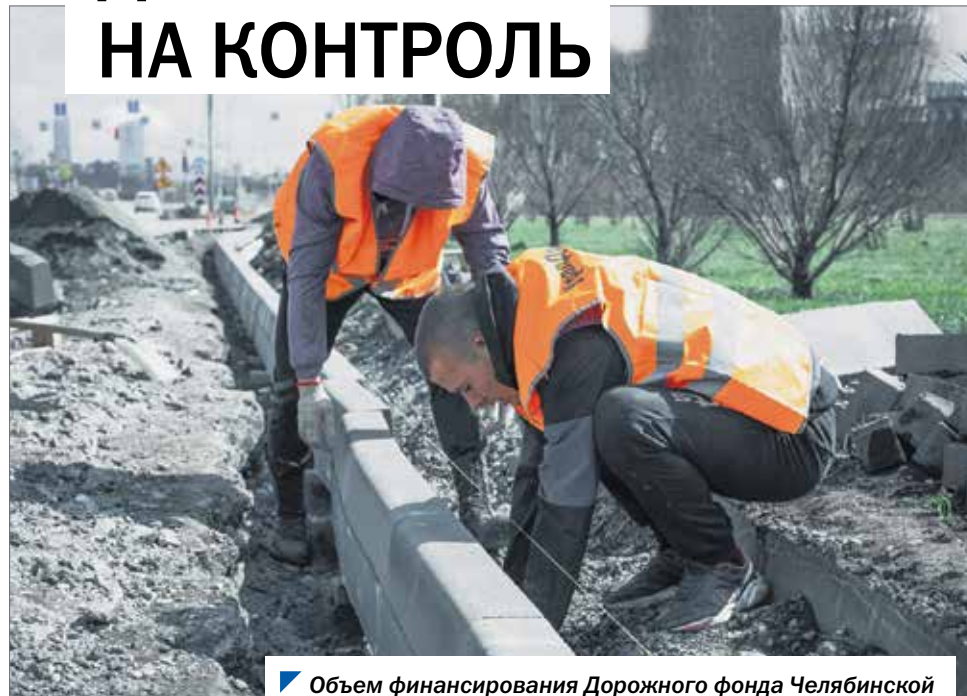
Объем финансирования Дорожного фонда Челябинской области в 2020 году составил 22,5 миллиарда рублей.

программой Челябинской области предусмотрены строительство и реконструкция свыше 23 км дорог, расположенных в сельской местности. Работы выполняются в большей мере за счет областного и федерального бюджетов с привлечением средств муниципалитетов. На цели программы «Комплексное развитие сельских территорий в Челябинской области» потрачено свыше 269 миллионов рублей.