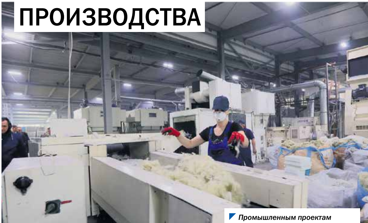
Промышленным проектам оказывается адресная поддержка.

В регионе реализуется государственная программа «Развитие промышленности, новых технологий и природных ресурсов Челябинской области». В этом году на эти цели предусмотрено 324,1 миллиона рублей.