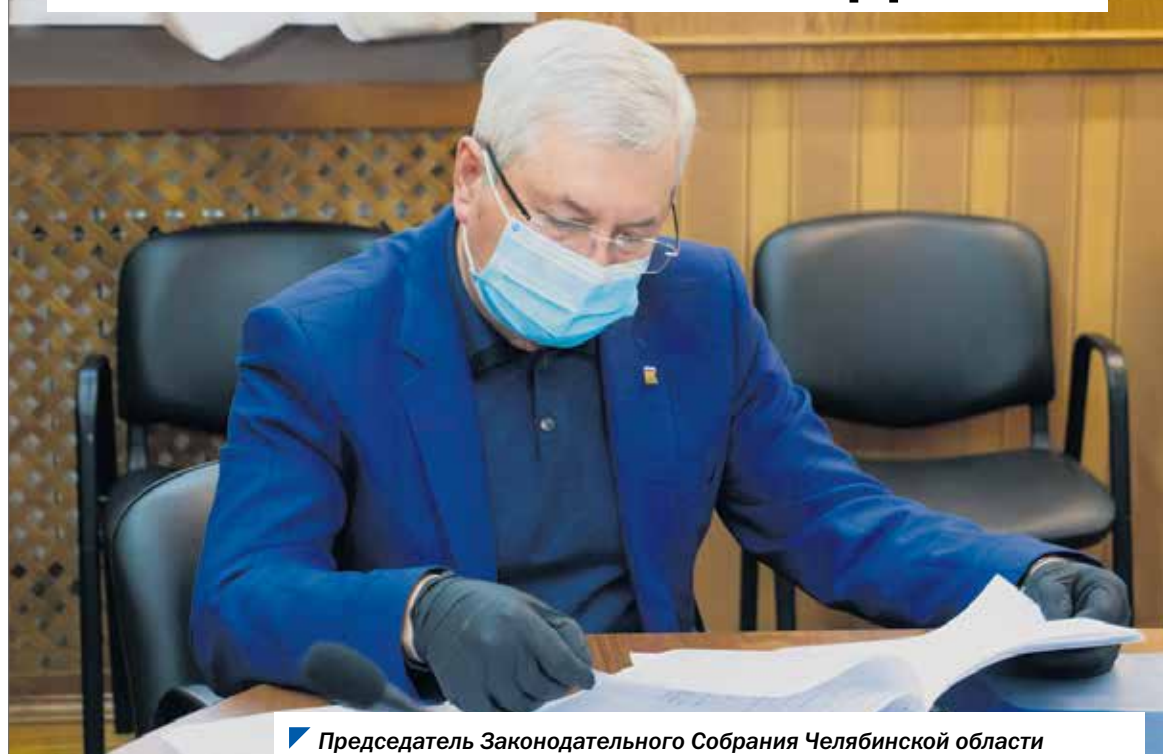
Председатель Законодательного Собрания Челябинской области Владимир Мякуш принял участие в работе комитета по бюджету и налогам.

На заседании комитета Законодательного Собрания по бюджету и налогам депутаты рассмотрели изменения в бюджетное законодательство.