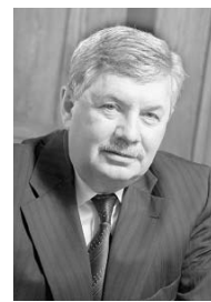
Владимир МЯКУШ, председатель Законодательного Собрания Челябинской области, председатель комитета по бюджету и налогам (фракция «Единая Россия»):

Чтобы иметь возможность еще раз обсудить все параметры нового бюджета, поправки и замечания от депутатов, было решено принять законопроект «Об областном бюджете на 2012 год и на плановый период 2013 и 2014 годов» в первом чтении. Но уже в середине декабря парламентарии вернуться к этому вопросу.