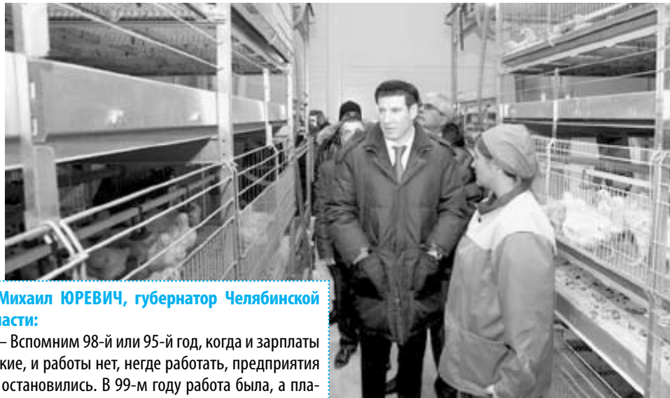
Михаил ЮРЕВИЧ, губернатор Челябинской области:

— Этого в нашей стране не будет, — высказал губернатор свое мнение. — Системный кризис сейчас присутствует в странах, потому что они перекредитованы. Развивающиеся страны стали выпускать то, что раньше делали развитые. Укре-