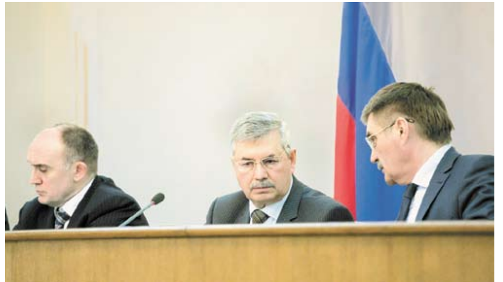
В публичных слушаниях вместе с жителями области и депутатами приняли участие руководители области: губернатор Борис Дубровский и первый заместитель губернатора Сергей Комяков.

Второе по важности объема финансовых ресурсов направление – это социальная защита населения. На эти цели выделяется практически каждый четвертый рубль областного бюджета, или 27,4 миллиарда. При этом все