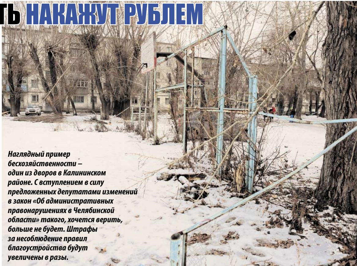
Наглядный пример бесхозяйственности – один из дворов в Калининском районе. С вступлением в силу предложенных депутатами изменений в закон «Об административных правонарушениях в Челябинской области» такого, хочется верить, больше не будет. Штрафы за несоблюдение правил благоустройства будут увеличены в разы.

Кроме того, проектом закона предложено установить административную ответственность за сжигание листьев, травы, части деревьев и кустарников, за исключением случаев, предусмотренных федеральным законодательством, а также за сброс мусора и других отходов производства и потребления вне специально