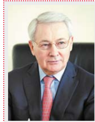
Юрий Карликанов, первый заместитель председателя Законодательного Собрания Челябинской области, председатель комитета по строительной политике (фракция «Единая Россия»):

В общей сложности в этом году во всех муниципальных образованиях Южного Урала сформирован 971 земельный участок, но это, как обратил внимание Юрий Карликанов, составляет лишь 70 процентов от потребности в земельных участках граждан, поставленных на учет в 2014 году. К тому же из сформированного 971 земельного участка предоставлен гражданам на 1 ноября 2014 года 661 земельный участок, следовательно, воспользовались своим правом на получение земельного участка только 47 процентов граждан.