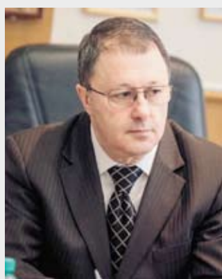
Семен Мительман, заместитель председателя Законодательного Собрания Челябинской области, председатель комитета по законодательству, государственному строительству и местному самоуправлению (фракция «Единая Россия»):

На ноябрьское заседание Законодательного Собрания проект закона предложено вынести пока только в первом чтении.