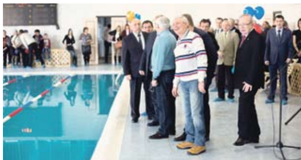
Открытие ФОКа в Верхнеуральске. Январь 2016 года.