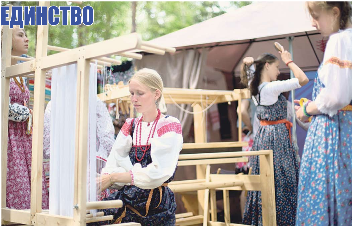
Бажовский фестиваль, ежегодно проводимый на Южном Урале, стал настоящим символом дружбы и единства народов. На снимке – один из моментов праздника национальных культур.

– Простой пример: Ассамблея народов России была создана в 1997 году, а Ассамблея народов Челябинской области – в 1996 году, – напомнил руководитель Славянского центра. – Наш регион стал первым в стране, где про-