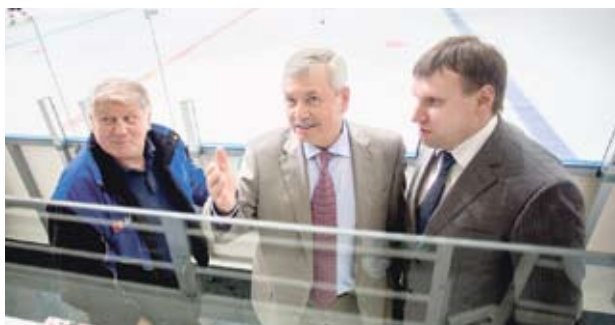
Открытие ФОКа «Танганай» в Златоусте. Май 2015 года.