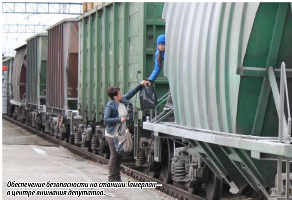
Обеспечение безопасности на станции Тамерлан — в центре внимания депутатов.