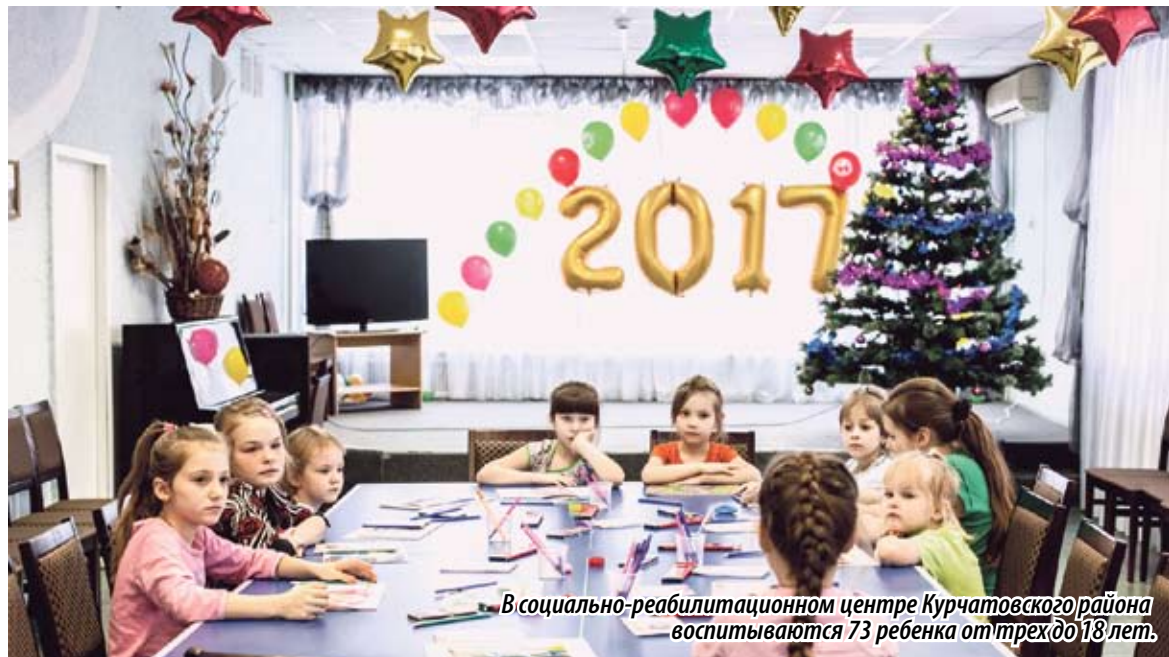
В социально-реабилитационном центре Курчатовского района воспитываются 73 ребенка от трех до 18 лет.

Добавим, что в настоящее время в социально-реабилитационном центре Курчатовского района воспи-