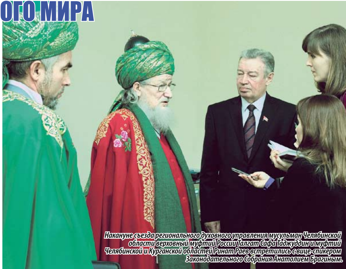
Накануне съезда регионального духовного управления мусульман Челябинской области верховный муфтий России Талгат Сафа Таджуддин и муфтий Челябинской и Курганской областей Ринат Раев встретились с вице-спикером Законодательного Собрания Анатолием Брагиным.

— Наши предки столетиями жили в мире и согласии, — прокомментировал верховный муфтий России. — И этот принцип сохраняется и укрепляется в наши дни. Стоит отметить, что в Челябинской области между региональным духовным управлением и православной церковью заключено соглашение о сотрудничестве в социальной сфере, а также в сфере благотворительности. Подобное соглашение также заключено в Хабаровском крае, в Оренбургской, Астраханской областях, а также в ряде других российских регионов. И это добрый пример взаимного сотрудничества на благо общества. Ведь наш народ един, и даже глава государства в своем очередном послании Федеральному Собранию сказал, что у нас «одна страна, один народ и единая Россия». Это очень правильная позиция, ведь все хорошо понимают, что от мира и согласия многое зависит и в развитии экономической мощи страны и ее процветание в целом.