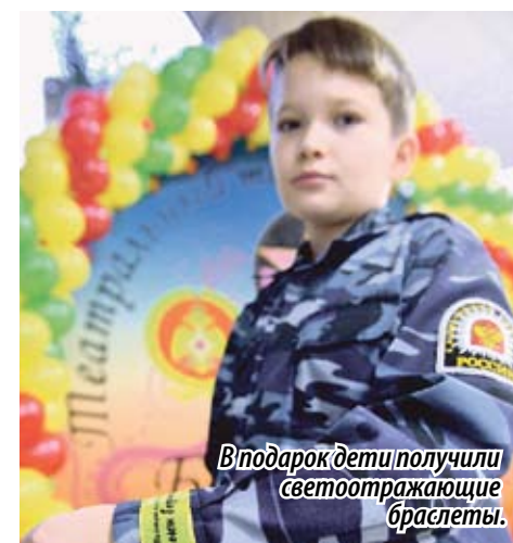
В подарок дети получили светоотражающие браслеты.

тям проще воспринимать важную информацию. В общей сложности на театральный марафон «Уроки безопасности» было приглашено порядка 480 юных школьников. Все ребята получили в подарок светоотражающие браслеты, которые тут же надели на руки. Как только в зале погас свет, школьники смогли убедиться, что в темноте браслеты светятся. Такое же свойство они проявляют и на дорогах в темное время суток, благодаря чему пешеход становится заметен водителю.