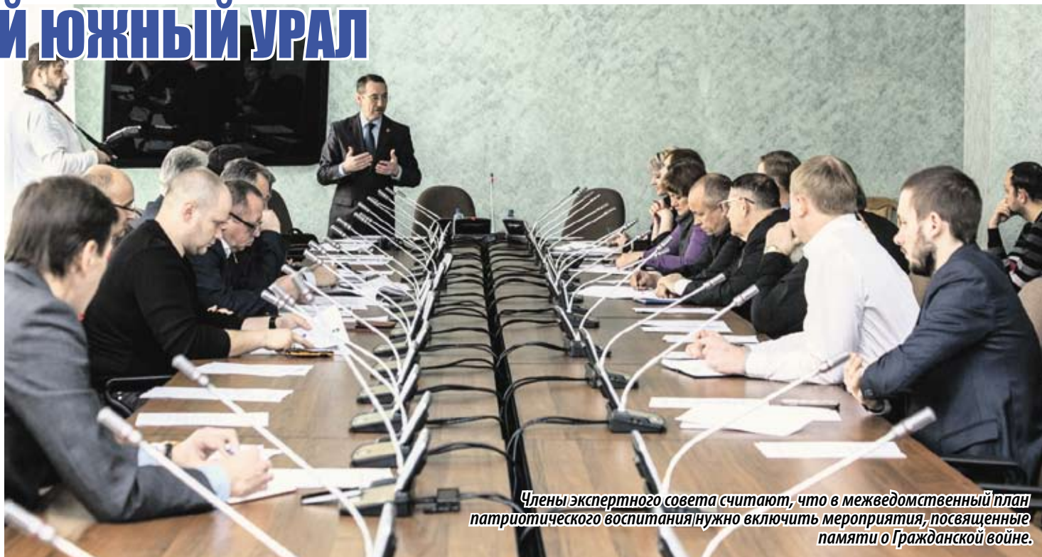
Члены экспертного совета считают, что в межведомственный план патриотического воспитания нужно включить мероприятия, посвященные памяти о Гражданской войне.

ЭКСПЕРТНЫЙ СОВЕТ ПО ПАТРИОТИЧЕСКОМУ ВОСПИТАНИЮ И ВОЕННО-ШЕФСКОЙ ДЕЯТЕЛЬНОСТИ ПРИ ЗАКОНОДАТЕЛЬНОМ СОБРАНИИ ЧЕЛЯБИНСКОЙ ОБЛАСТИ РАБОТАЕТ НА ПРОТЯЖЕНИИ 10 ЛЕТ, ОБЪЕДИНЯЯ ПОД СВОЕЙ ЭГИДОЙ АВТОРИТЕТНЫЕ ОРГАНИЗАЦИИ, СОТРУДНИЧАЯ С ГОСУДАРСТВЕННЫМИ ОРГАНАМИ. ЗА ЭТО ВРЕМЯ ДОСТИГНУТЫ НЕМАЛЫЕ УСПЕХИ, ДА И СОБСТВЕННО САМ СТАТУС СОВЕТА ПОДНЯЛСЯ — ОТ ОБЩЕСТВЕННОГО К ЭКСПЕРТНОМУ. МЕЖДУ ТЕМ СОСТОЯВШЕЕСЯ НАКАНУНЕ ЗАСЕДАНИЕ ПРОШЛО КАК В ПЕРВЫЙ РАЗ, — ДИСКУССИЯ ПОЛУЧИЛАСЬ НАСЫЩЕННОЙ, ЭМОЦИОНАЛЬНОЙ, В ЧЕМ-ТО ДАЖЕ ЖАРКОЙ. ИНАЧЕ, НАВЕРНОЕ, И БЫТЬ НЕ МОЖЕТ, ИБО ПАТРИОТИЗМ — ФУНДАМЕНТ ЛЮБОГО ЗДОРОВОГО ОБЩЕСТВА.