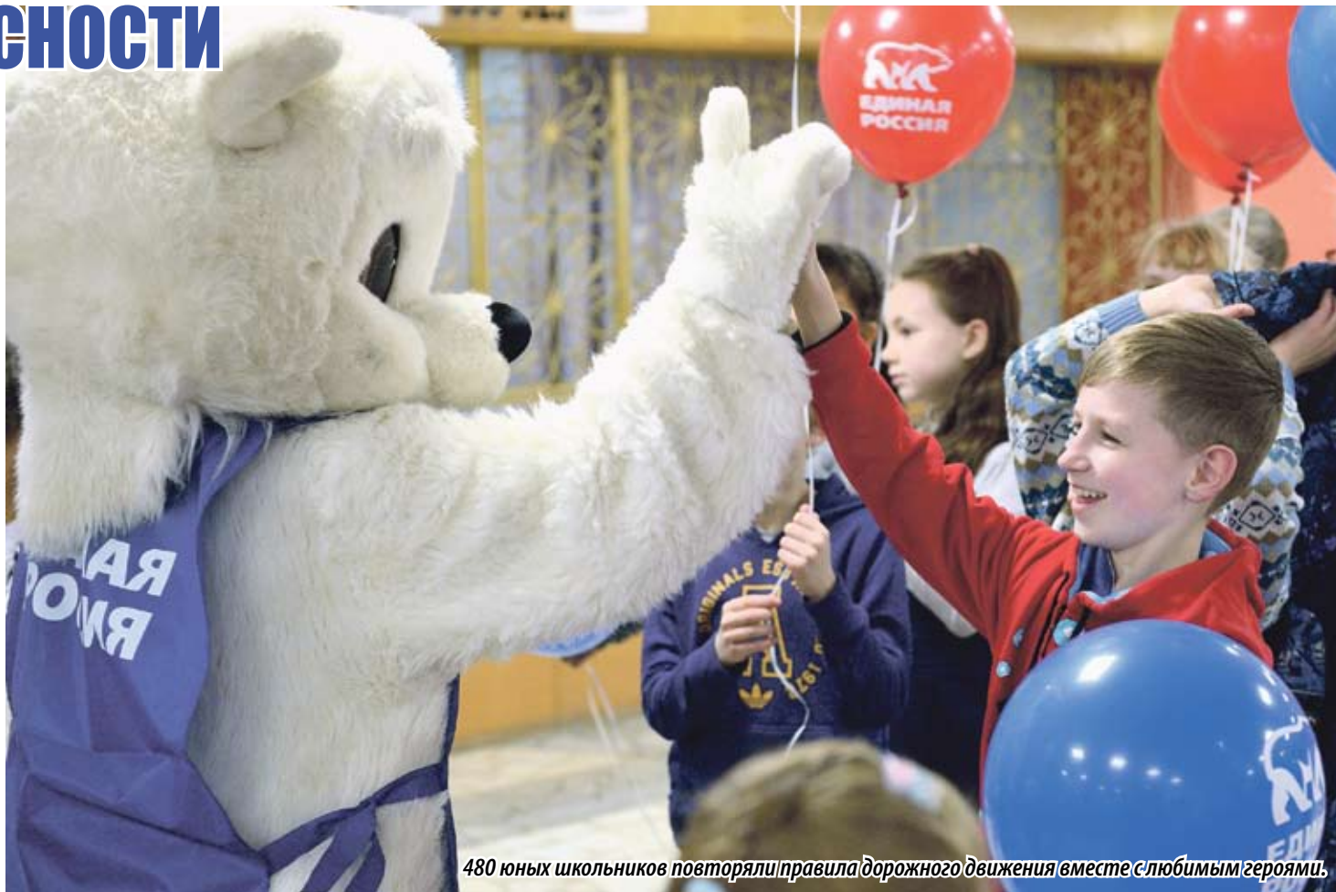
480 юных школьников повторяли правила дорожного движения вместе с любимым героем.