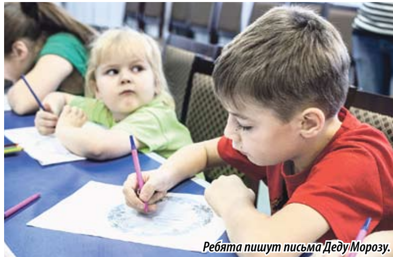
Ребята пишут письма Деду Морозу.

— А я попросила у Деда Мороза, чтобы мама психолог вылечилась, выписалась из больницы и забрала нас с сестрой домой, — призналась воспитанница социально-