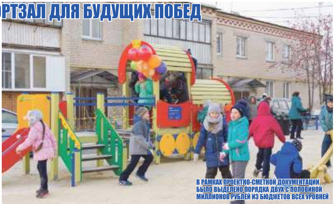
В РАМКАХ ПРОЕКТНО-СМЕТНОЙ ДОКУМЕНТАЦИИ БЫЛО ВЫДЕЛЕНО ПОРЯДКА ДВУХ С ПОЛОВИНОЙ МИЛЛИОНОВ РУБЛЕЙ ИЗ БЮДЖЕТОВ ВСЕХ УРОВНЕЙ