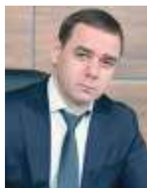
Александр ЛАЗАРЕВ, глава города Южноуральска:

Считаю, необходимо и крайне важно проводить публичное обсуждение проекта бюджета. Поскольку в таком формате у всех, кто участвует в публичных слушаниях, появляется возможность озвучить свои предложения, замечания, внести какие-либо корректировки, а значит, и сформировать более эффективный бюджет.