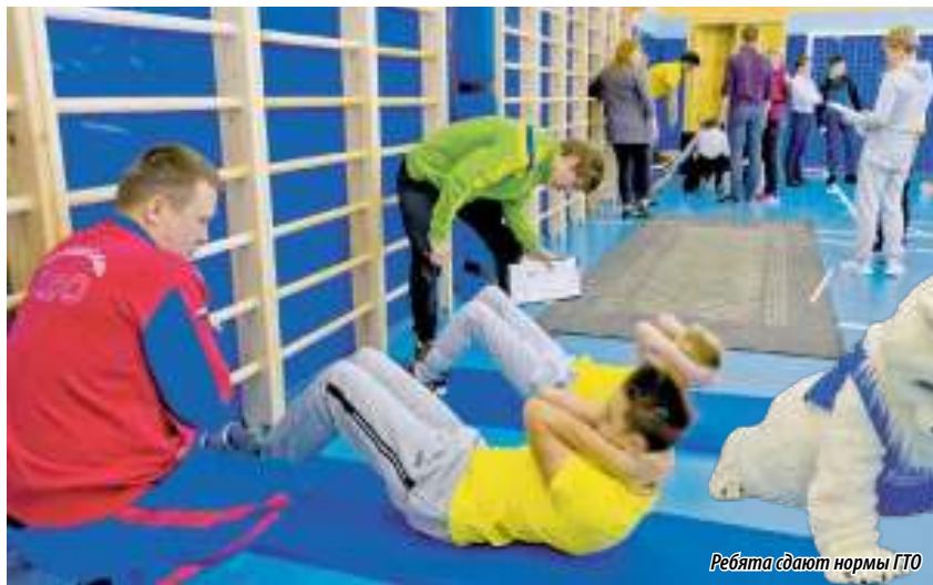
Ребята сдают нормы ГТО