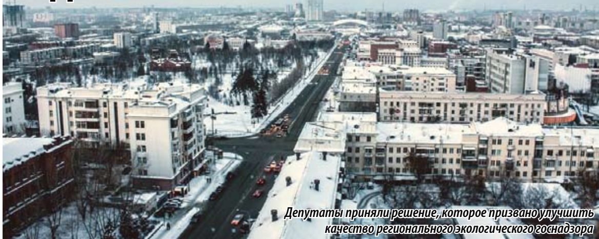
Депутаты приняли решение, которое призвано улучшить качество регионального экологического госнадзора

На ноябрьском заседании Законодательного Собрания Челябинской области приняты изменения в Закон Челябинской области «О пользовании недрами на территории Челябинской области». Депутаты отнесли к компетенции министерства имущества и природных ресурсов Челябинской области — уполномоченного органа в сфере недр — полномочия по созданию и ведению областного фонда геологической информации, по установлению порядка и условий использования геологической информации о недрах, владельцем которой является Челябинская область.