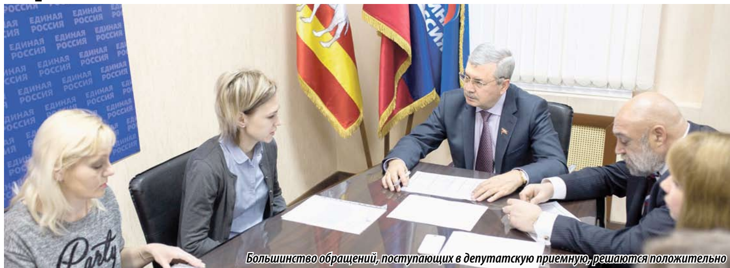
Большинство обращений, поступающих в депутатскую приемную, решаются положительно