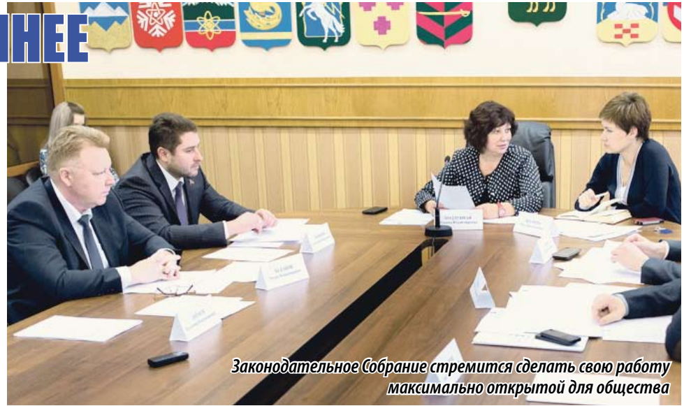
Законодательное Собрание стремится сделать свою работу максимально открытой для общества

В списке победителей этого года и молодые журналисты, и те, кто сотрудничает с Законодательным Собранием уже много лет. Их материалы объективно и компетентно освещают деятельность Законодательного Собрания, разъясняют его роль в решении вопросов социально-экономического развития Челябинской области, способствуют повышению уровня политической культуры населения.