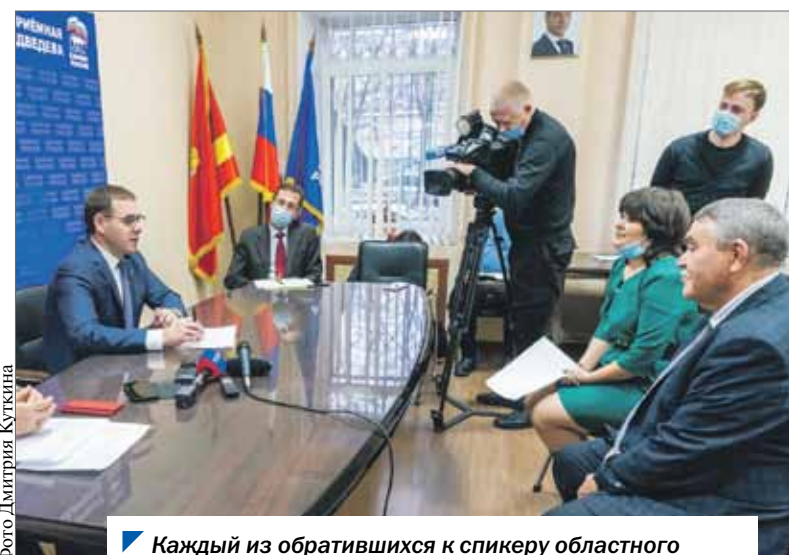
▲ Каждый из обратившихся к спикеру областного парламента получил положительное решение вопроса.

Добавим, за последний год в региональную общественную приемную «Единой России» обратились более 1600 южноуральцев. Как правило, основные вопросы, с которыми жители приходят в депутатские центры, касаются социальной сферы и ЖКХ. Более половины вопросов за год решено положительно.