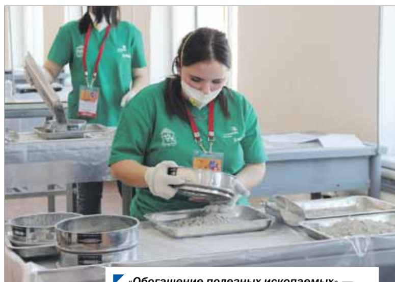
▲ «Обогащение полезных ископаемых» — новая компетенция нынешнего чемпионата.

С 22 по 26 ноября в Пласте проходил IX Открытый региональный чемпионат WorldSkills. Соревнования для молодых профессионалов организовали в филиале Копейского политехнического колледжа.