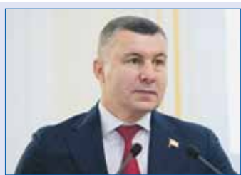
Евгений Илле, председатель комитета Законодательного Собрания по экономической политике и предпринимательству (фракция «Единая Россия»):

При увеличении размера ежемесячной выплаты с 1 января будущего года дополнительная потребность в средствах бюджета области на 2022—2024 годы составит свыше 41,7 миллиона рублей ежегодно.