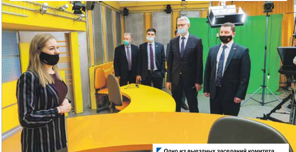
Одно из выездных заседаний комитета состоялось на площадке телеканала «Урал 1»