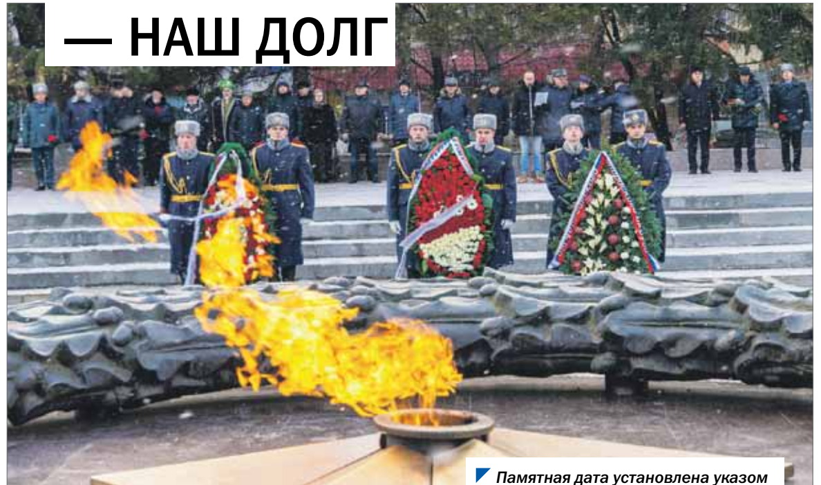
Памятная дата установлена указом президента России в 2014 году.

Отметим, свыше 4,5 миллиона советских солдат значатся