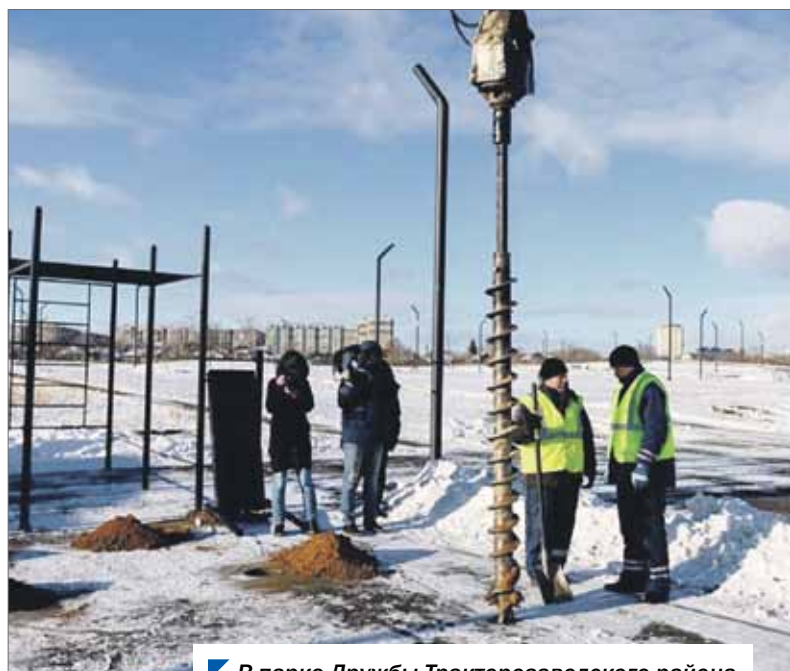
В парке Дружбы Тракторозаводского района завершается строительство воркаут-площадки.