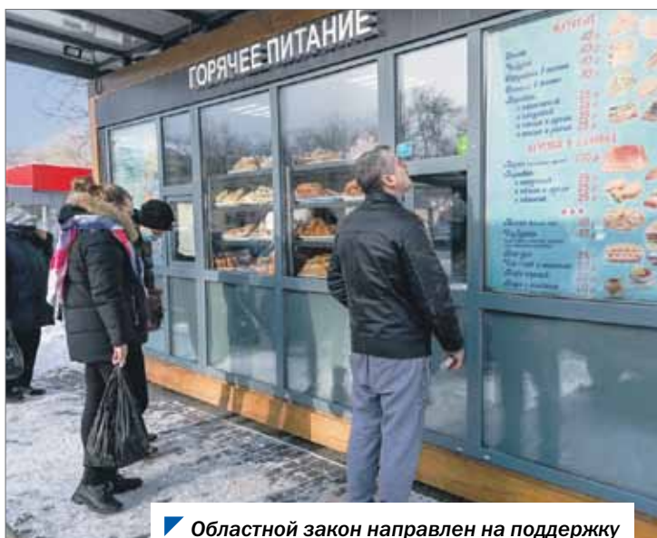
Областной закон направлен на поддержку добросовестных владельцев киосков.

— Амнистия действовала до 31 декабря 2021 года, и, если бы мы ее не продлили, нормы закона о праве на компенсационное место не распространялись бы на хозяйствующие субъекты, которым было отказано в заключении догово-